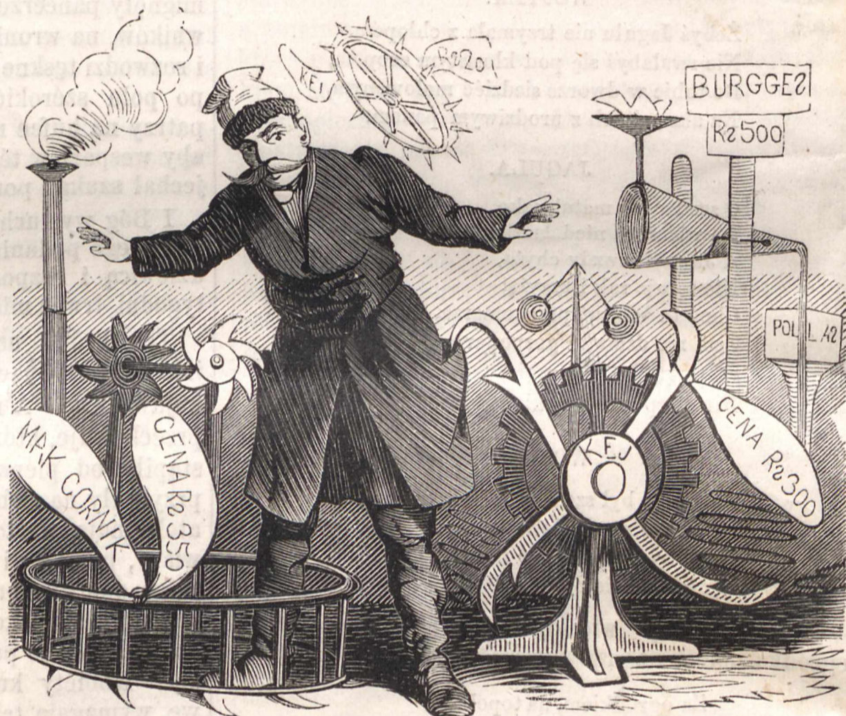
Nr. XII. MASZYNY ROLNICZE.