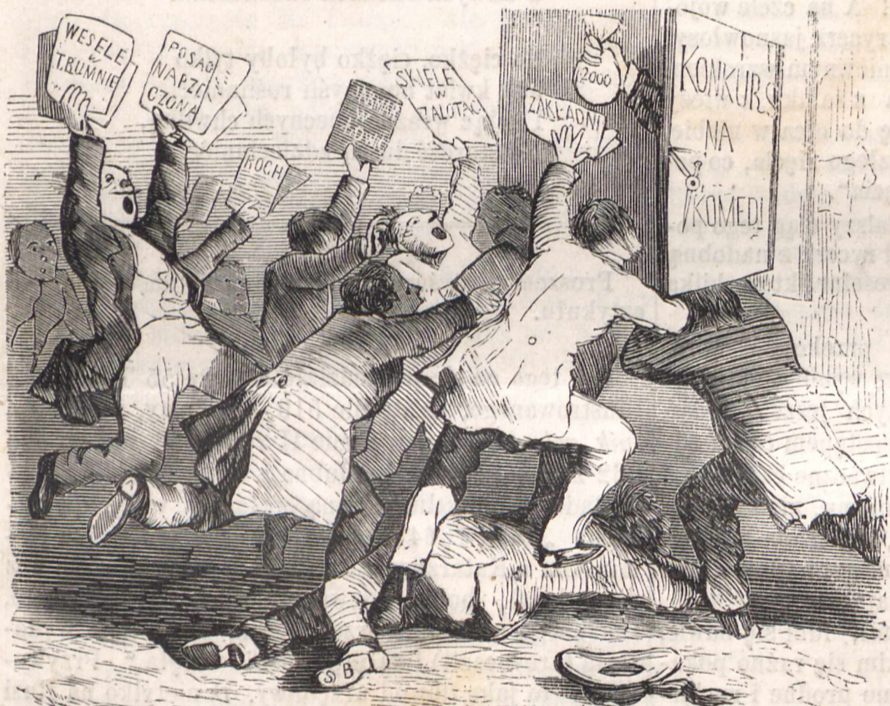
Nr. XI. WALKA O PREMIUM KONKURSOWE.