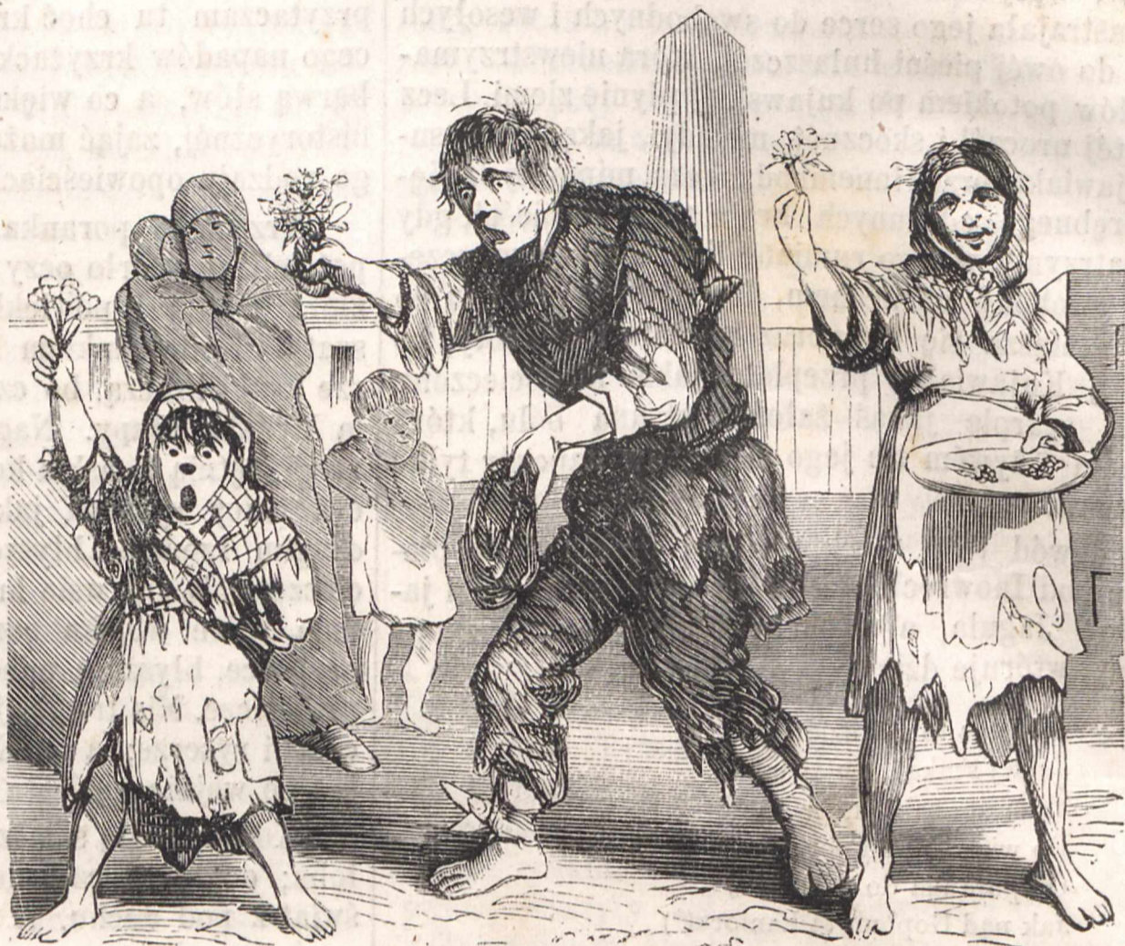
Nr. X. RUCHAWKA ŻEBRACZA.