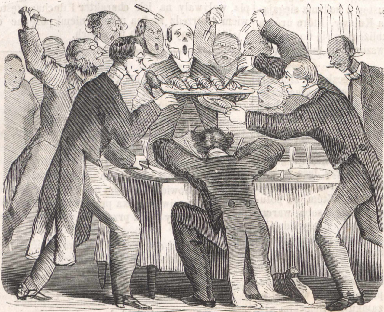
Nr. IX. SZERMIERZE PÓLMISKOWI.