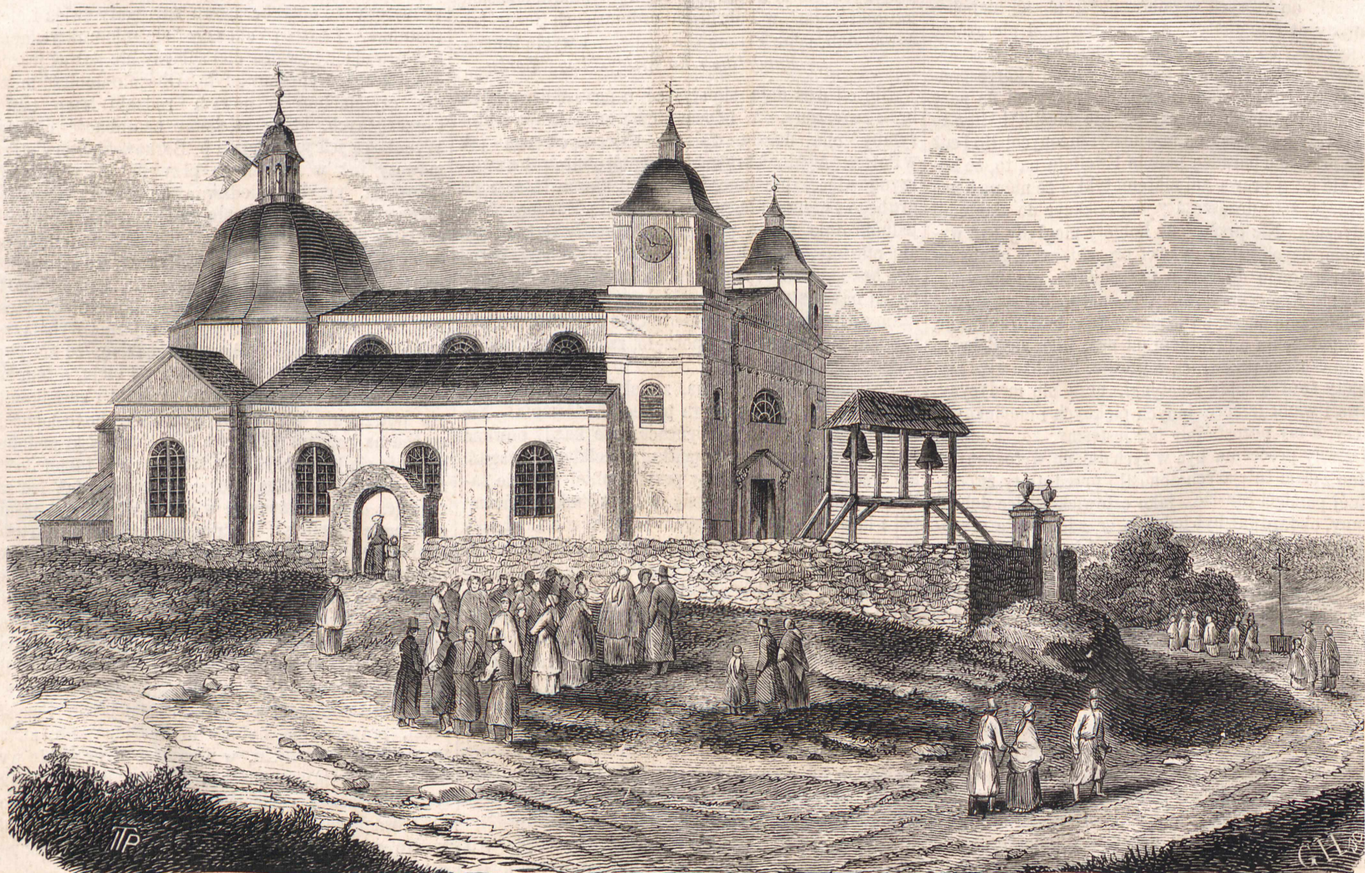
KOŚCIÓŁ W SUCHEDNIOWIE.