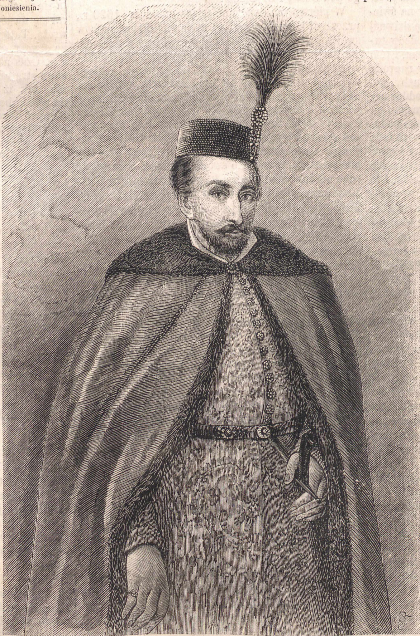
STANISŁAW ŻÓŁKIEWSKI. (Podług portretu znajdującego się w zbiorze hr. ordynata Zamojskiego).

Tak poniżająca ugoda, zawarta bez wiedzy i zezwolenia stanów, oburzyła Rzeczpospolitą i oburzenie to najboleśniej uczuć się dało hetmanowi; a gdy wbrew tej ugodzie Kozacy nowych na morzu Czarnym dopuścili się napaści, niebawem powetowanych na Polsce rozpuszczeniem zagonów tatarskich po Ukrainie i Pokuciu, hetman z 23 tysiącami wyborczego wojska stojący na Podolu pod Oryninem, znowu pozostał bezczynnym, a to podwoiło przeciw niemu utyskiwania i gorzkie wyrzuty o niedołęztwo lub wyraźną niechęć dla Rzeczypospolitej. Było jednak w tych wyrzutach więcej zawiści niż prawdy. Żółkiewski, jako doświadczony mąż stanu, wiedział że Rzeczpospolita w kłopotach i rozprężeniu rządu nie wytrzyma ciężaru wojny z Turcją, która wymagała wielkich i przedłużonych ofiar; wolał więc trzymać się odpornie, niż rozjątrzać tak wielką potęgę, która, raz wybiegłszy,