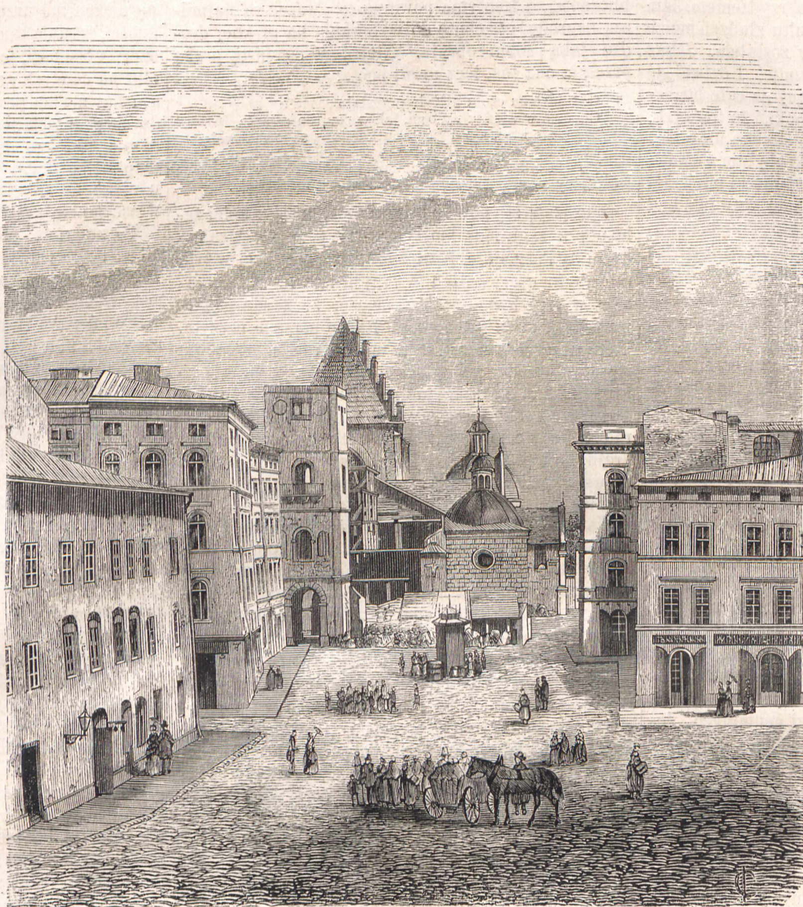
KOŚCIÓŁ DOMINIKAŃSKI W KRAKOWIE.

I miejsce gdzie się znajdowało tyle zabytków sztuki, tyle szacownych pomników, gdzie spoczywały prochy jednego z władców tej ziemi, gdzie