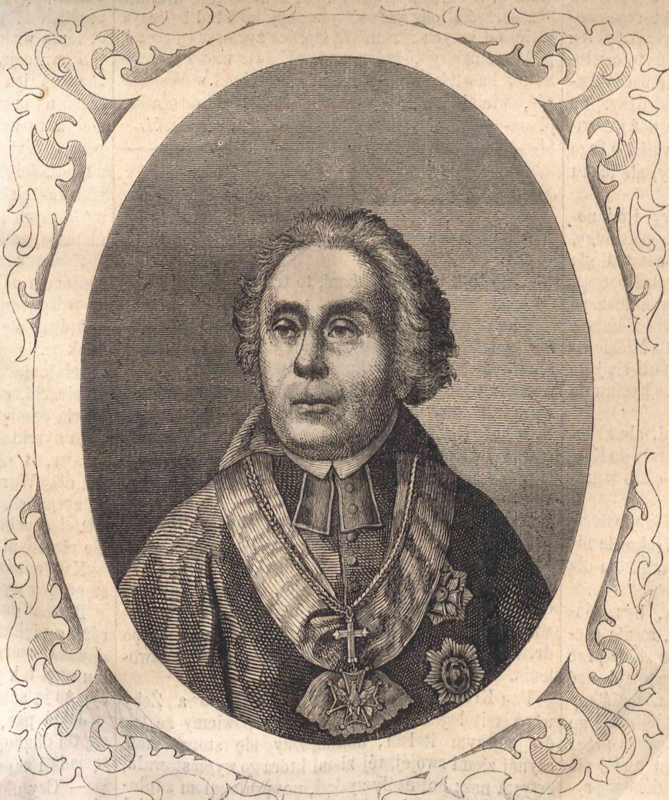
JAN PAWEŁ PAWEŁA WORONICZ.

Pamiętniki z tego czasu które go nam malują, wcale opacznie pojęły tę postać wieszczą narodowego i arcykapłana, smutną, poważną i niesącą z sobą wszędzie duszny ucisk boleści, przecierpianej za wszystkich, uczutej goręcej nad innych ludzi. Wśród do- syc płochego świata, na pół oślepego dobrowolnie, na pół zgłuchłego lub słyszeć niechającego, Woronicz,