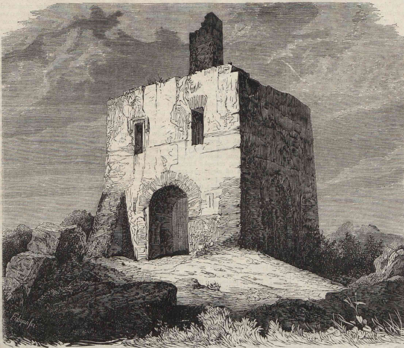
SZCZĄTKI ZAMKU W PRZEDBORZU. (Rysował i rytował Fabijański.)

Zapatruje się zrzemca wolności, trybunał koronny, w nadzieję przyszłych koron, do których waszej królewskiej mości wysokie talenta prawo nadają. Widzi w osobie waszej królewskiej mości wspaniałość umysłu, upatruje nie wysłowione przymioty, czyta z twarzy dziecinnie najjaśniejszego domu cnoty; słowem złączonych doskonałości istocie, pochwał i podziwienia odmówić nie może. Ztąd ta udzielona od najjaśniejszego majestatu stanowi szlacheckiemu prerogatywa, trybunał koronny, najdystyngowanisze w tobie najjaśniejszy panie z najgłębszym uszanowaniem adoruje godności; ztąd ta namiestnicza monarchy swego władza, swoje waszej królewskiej mości wiecznymi obowiązkami zniewolone submittuje serca.