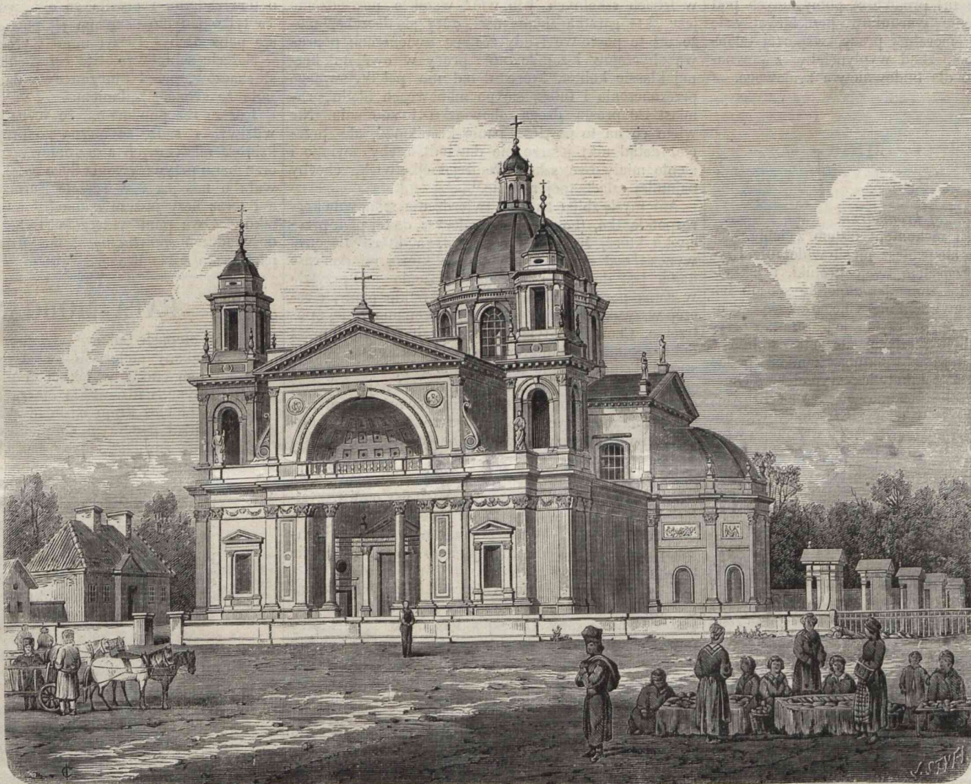
KOŚCIÓŁ W WILLANOWIE. (Rysował na drzewie Cegliński, z natury T. Heppen).

....Szczęście wielkie, zem dzisiaj karku nie złamał. Głupia ta Nowagóra. Moja żona jest dziesięć lat starszą odemnie, a Babetta ma lat osnaście.... Powiniennem zawsze tę Nowagórę omijać. Dziś mi Pan Bóg darował, mam kark cały i zebra całe. Zrazy polskie były przesolone. Kasia pokojówka ma czarne oczy. Landsdragon Hans pożyczł u mnie brzytwy, która mnie kosztuje dwa cwancygiery. Chłopi nie lubią dziedzica, bo na niego robić muszą. Powiedziałem wójtowi, że jak będą co mieli na dziedzica, to niech przyjdą do Hubera, a Huber zaprowadzi ich do starosty, gdy będzie w dobrym humorze. Zrazy były przy-