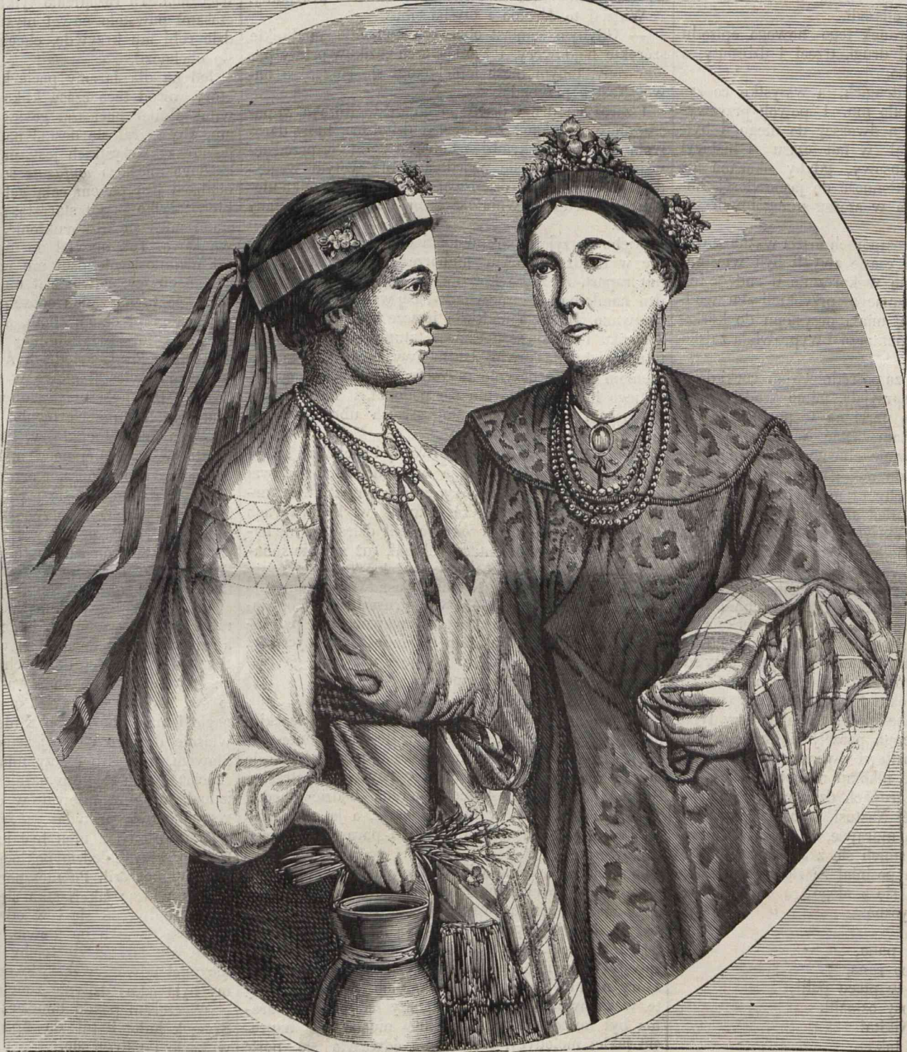
TYPY UKRAIŃSKIE. DZIEWCZĘTA Z OKOLIC CZEHRZYNA. Rysował z natury Przyszychowski).

Jarema patrzył na Amsdiner, jakby tych filozo-