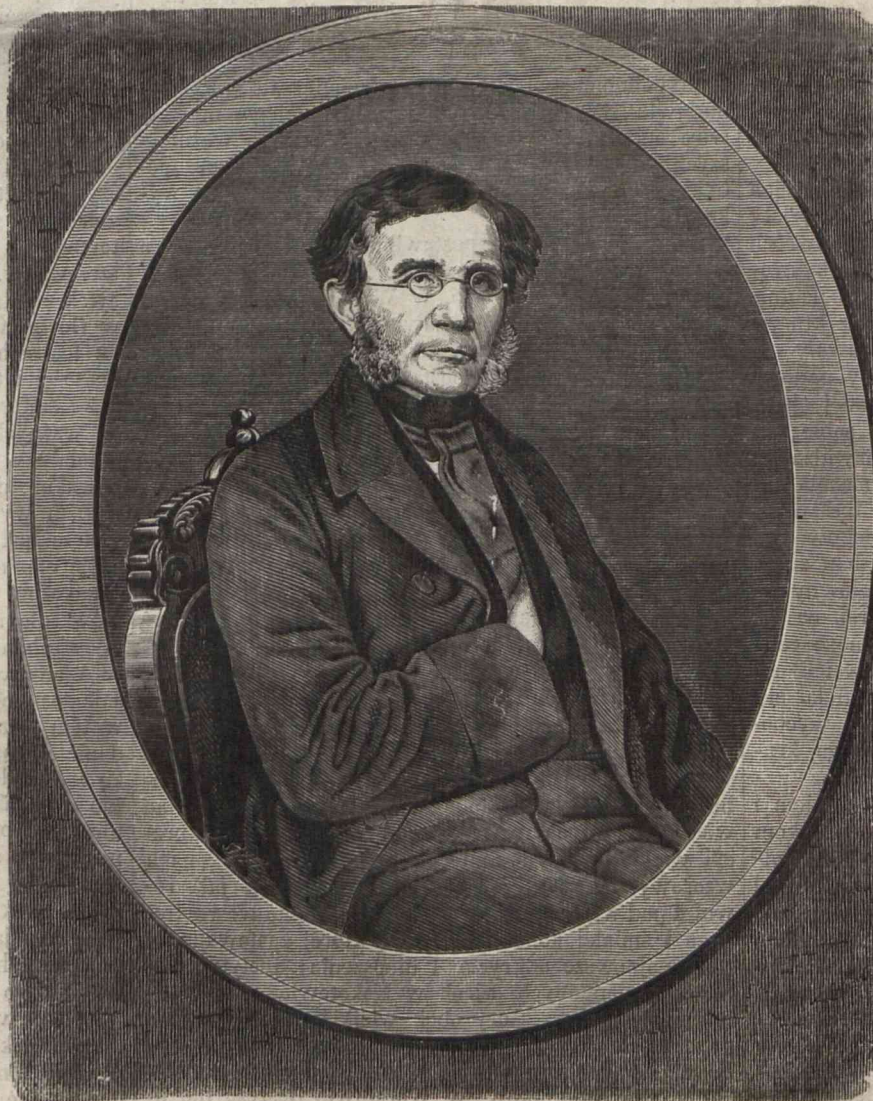
HENRYK MARCONI.