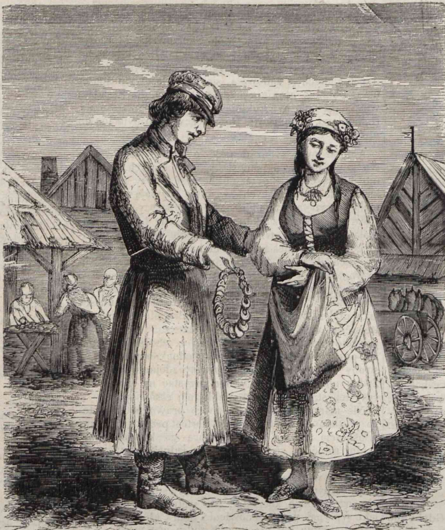
Młodzieniec podaje swą wybraną obwarzanki. (Rys. z nadesłanego szkicu Kostrz.).

Obrzędy weselne wszelkich ludów, zostających jeszcze w dzieciństwie, są prawdziwie narodowym dyalogiem. Wszystkie bowiem obrzędy ludowe za nic innego poczytywać nie należy, jak za rodzaj symbolicznego dramatu. Nie wyda się to twierdzenie paradoksalnym, gdy bacznie okiem zajrzymy w odległą przeszłość. Czyliż bowiem w kształtowaniu się ludowych pojęć, na pierwszym miejscu nie dostrzegamy owych dyalogów zwanych mysteriami, które nie wychodzą zrazu poza obręb kościoła, przeszły następnie na deski przelodnych teatrów, by podnieść się wkrótce do godności sztuki i poezji? Lubo wielką znajdujemy różnicę pomiędzy najprostszymi nawet pod względem układu takowemi mysteriami i najzawilszemi weselnymi obrzędami, zawsze jednak niepodobna