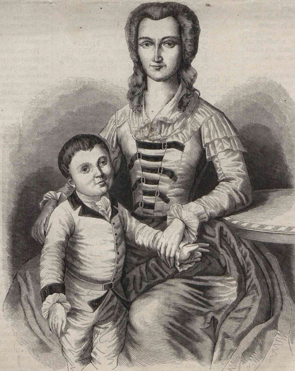
TEKLA Z BIELIŃSKICH ŁUBIŃSKA. (Rysował ze sztychu Polkowski).

Tekla Łubińska urodziła się w Warszawie w r. 1767, w trzy lata po wstąpieniu na tron króla Poniatowskiego, a na rok przed zawiązaniem