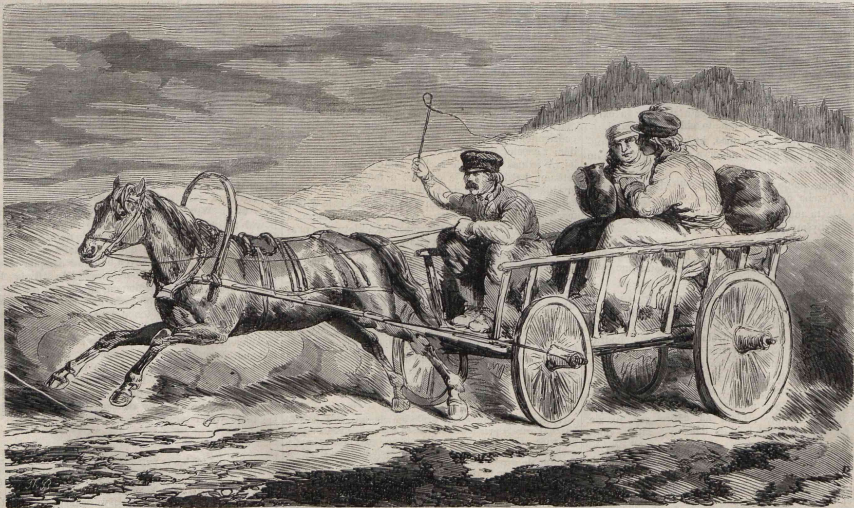
PAŃSTWO MŁODZI JADĄ DO DOMU. (Rysował z nadesłanego szkicu Pillati).

nośnych teatrów, by podnieść się wkrótce do godności sztuki i poezji? Lubo wielką znajdujemy różnicę pomiędzy najprostszymi nawet pod względem układu takowemi mysteriami i najzawilszemi weselnymi obrzędami, zawsze jednak niepodobna