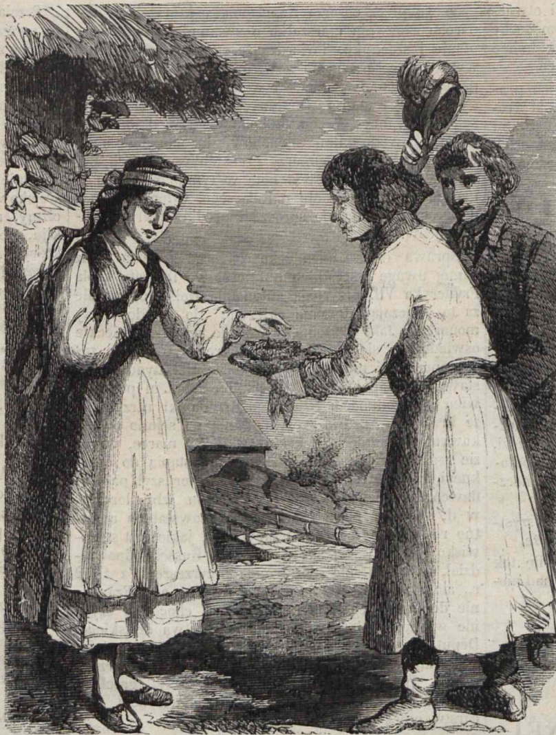
PODANIE WIANKA ŚLUBNEGO. (Rysował z nadesłanego szkicu Kostrzewski).

Najprzód był on żołnierzem, a stanowisko właściwe żołnierzowi austriackiemu, wpłynęło przeważnie na dzisiejsze jego usposobienie. Wysłano go do Włoch; potem był w Wiedniu podczas tamecznych wypad-