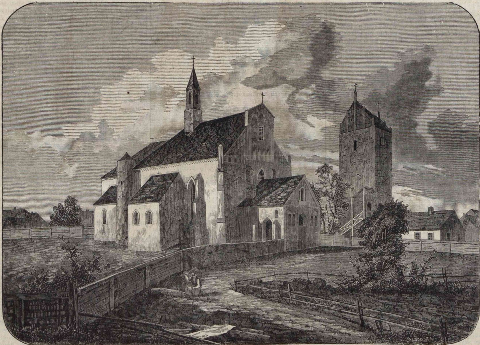
KOŚCIÓŁ FARNY W PRZASNYSZU.

Dzięki bezstronnej, historycznej krytyce, możemy w obecnym czasie zredukować główny zarys życia naszych słowiańskich apostołów do wniosków takich, które się najzupełniej zgadzają z dawnymi o nich po-