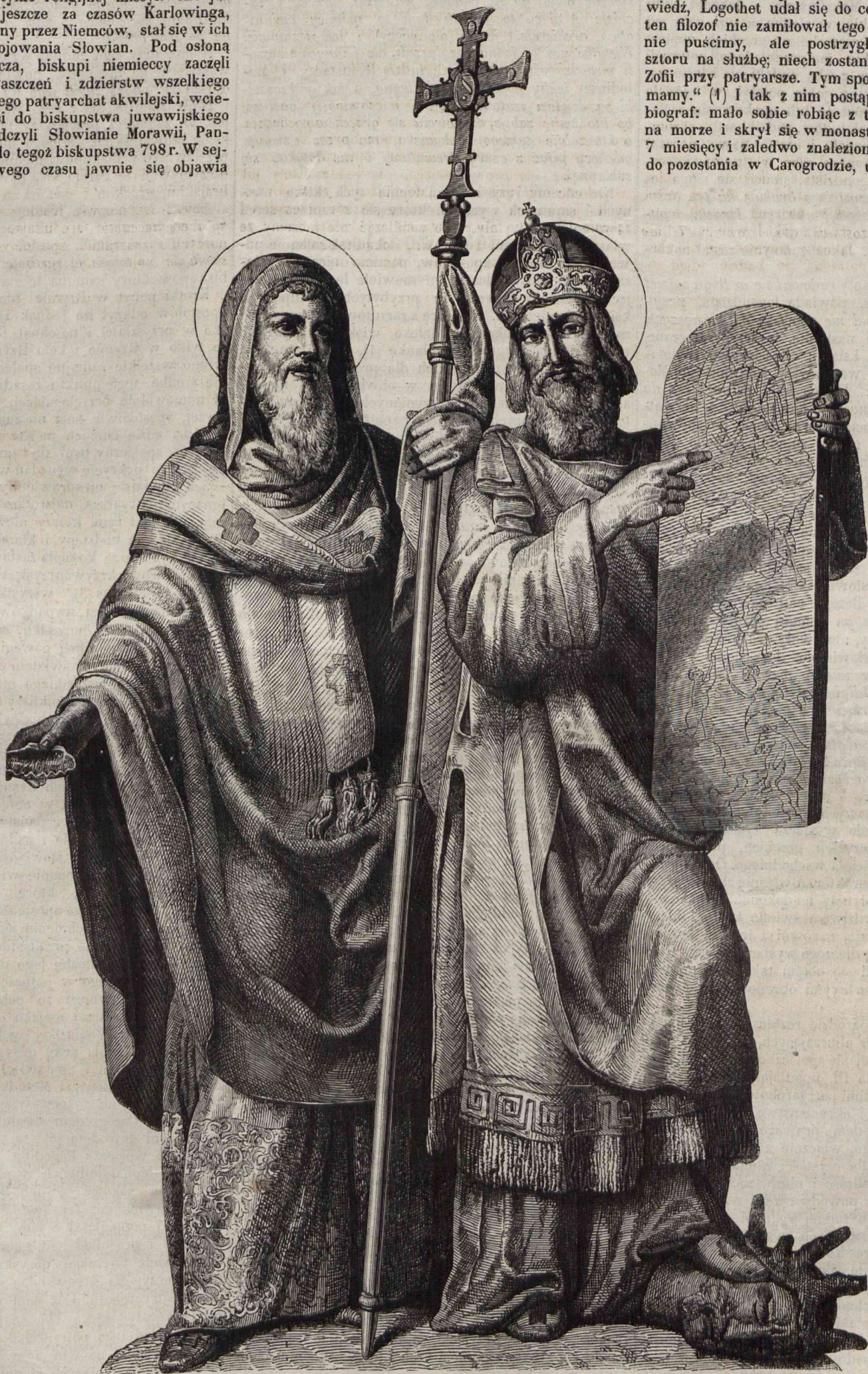
ŚW. CYRYLI I METODIUSZ, apostołowie słowiańscy. (Rysował ze sztychu Tegazo).

Snadź na zepsutym i wyuzdanym w szaleństwie dworze bizantyckim (3), gdzie monarcha śmiał się publicznie z tego, że nie jednego ale trzech posiada patriarchów, nazywając Teofila swoim (4), Focysza patriarchą wuja swego Bardasa, a Ignacego patriarchą chrześcian (5), na takim dworze powiadamy, nie mógł być cierpianym świętobliwy, cichy, ale prawdomówny Konstanty. Starano się go też przy pierwszjej nadarzoncj zrzecności zbyć z oczu, do czego się łatwo nadarzała sposobność, przy tak obszernych stosunkach, jakie Carogrod prowadził z oddalonym wschodem. Jakoż posyłano go niejednokrotnie to do Saracenów, dla przedysputowania ich o jednobóstwie Trójcy świętej, to do Kozarów, których nawrócił, a sam nau-