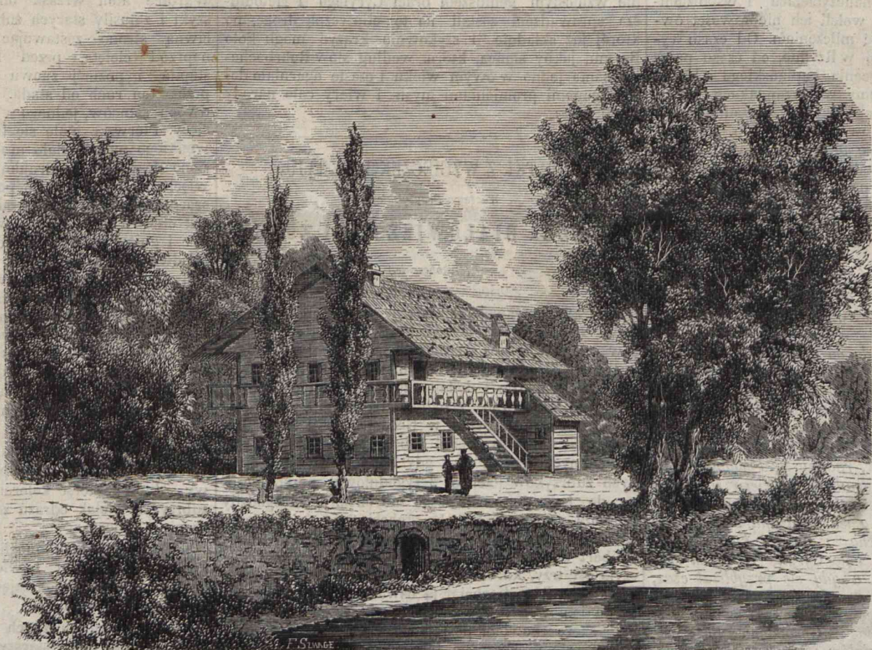
ZANIEMYŚL w w. ks. poznańskim. (Ob. artykuł w N. 178 Tygodnika).

Środki przezeń podane są następujące: Założenie w puszczy, gdziekolwiek nad rzeką Białą, obszernej zagrody, w której umieścić 10 żubrów dorosłych i 2 żubrów. Zagroda winna być murowana, na 12 stóp wysoka (przez wzgląd na siłę żubrów, pożary częste w puszczy, oraz na najścia drapieżników, jak wilki, niedźwiedzie i t. p.); przy wewnętrznej ścianie zagrody można urządzić niewielkie stodoły do składania siana podczas zimy i domki dla strażników dozoruujących. Pierwszym krokiem ku przyswojeniu będzie stałe wydawanie pokarmu o pewnej oznaczonej godzinie; następnie, gdy się żubry oswoją z tą opieką i zrozumieją jej potrzebę, można będzie powoli odgradzać po kawałku część zagrody i w ten sposób ścisnąć żubrów w ich pomiesz-