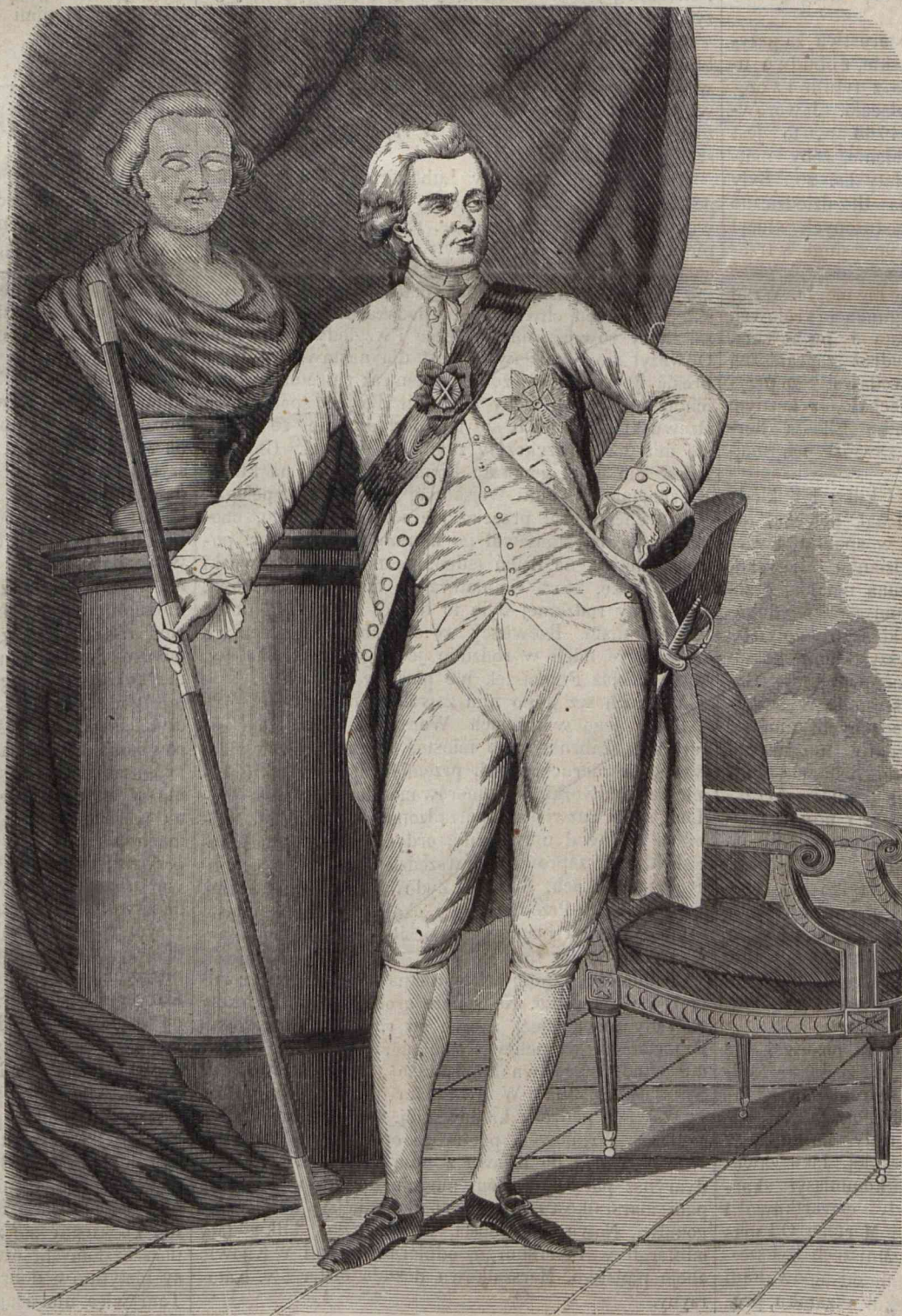
MICHAŁ MNISZECH, marszałek w. koronny.

Na tym gruncie budować zaczął wnuk jego Michał, któremu los także przeznaczył łaskę w. koronną. Michał nadto miał szczególne szczęście. Matka, kobieta rzadkiego dowcipu i nauki, jak na owe czasy, była blisko tronu, bo została w pokrewieństwie ze Stanisławem Augustem. Syn jej ożenił się z rodzoną sio-