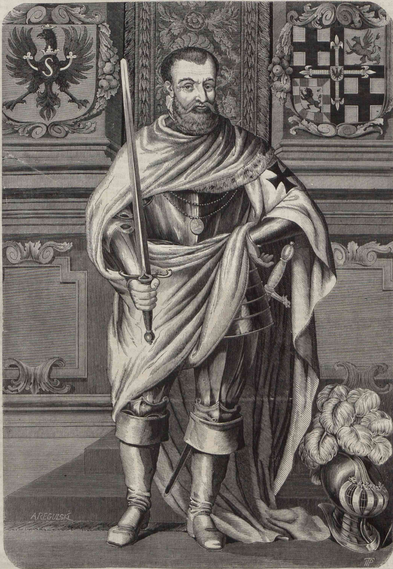
ALBRECHT KSIĄŻĘ PRUSKI. (Podług sztychu znajdującego się w dziele Hartknocha „Alt-und Neues Preussen“)

1513, wzywając do Poznania na dzień 12 kwietnia, dla wykonania holdu i grożąc zarazem wojną w razie przeciwnym. Margraf Kaźmirz czynił starania, aby spowodować pojednanie; Albrecht jednak, lubo siostrzeniec królewski, lecz jako Niemiec mając większą skłonność do rzeszy niemieckiej niżeli do Polaków, myślał raczej tylko o wydobyciu zakonu z pod wszelkiej zależności. Obsyłał więc do cesarza i książąt niemieckich po radę i posiłki, królowi zaś kazał oświadczyć, że brat jego