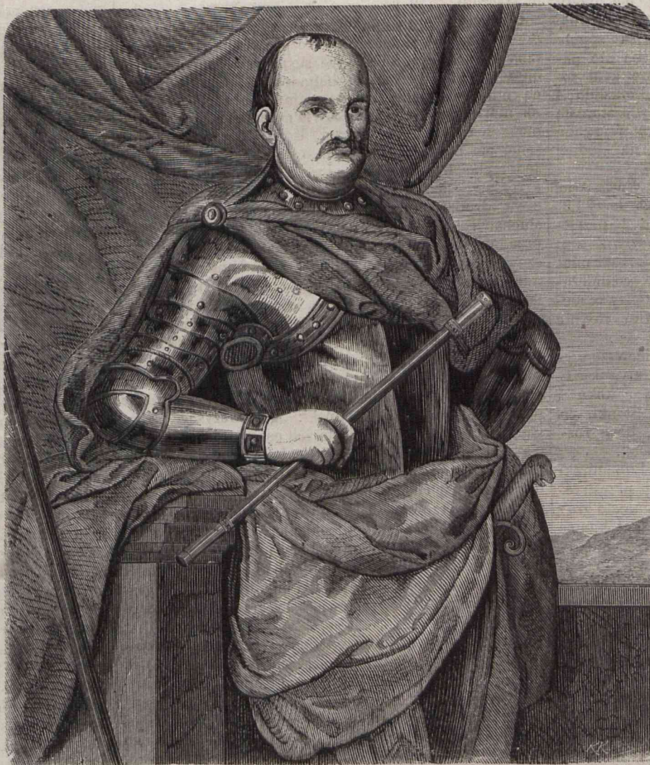
JERZY SEBASTYAN LUBOMIRSKI.

I to marszałkostwo sejmowe i starostwo winien był Lubomirski swojemu nazwisku i pańskim stosunkom. Ojciec uporczywie upominał się za synami. Starszego Aleksandra wyprowadził na koniuszego kor. i oddał mu starostwo naprzód zatorskie, potem sandomierskie. Teraz drugiego z kolei, Jerzego, posuwał. Marszałkostwo sejmowe miało mu być tylko wstępem do zasług w rzpltej. Ojciec go uposażył w starostwo sądeckie, które już było tak samo dziedziczne w domu Lubomirskich, jak i sandomierskie, to jest