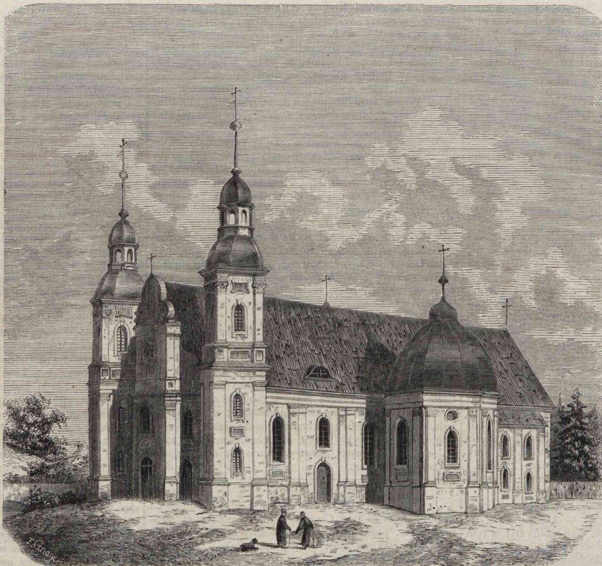
KOŚCIÓŁ PARAFIALNY W LUBASZU.