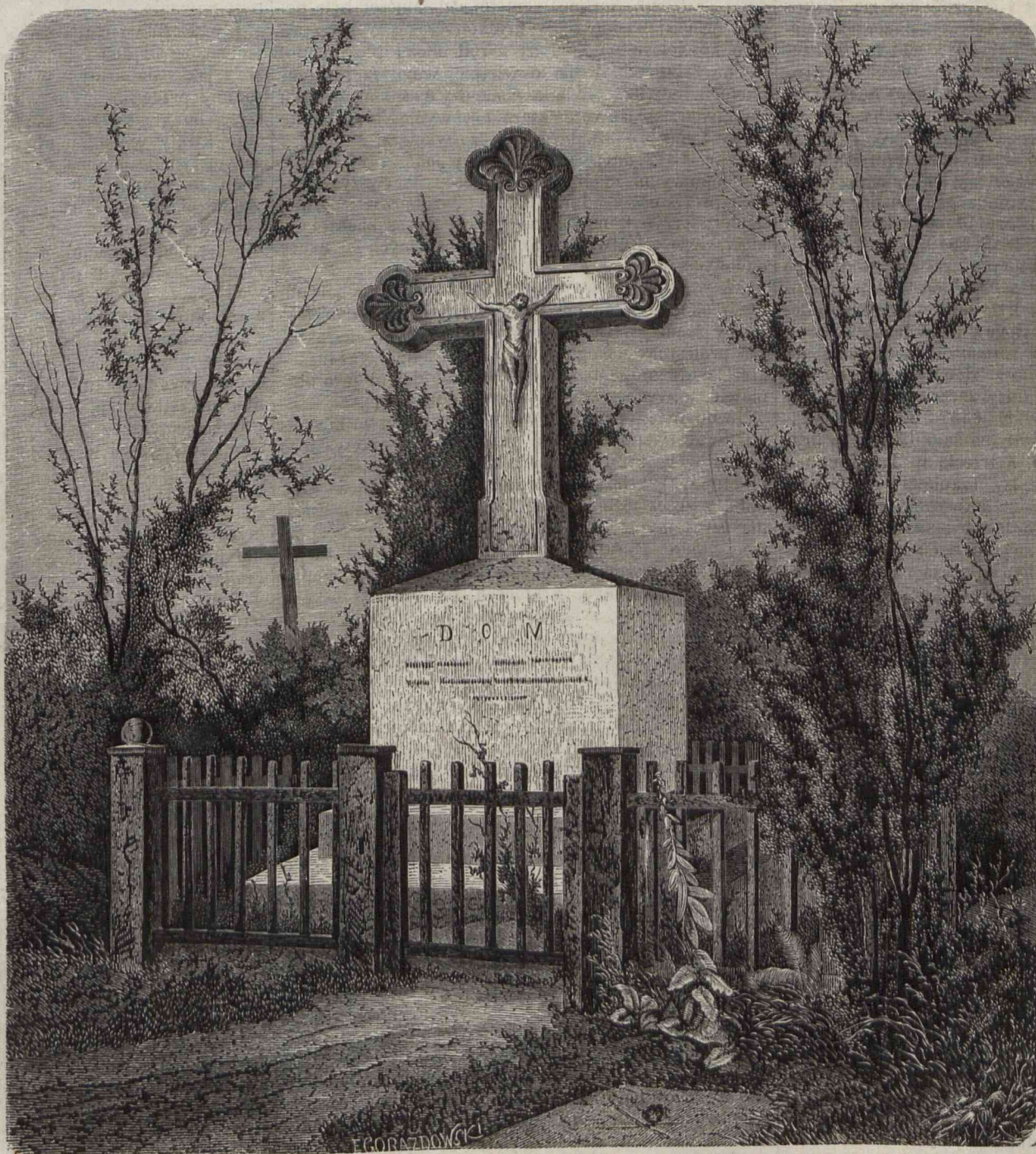
POMNIK TADEUSZA JUZUMOWICZA.

Na prowincyi i w cesarstwie: rocznie . . . rsr. 12 półrocznie . . . „ 6 kwartalnie . . . „ 3 z nadmienieniem, że prenumeratoremie z cesarstwa, otrzymujący tylko sam Tygodnik, płacą kopertowe od każdego egzemplarza rsr. 2 rocznie. Jeśli Tygodnik ma być wysyłany w kopercie innego pisma, to redakcyja uprasza o wyraźne wymienienie tego pisma przy nadsyłaniu pieniędzy.