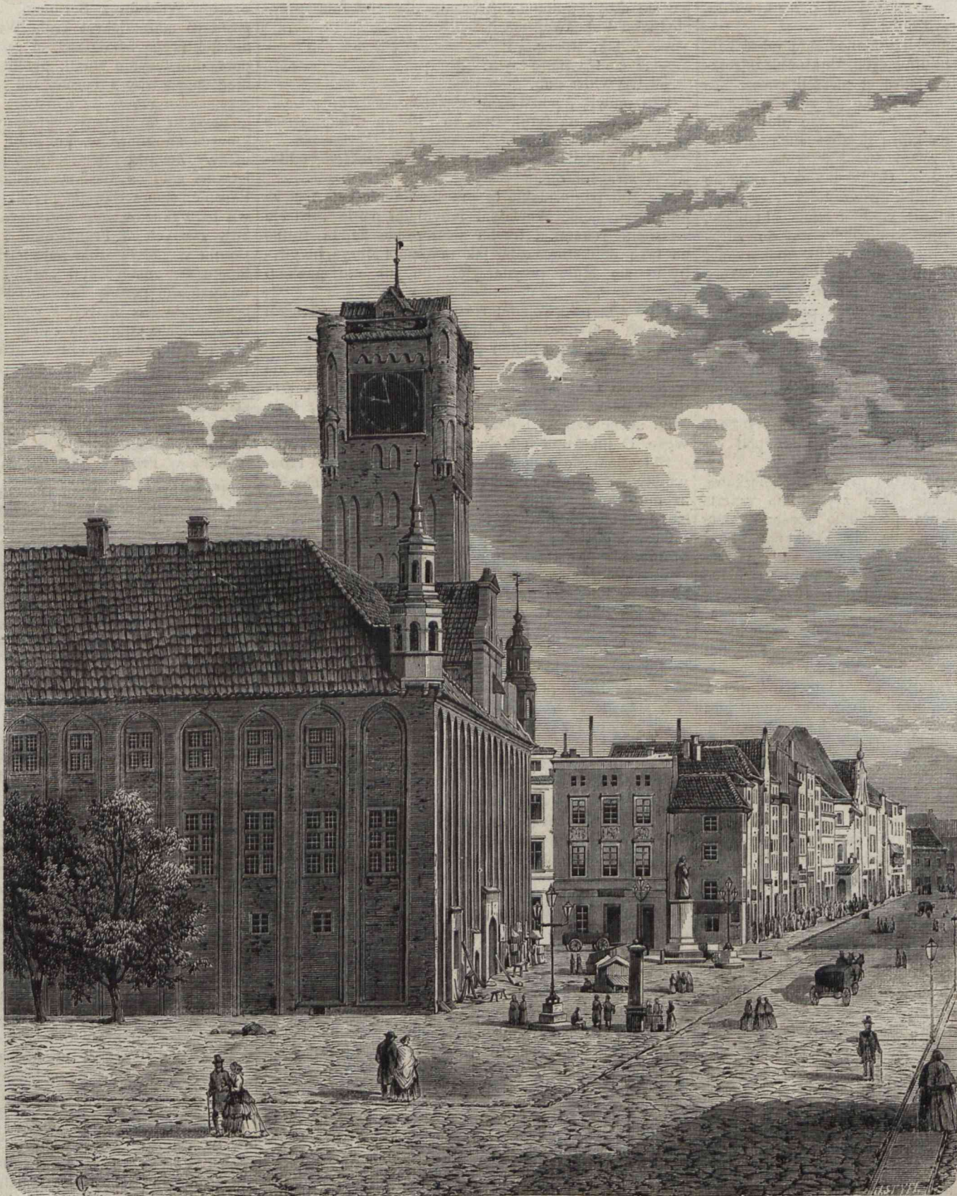
RATUSZ W TORUNIU.

Ogólny widok Torunia ma w sobie coś rozrzucającego prawie. Niezarty typ dawności i powagi przemawia tu tak silnie z wąskich uliczek, z wysokich o dziwnych szczytach domów, pełnych od frontu posągów, rzeźb, malowań, że przybysz oderwany od