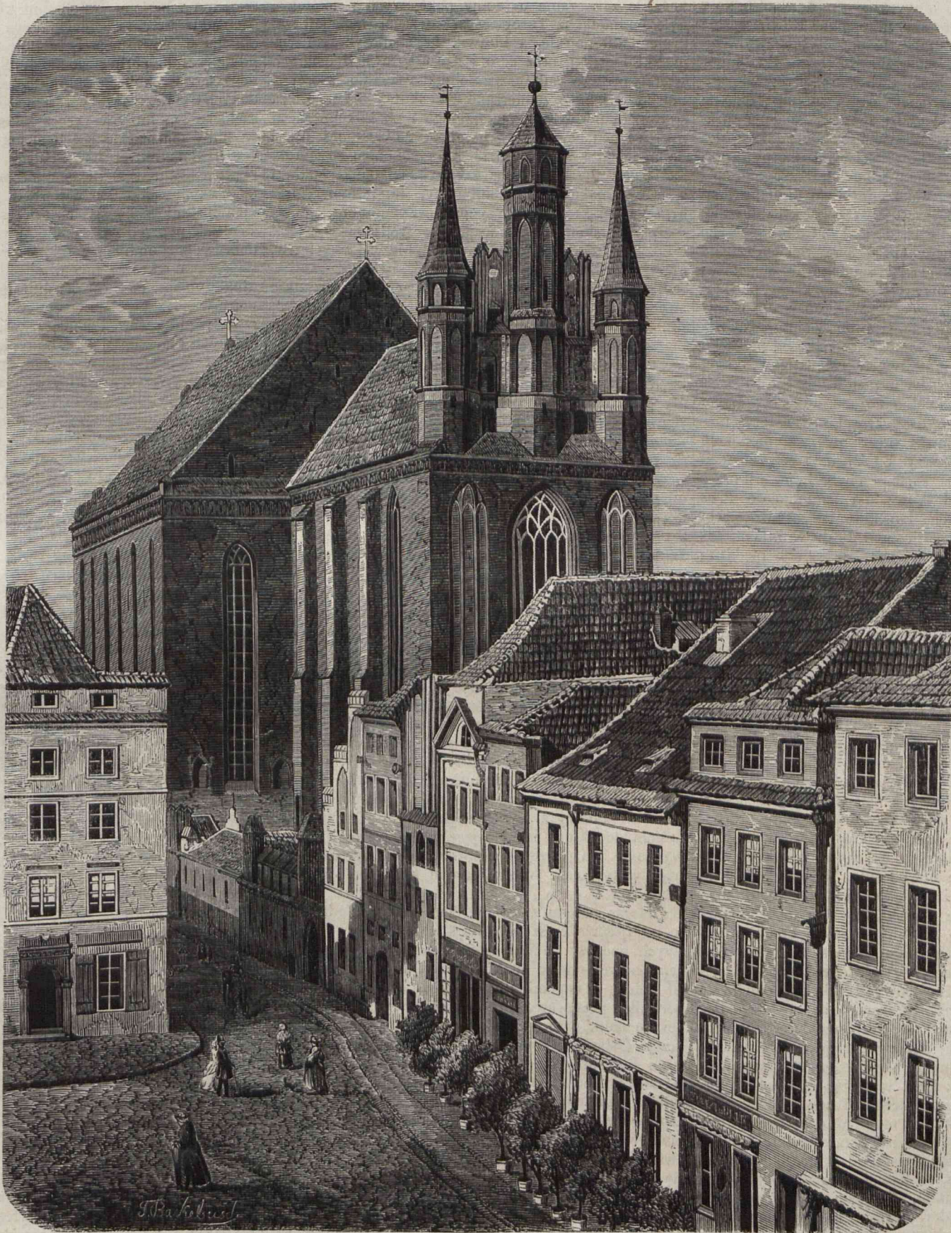
KOŚCIÓŁ PANNY MARYI W TORUNIU.

Obok tego wojna przykrzyła się już nie tylko miastom, ale i rycerstwu świeckiemu kraju zakonnego. Zgromadzone stany w Królewcu prosiły mistrza, aby pozwolił im wysłać poselstwo do króla, a mistrz, lubo słuchał tych wniosków z wielką niechęcią, nie był jednak w stanie im się oprzeć i tylko ze swęj strony dał stróża tym posłańcom. Tymczasem zamek Brandeburg, postrzelany działowemi kulami kamiennymi, poddał się wojsku polskiemu, a następnie w drugi dzień świątek Mikołaj Firlej z Dąbrowicy, hetman i wojewoda sandomierski, dowódca naczelny Polaków, zbliżył się do wojskiem pod mury samego Królewca i wezwał miasto do poddania się, oferując mu równą wolność i przywileje, jakich Gdańsk i inne miasta używały. Zwlekali Królewczanie ze sta-