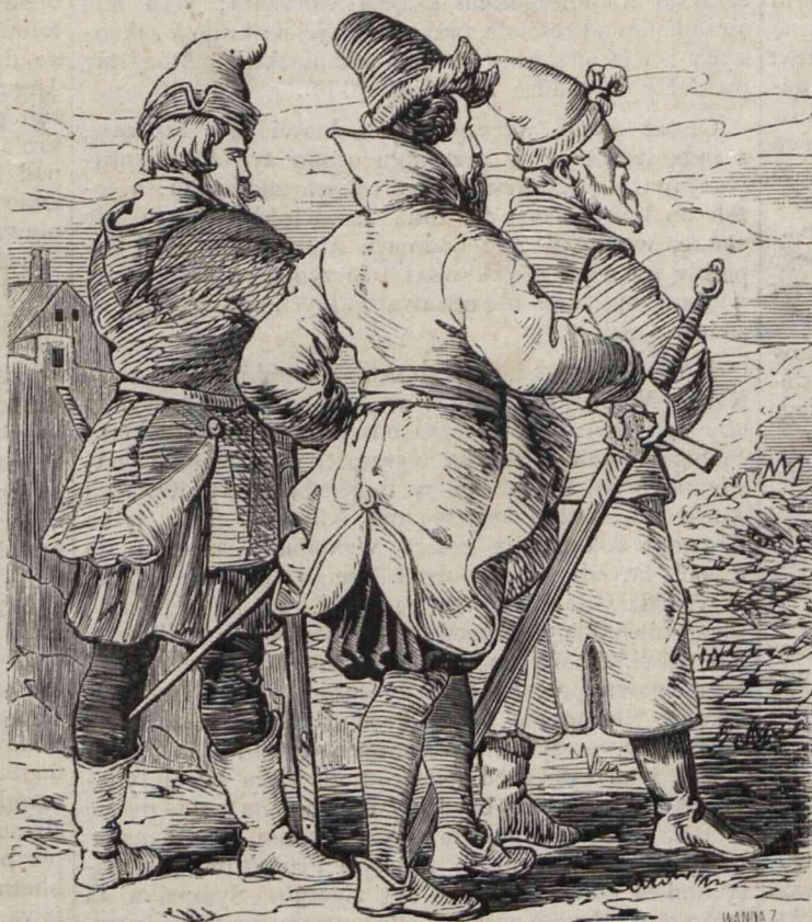
Nr. 62.—Wiek XVI. Ziemianie w ubiorach zwyczajnych. Czapki wysokie futrem wyłożone; u żupanów długich podpinanych wysokie kołnierze stojące lub wyłożone, albo kaptur; na nogach buty lub z cudzoziemską trzewiki; w ręku wysokie miecze teutońskie, oprócz zwyczajnych przy boku. (Rysunek wzięty ze współczesnych drzeworytów w Zwierciadle Reja).

panu przez pychę chudopacholską, a liczył także na względy królewskie. Ostro wymówił, że skarb rzpltej i ekonomia królewska wielką ma od marszałka ujmę i krzywdę. Lubomirskiego to wystąpienie wcale niespodziewane zdziwiło, oburzyło. Jakto? panowie z panów, Leszczyński, Opaliński, nie śmieli głosu przeciw niemu podnieść, a gardłował jakiś tam Żydkiwicz? I tu na jaw wyszła owa sławiona równość szlachecka w Polsce; pokazało się co znać, bo wytrysnęła gniewem z głowy Lubomirskiego. Tutaj znowu dwie mamy relacje. Podług jednej, marszałek srodze rozgniewany rzekł: