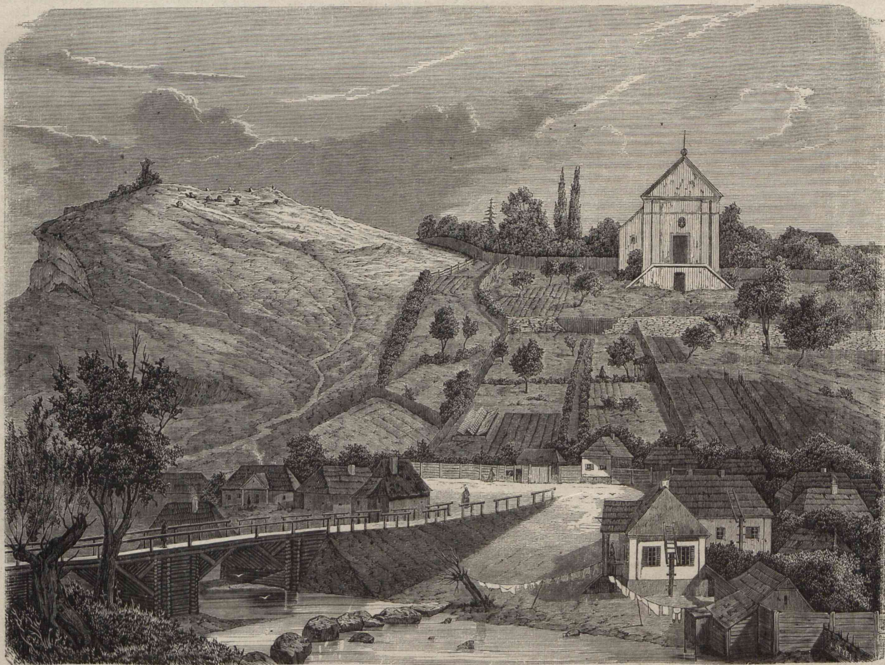
GÓRA OCHRYMOWA W ŻYTOMIÉRZU. (Podług rysunku pani P.)

TREŚĆ NUMERU. — Góra Ochrymowa w Żytomierzu (z drzeworytem). — Kronika tygodniowa. — Pomywaczka, obrazek z końca XVIII wieku, (dalszy ciąg) (z drzeworytem). — Kościół św. Rafała i figura Zbawiciela na Śnipiszkach (z drzeworytem). — Szachy. — Rebus.