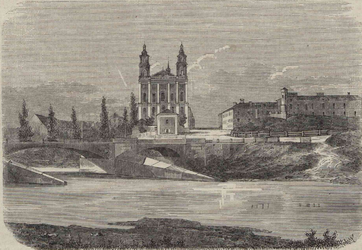
KOŚCIÓŁ ŚW. RAFAŁA W WILNIE.

lecono mi wygotować posąg świętego Jana Nepomucena, lecz zasły nieprzewidziane okoliczności, skutkiem których wyjechać musiałem na rok z Wilna do Grodna. Następnie wasz poprzednik kilkakrotnie mi przypominał, bym wykonał zamówioną statwę, lecz okropna klęska nawidziła nasze miasto, powietrze tysiące porywało ofiar, niepodobna było myśleć o robocie. I ja też chciałem z żoną i dziećmi uciekać z domu i miasta, gdy się mi ukazał Chrystus Pan, nie wiem i powiedzieć nie umiém, we śnie czy na jawie, i w te słowa do mnie przemówił: