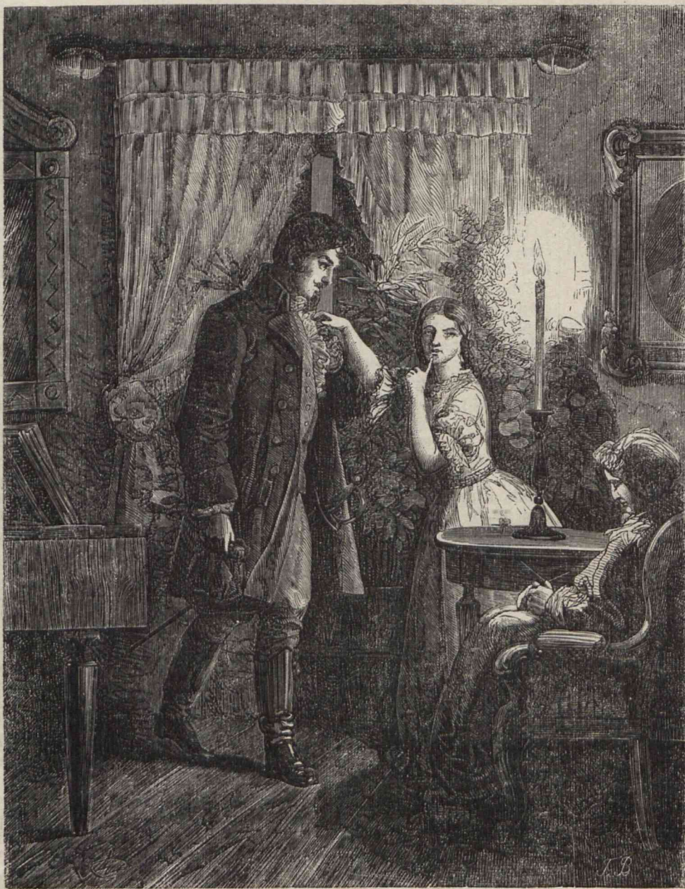
Zerwała się z krzeselka i na palcach pobiegła ku niemu, wskazując uspioną staruszkę.

Niewiedziąc jak do tego przyszło, ale wszyscy