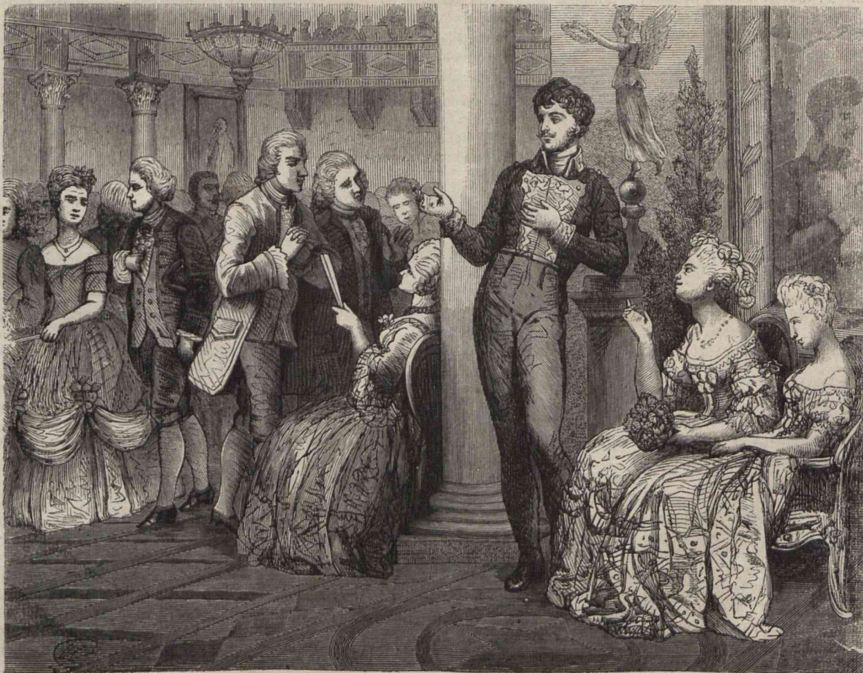
Szalony, rzekł książę, kłoby życie oddał za tę miłość... bo któraż z was kochać umie?