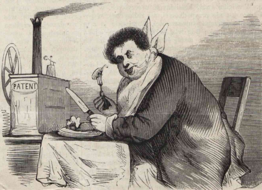
Nr. 4. Nowy aparat pospieszny do wyłęgania kurcząt pieczonych z sałatą i jajami.