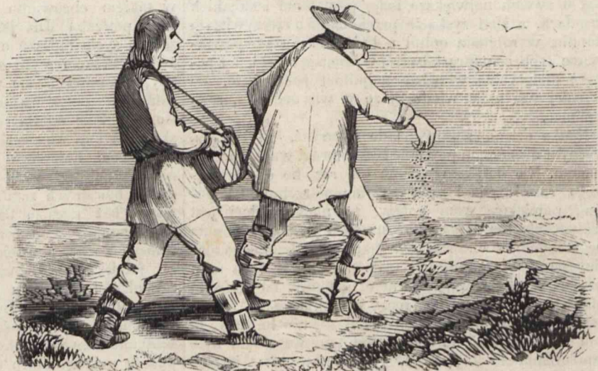
Nr. 2. Zamiast nawozu, używanym będzie proszek, którego szczypta na morg 300 przętowy będzie dostateczną do przemiany największych piasków, w najurodzajniejszy czarnoziem.