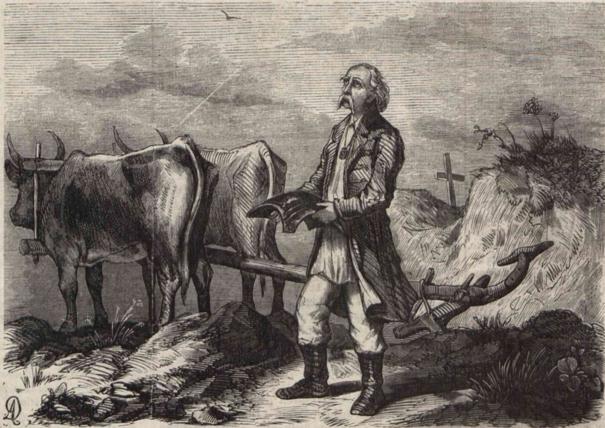
ORACZ. (Skomponował i rysował Kostrzewski, rytował Drażkiewicz w Warszawie).

Czerniaków bywa zwykle celem pierwszych u nas