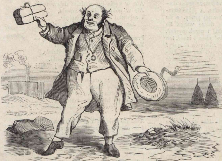
Nr. 1. Paczka która w sobie mieścić może do dwóch tysięcy kóp prasowanego siana.

Podług pomysłu i rysunku Leona Kunickiego.