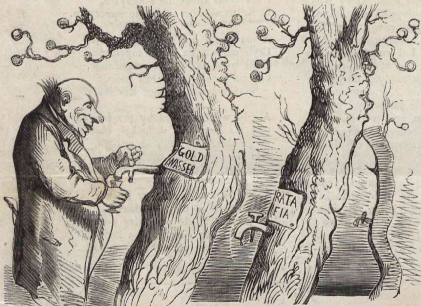
Nr. 3. Na gorzelnii już pędzić nie będzie potrzeba, bo kartofle szczepione są na drzewach, a każde drzewo kartoflane, skutkiem chemicznych przyrządów, wprost wydawać będzie Goldwasser, Ratafię i t. p.