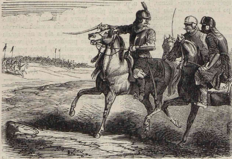
TANIEC Z TATARAMI.

W księżyc się czerni Dziki pohaniec.. Hej! hej! pancerni! Rozpocznem taniec. Lud w plen pognany, Goreją włosci, Przez Boskie rany Bić bez litości! Nie przejdzie żmija, Chyba po ciałach,