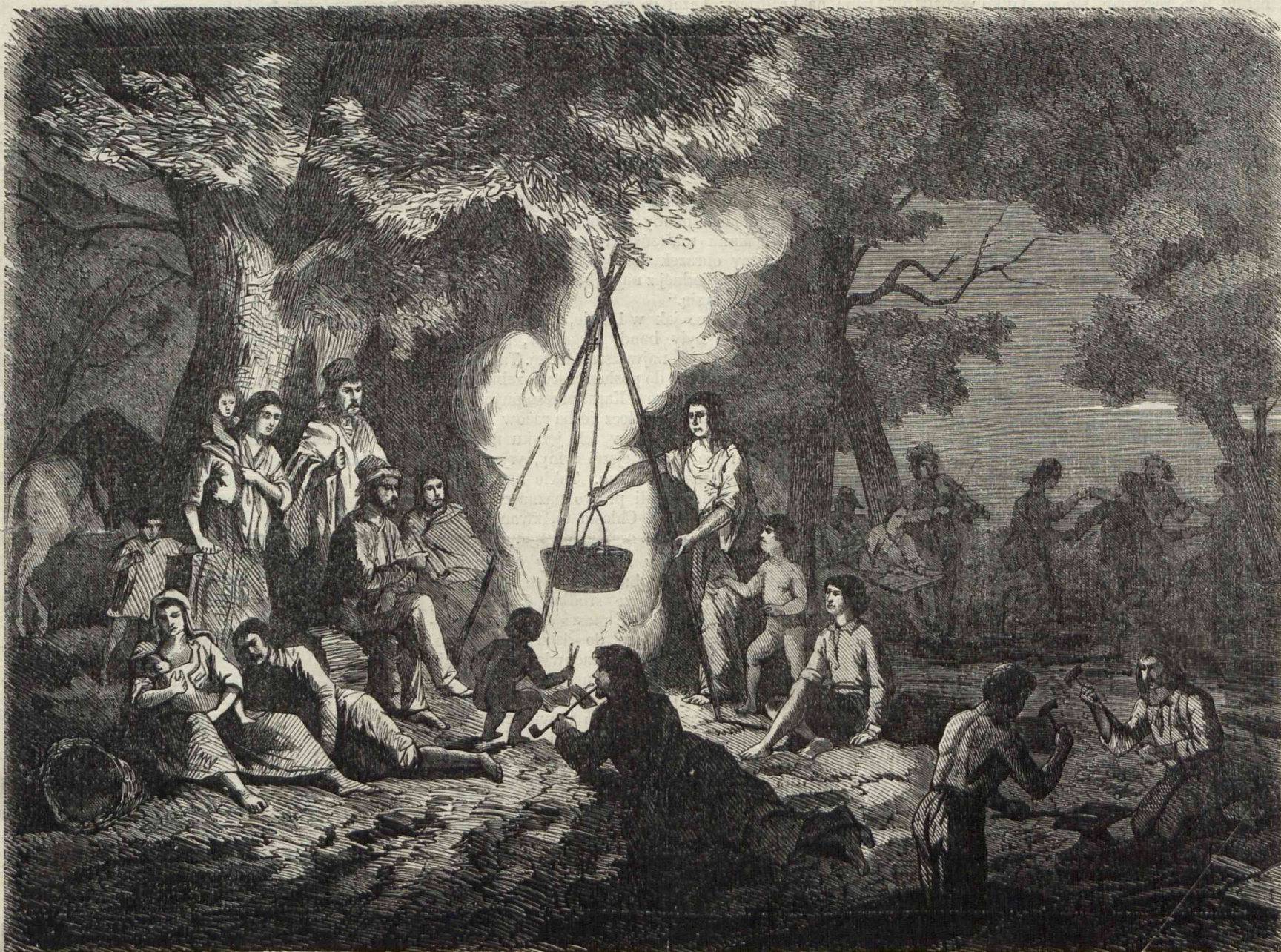
KOCZOWISKO CYGANÓW. (Podług szkicu J. Lewickiego, rysował Pillati.)

Dawne przysłowie, że „nędza ma nogi, a chleb rogi“, sprawdziło się na Znamierowskim. Wzbiwszy się w potęgę i dostatek, zaczął władzy swojej nadużywać, niesprawiedliwie sprawy rozsądzać, lud cygański uciskać. Wtedy około roku 1789 zebrane hordy cygańskie w jedno miejsce podniosły rokosz, władzcę swego uwięzili i sąd na niego ustanowiły. Z mocy wy-