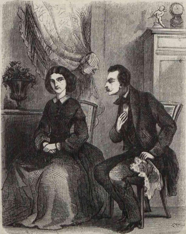
Po podaniu ręki, patrzyli sobie w oczy długo i rokosznie.