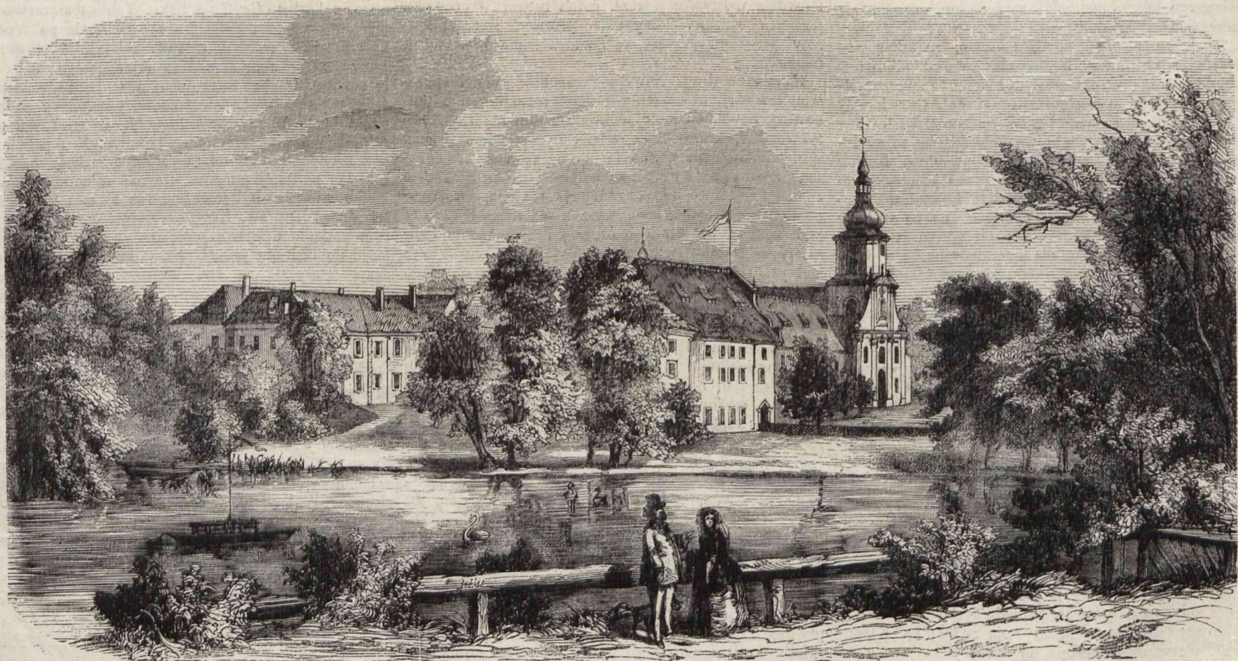
BYŁY KLASZTOR CYSTERSÓW W RUDNIE, W GÓRNYM SZŁĄSKU.

Tam ponad brzegiem rzeki Rudki leży były klasztor cysterski Rudno (Rauden), założony 24 października 1258 r. przez Władysława księcia opolskiego. Pod dłońmi pracowitemi osadzonych tu zakonników, okoliczna puszcza wkrótce się ożywiła, a kościół i kla-