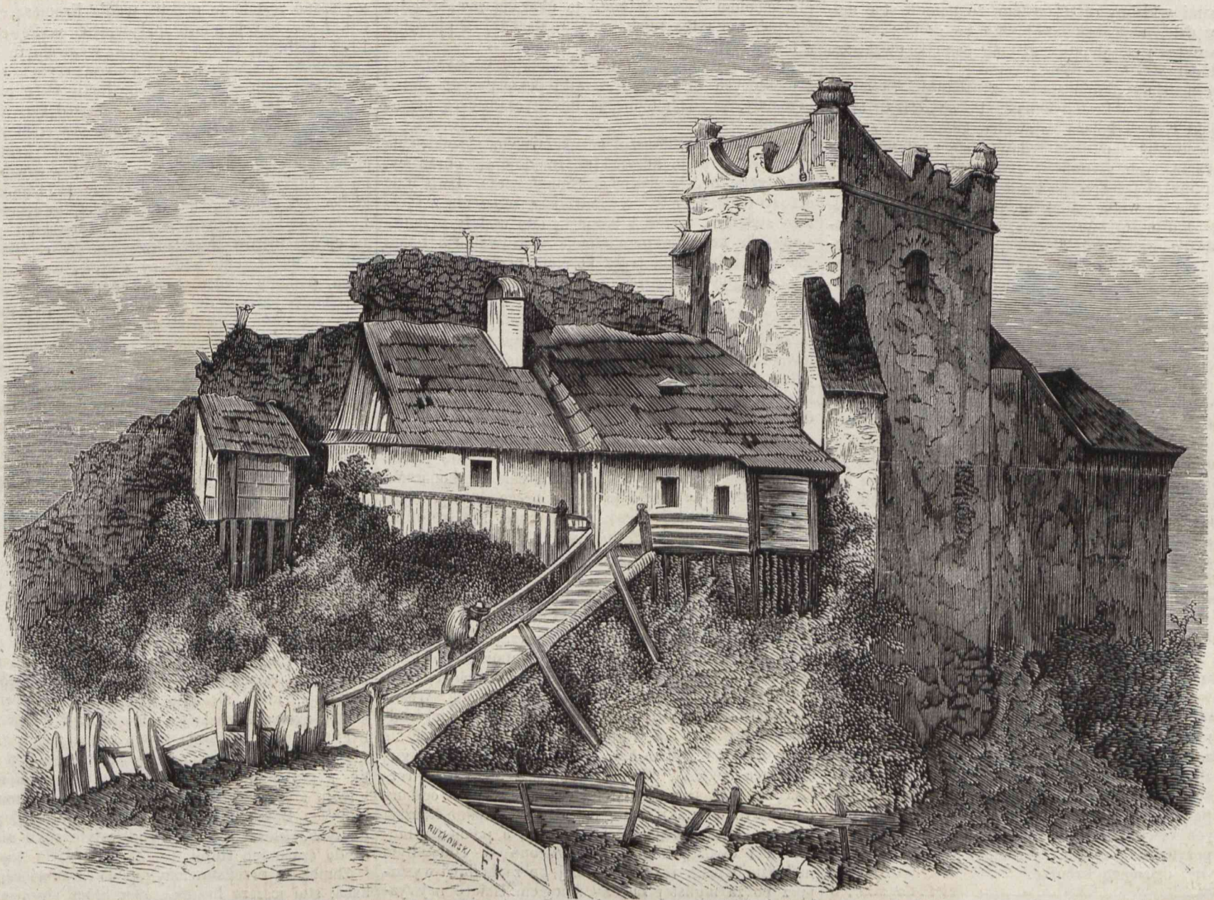
ZAMEK W NOWYM-SĄCZU OD STRONY POŁUDNIOWO-WSCHODNIEJ. (Rysował z fotografii Kostrzewski).

o którym to nasz Paprocki w życiu arcybiskupów gnieźnieńskich powiada swoim treściwym i naiwnym sposobem: