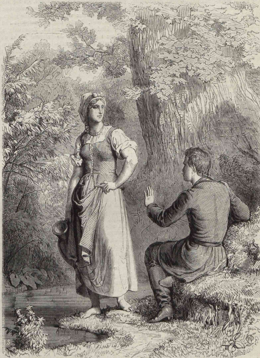
Podobna sarnie spłoszonej upadkiem suchej gałązki, zadrzała. (Pomysł i rysunek Gersona).

W pogodny dni zimowe, z utęsknieniem wyczeku-