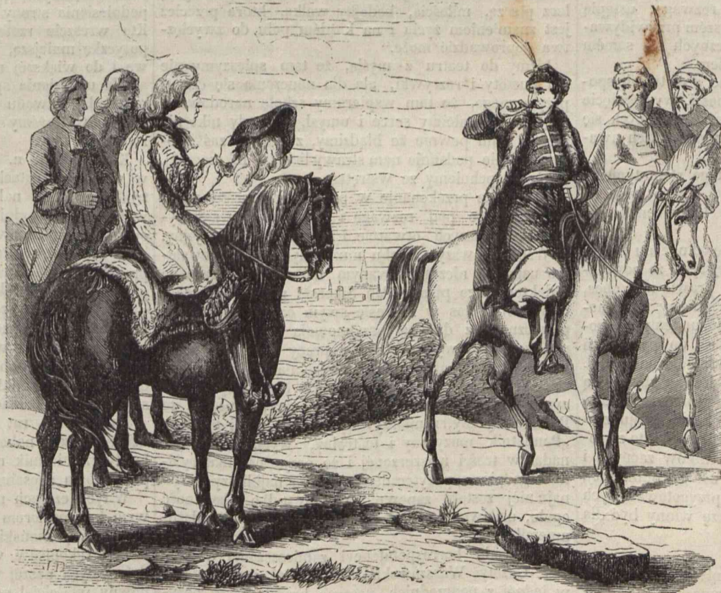
SPOTKANIE SIĘ KRÓLA JANA III Z CESARZEM LEOPOLDEM I.

„Pogadawszy tedy król z cesarzem trochę, wsiedli obydwaj na konie, i począł cesarz wojsko stojące w szyku objeżdżać, począwszy od królewskiego pułku; i jako zwyczaj jest, że przed monarchami zniżają chorągiew, tak i w pułku królewskim i hetmana wielkiego zniżali. Gdy zaś przyjechał cesarz na pułk hetmana polnego, żadnej chorągwi nie zniżono, co uważając cesarz, pyta się zaraz: „Co za racya, że górnějšíe pułki zniżają przedemną chorągiew, a w tym nie zniżają?“ Ktoś mu odpowiedział: „Ten hetman, co