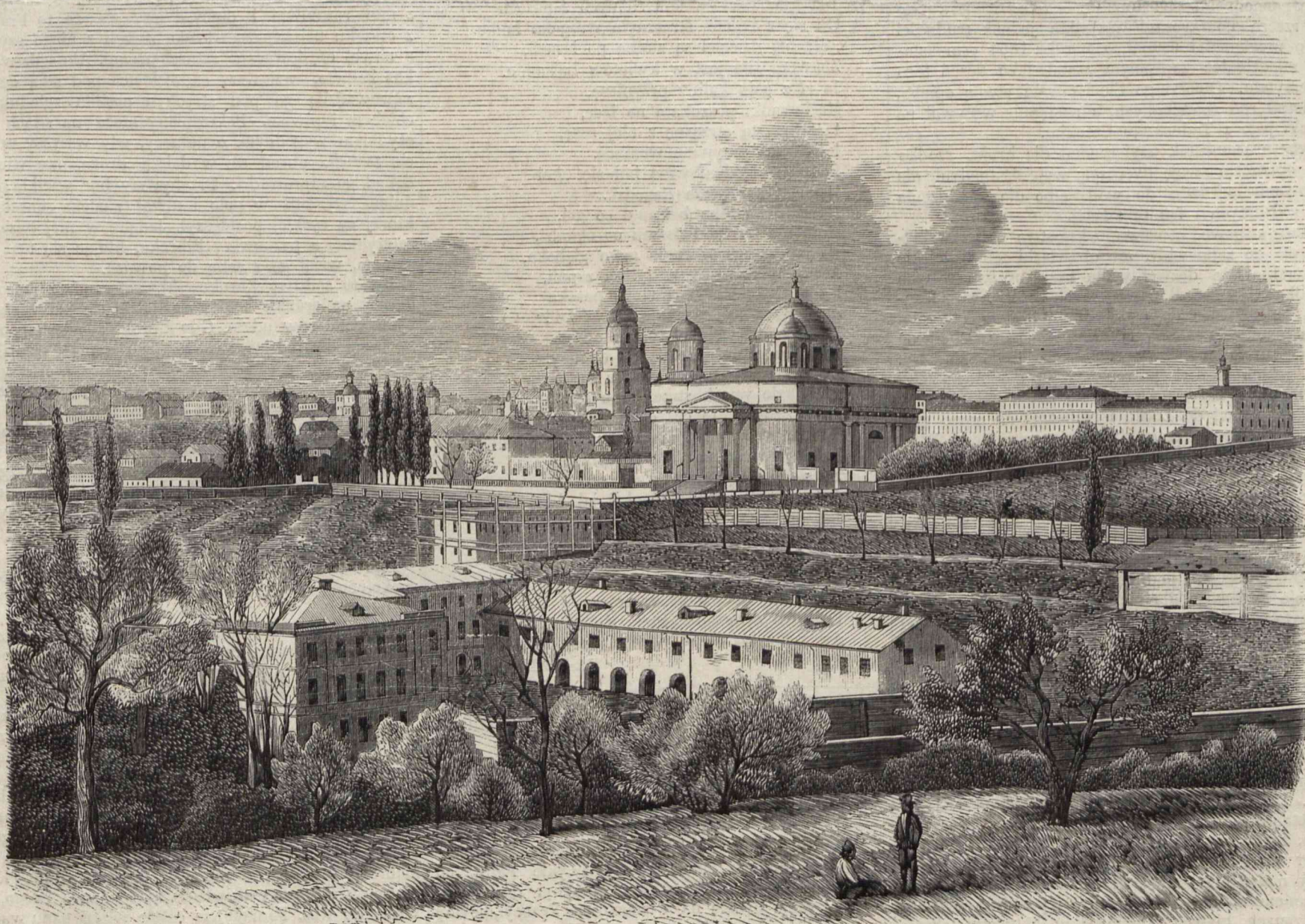
WIDOK OGÓLNY KIJOWA. (Rysował Cegliński, podług fotografii Korlęysza).

stolicę i granice jego zarysowały się inaczej: na wschód biegiem rzeki Dniepru, oprócz klinu na którym owe cztery wzmiankowane miasta stoją; na południe stepami Nowo-Rosyji, od północy i zachodu województwami braclawskim, podolskim i wołyńskim. Biorąc