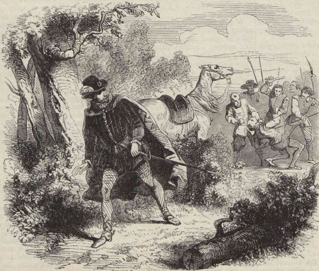
Zeskoczywszy z konia, uszedł w gąszcz pobliskiego lasu.