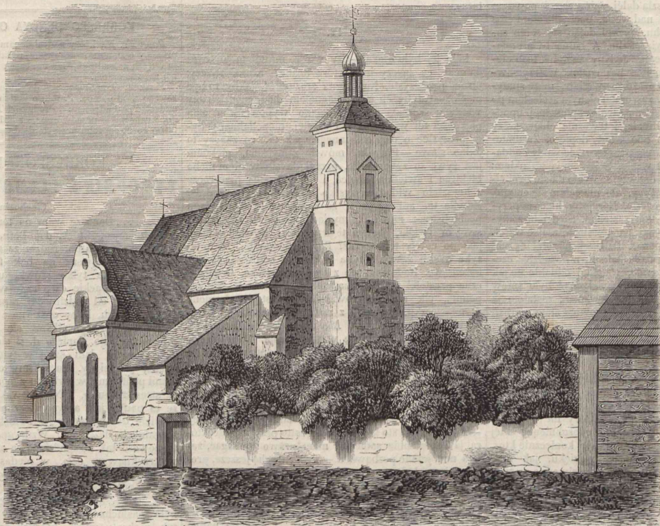
KOŚCIÓŁ PARAFIALNY W MAŁOGOSZCZY. (Rysował z natury Lewicki.)

Za dawnych czasów, kiedy w Małogoszczy stał jeszcze wielki murowany ratusz i obszerne piętrowe zabudowania na rynku, tudzież ozdobne a teraz zniszczone kamienice zwane mansyonarskie, wznosił się tutaj na placu targowym drugi kościół, pod wezwaniem św. Rozalii, który teraz już nie istnieje. Dotąd zaś pozostał na górze zwanj Babinek, na cmentarzu grzebalnym, mały kościółek, teraz bardzo zniszczony, w którym zaledwie raz do roku nabożeństwo się odprawia. Kościółek ten wystawił w r. 1595 ks. Chrostkowski, jednocześnie z odnowieniem, a raczej przebudowaniem parafialnego kościoła.