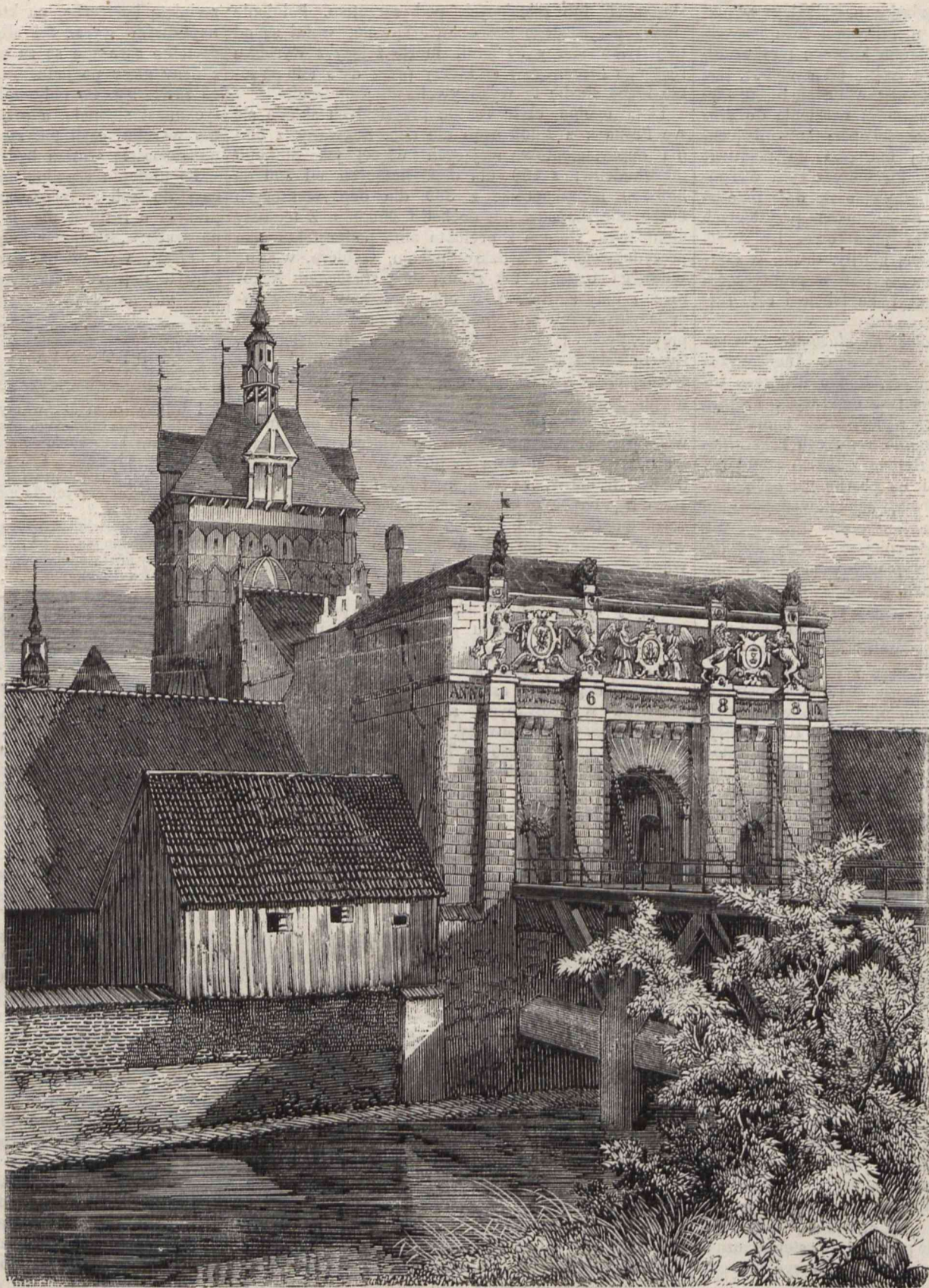
WYSOKA BRAMA W GDAŃSKU. (Rysował z litografii Lewicki).

Szkoda tylko iż te ostatnie, z powodu małego współdziałania kapitałów krajowych, przechodzą w ręce cudzoziemców, a tym samym tracą charakter swojski i przestają być źródłem pomieszczenia się i pracy dla mieszkańców ziemi którą eksploatują. Przedsięwzięcia te częstokroć przez swe korzystne położenie posiadają wielką doniosłość i zapewniłyby mogły tysiącom zdolnych rodaków utrzymanie, a kapitalistom krajowym dobrą lokacją funduszy. Pisząc to, mamy szczególnie na myśli kolej galicyjską, o której niedawno wspomniano w Tygodniku ze słuszną zgрозą, iż pomimo nacisku opinii, zarząd tego przedsięwzięcia tak ważnego nie spoczywa w rękach krajowców, ale pozostaje pod wyłącznym wpływem obcego nam żywiołu, który chciwie wykupuje dobrze się procentujące akcje tej drogi. A żywioł ten, eksploatujący na wszystkie strony Galicyą, wie co robi.... linia bowiem tamtejszej kolei, dotykająca się najgłówniejszych arterij biegnących na zachód i północ, ma świetną przed sobą przyszłość.