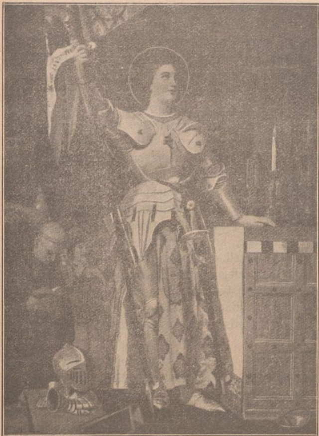
Bl. Joanna A'rc.