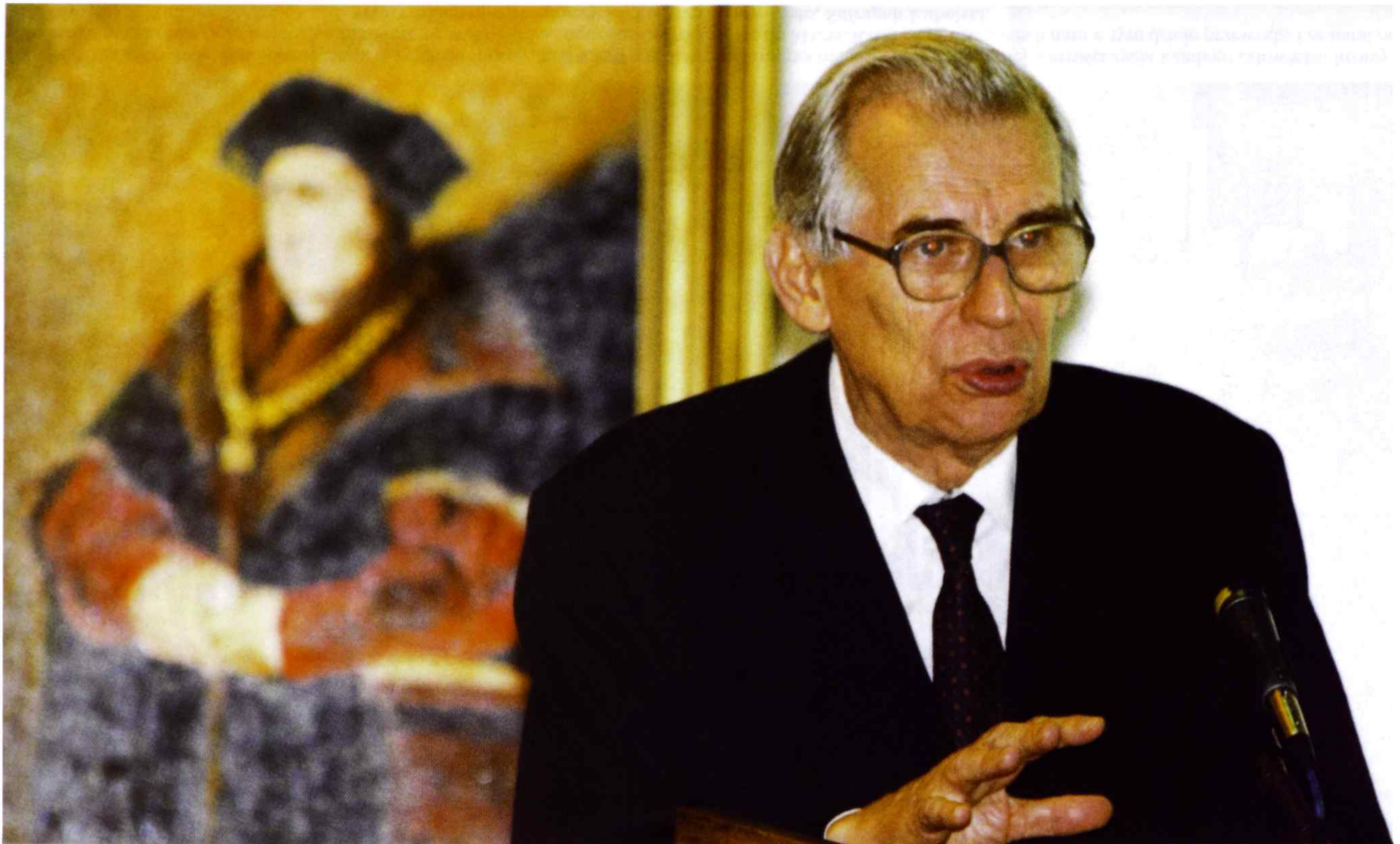
15. „Postulat odwagi w nauczaniu Prymasa występował zawsze w powiązaniu z postulatami rozwagi, roztropności. Prymas więc pobudzał w okresach «małej stabilizacji», a w okresach wielkich napięć, grożących wybuchem bez widoków na sukces, nie wahał się oddziaływać uspokajająco”. Prof. dr hab. Wiesław Chrzanowski, były Marszałek Sejmu RP, mówi o prymasie Stefanie Wyszyńskim jako mężu stanu.