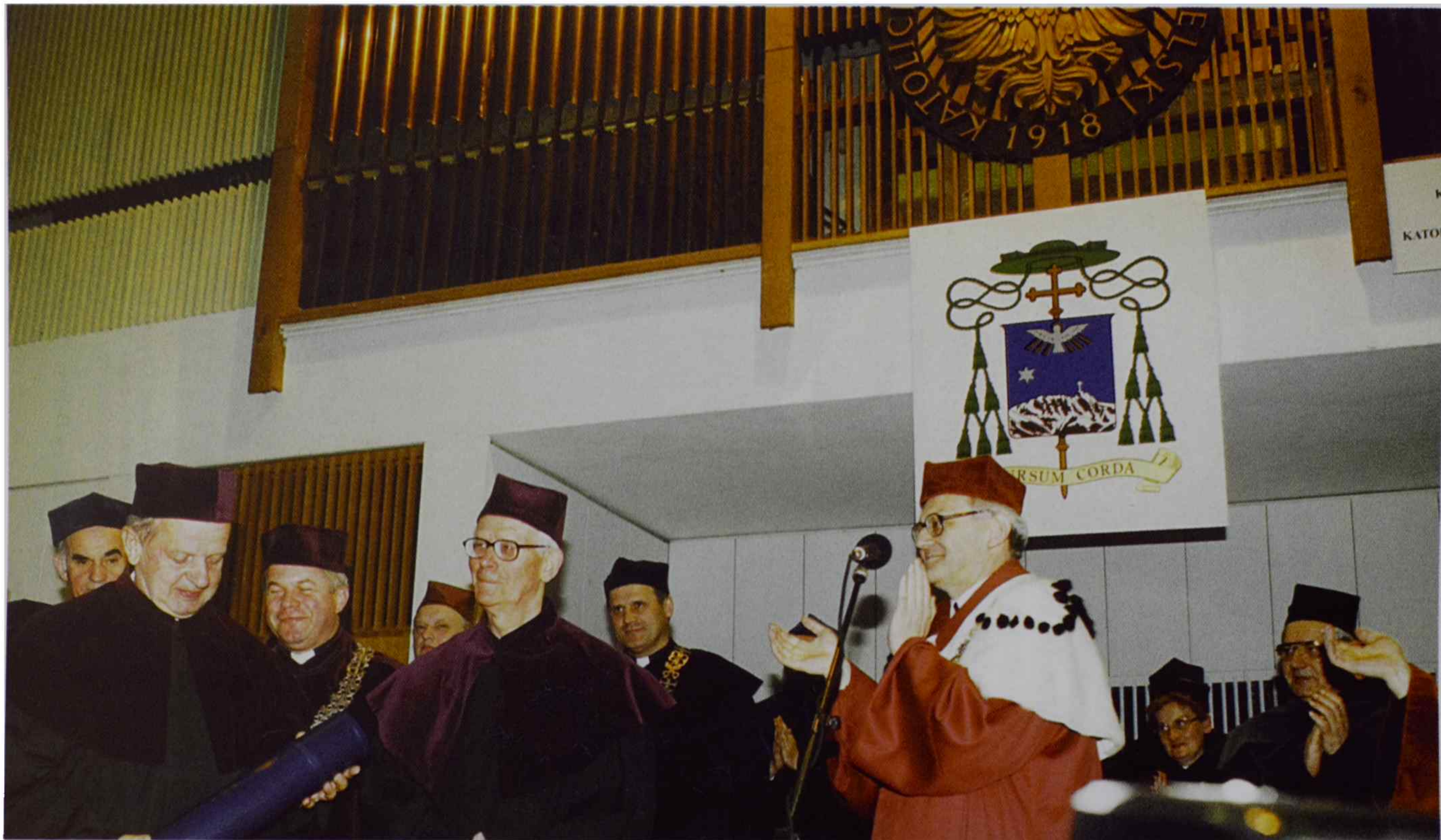
2. „Data 13 maja nie może być dla nas obojętna, zwłaszcza dla tego Uniwersytetu, który szczyli się tym, że wydał spośród swoich profesorów papieża Jana Pawła II. Ta ceremonia niech będzie zatem okazją do przeżycia na nowo tego wydarzenia, którego byliśmy świadkami”.