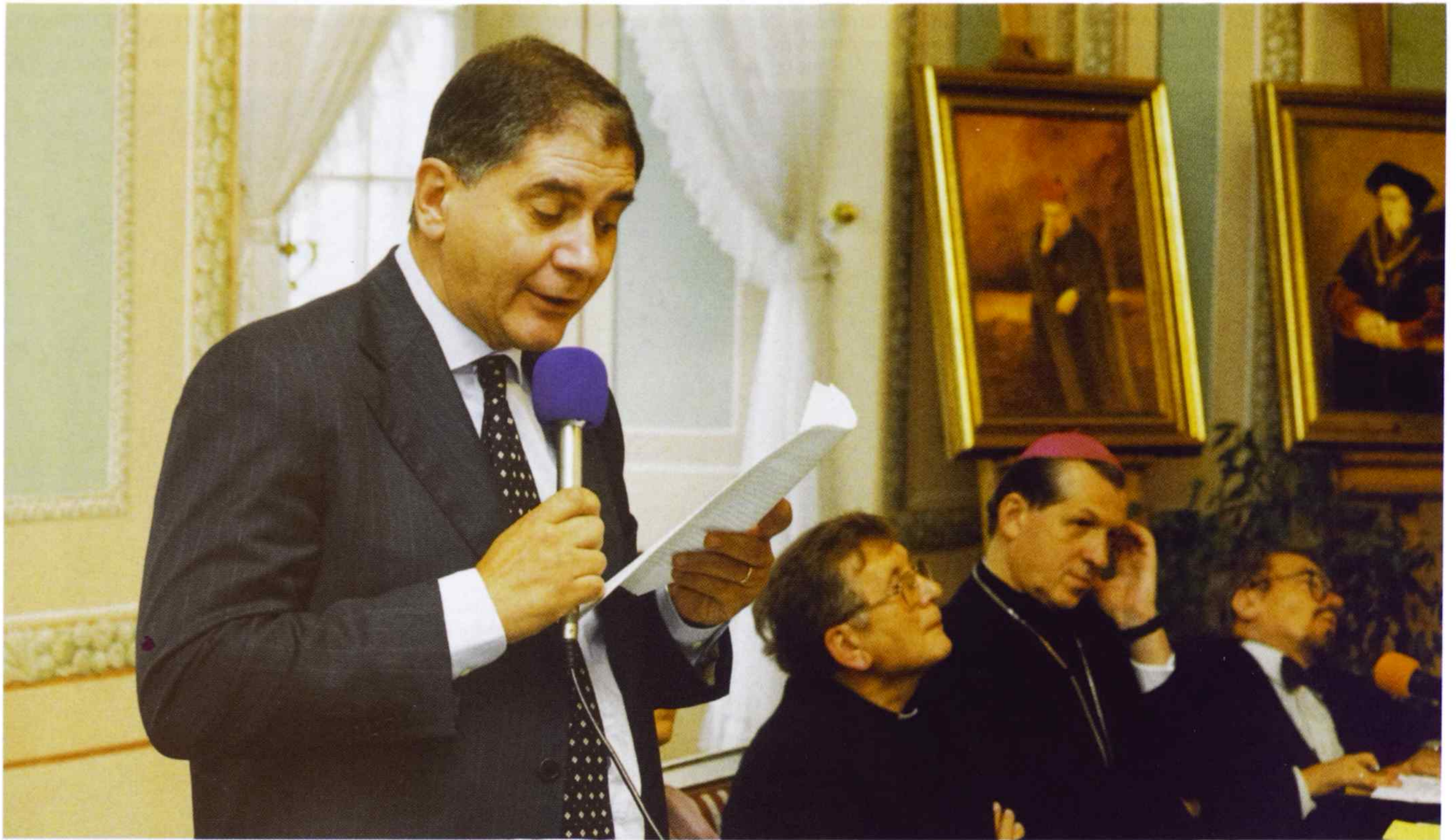
13. „Porządek Jałty opierał się na zasadzie prymatu siły nad prawem. Pontyfikat Jana Pawła II i głęboko z nim związany ethos solidarności doprowadziły do kryzysu tego porządku ze ściśle moralnego powodu: odwoływały się nie do racji siły, lecz do siły moralnej”. Prof. Rocco Buttiglione, Minister do spraw Integracji Europejskiej w Rządzie Republiki Włoskiej, mówi o zasadzie „Plus ratio quam vis” w polityce.