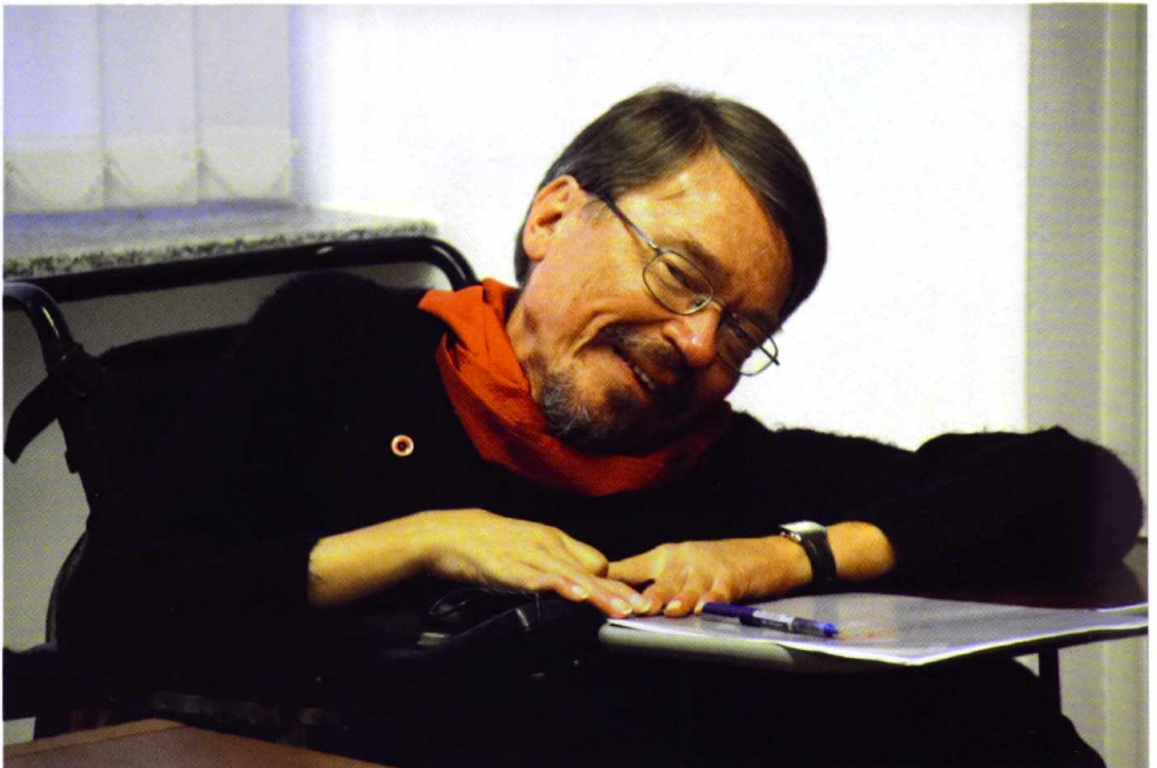
15. „Uczył chorobę czymś nieistotnym, co dawno pokonał, przekroczył i poszedł dalej, nie zatrzymując się”.