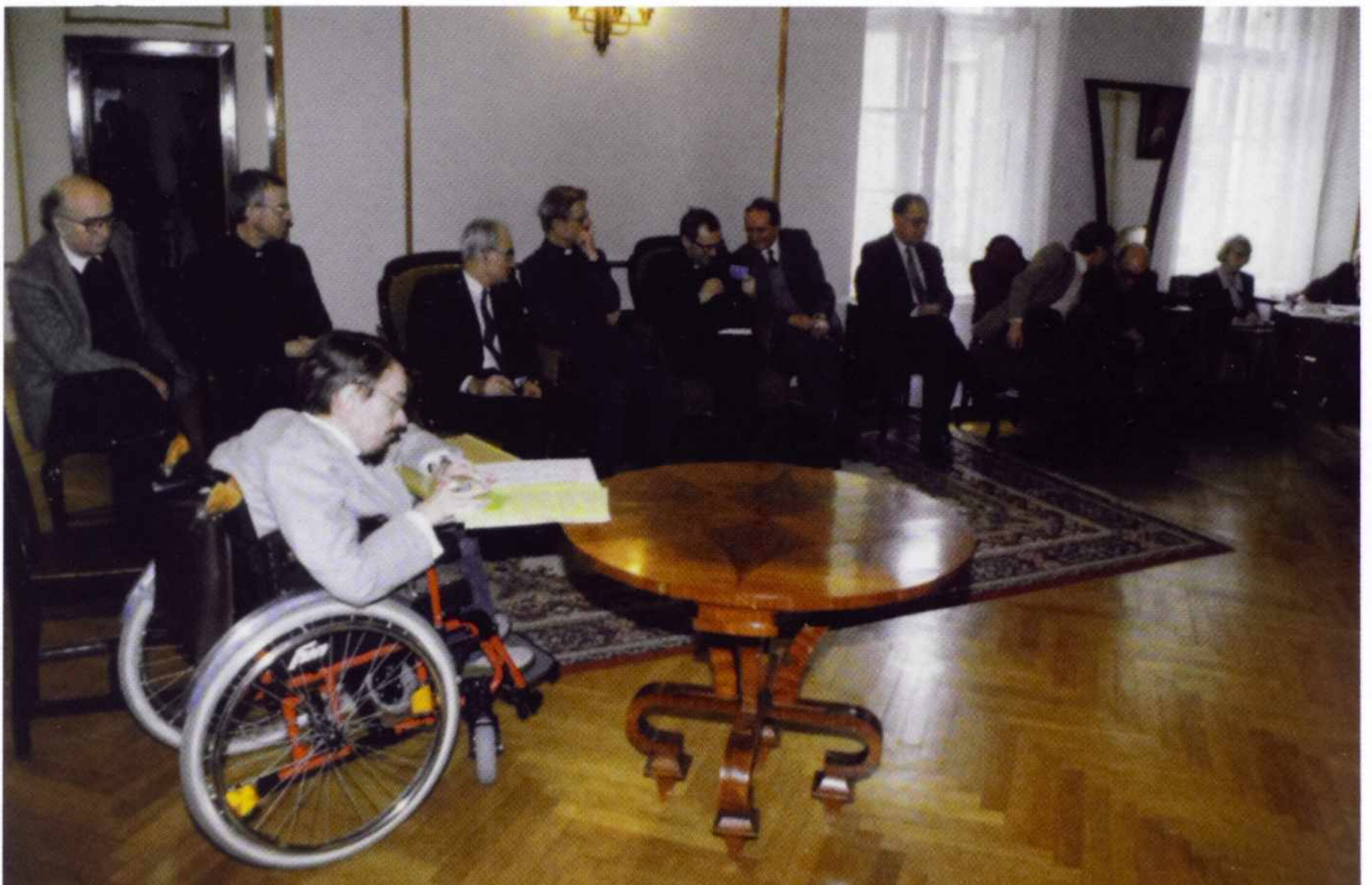
8. „Rozprawa każe uznać Chudego nie tyle za obiecującą, ile raczej za dojrzałą już postać we współczesnej filozofii europejskiej”. Kolokwium habilitacyjne (13 IV 1994).