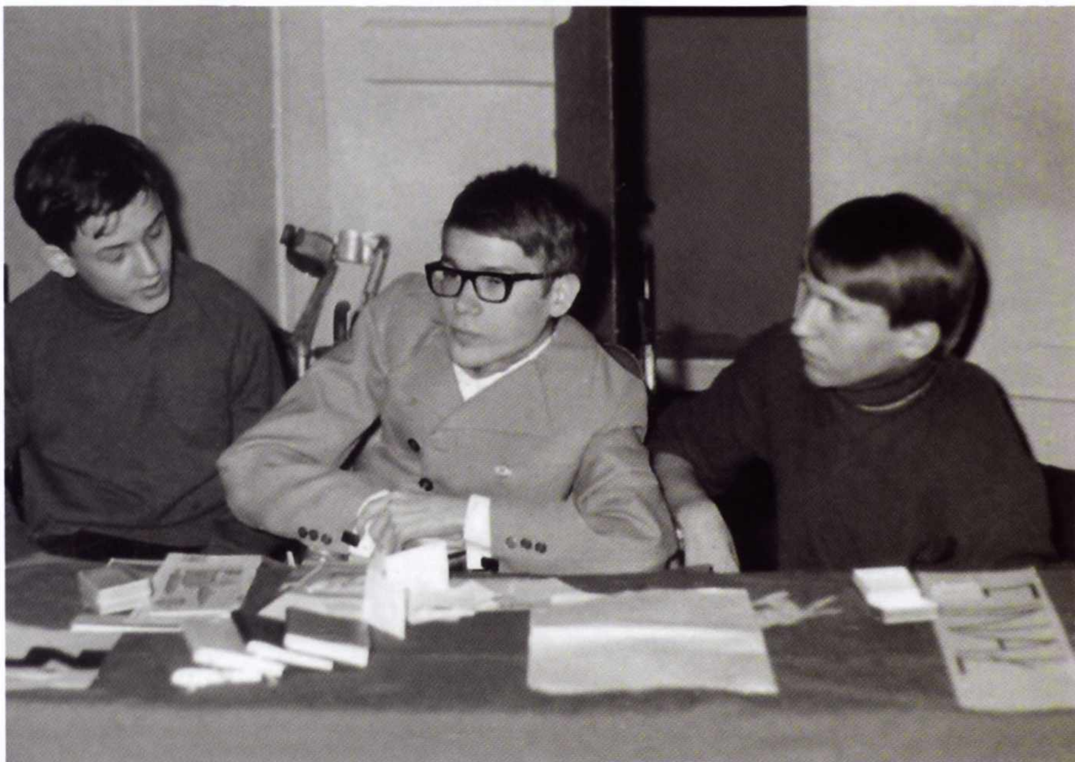
3. „Z listów dowiedział się o istnieniu szkoły podstawowej i średniej przy sanatorium”. W Liceum Ogólnokształcącym w Sanatorium Rehabilitacyjno-Ortopedycznym we Wrocławiu (1970).