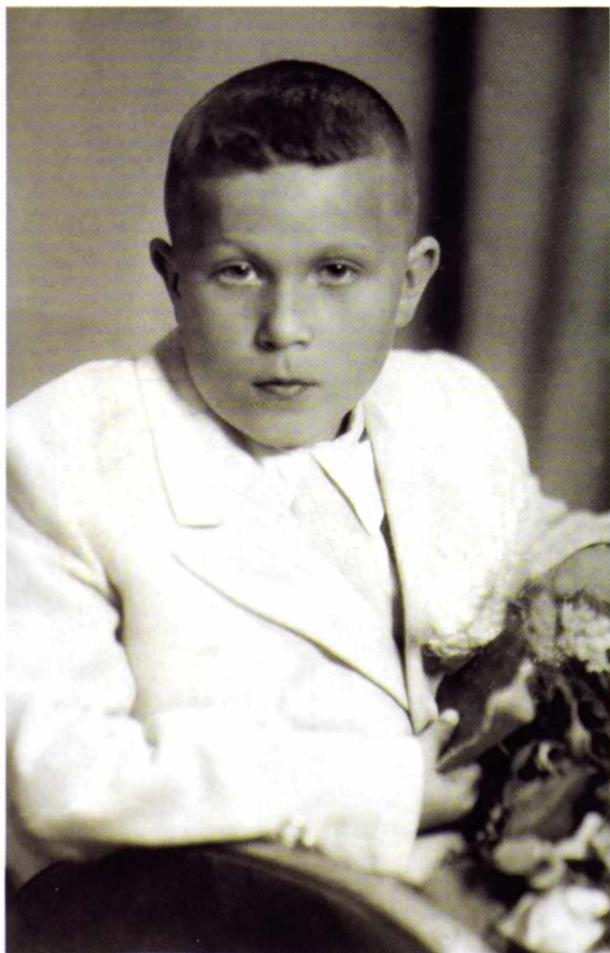
2. „Nie mistyka jest najskuteczniejszym sposobem na złączenie z Bogiem, tylko wiara. Można żyć wiarą na co dzień”. Pierwsza Komunia Święta (16 V 1957).