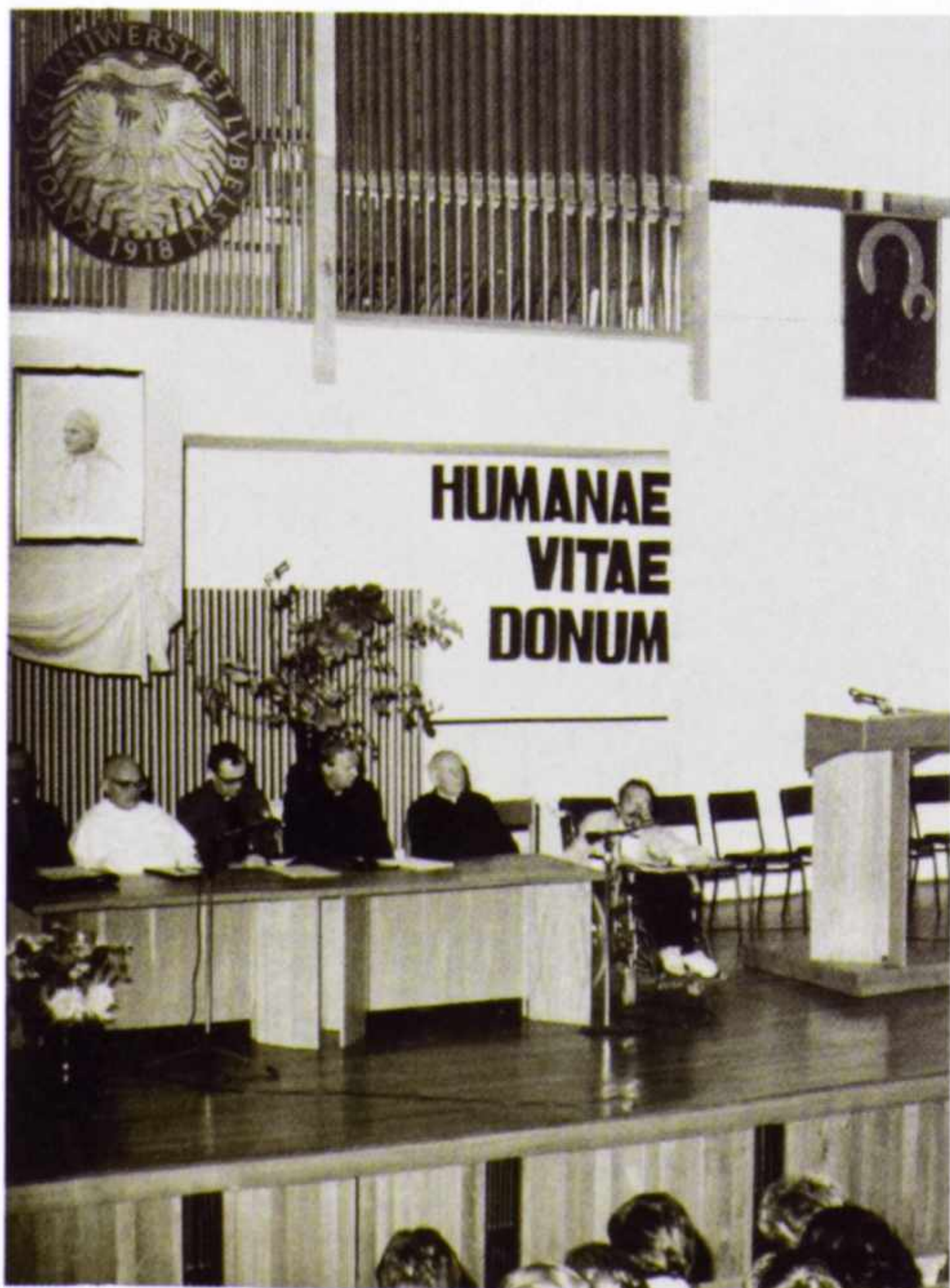
13. „Żaden rodzaj niepełnosprawności nie sięga tego wymiaru bytu ludzkiego, który decyduje o jego godności osobowej”. Sesja „Dar ludzkiego życia” (KUL, 5-8 X 1988).