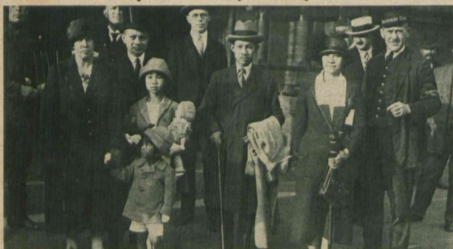
Książę siamski Demres przybył z rodziną do Europy, gdzie obejmie godność posła siamskiego w Berlinie.