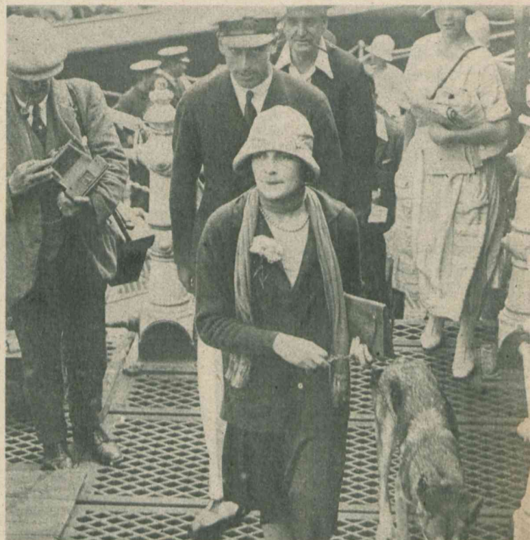
Lord i Lady Louis Mountbatten po swem zwycięstwie w wyścigach jachtów motorowych, opuszczają port w Bournemouth. Para ta uchodzi za najelegantszą w Londynie a lord Mountbatten, który dawniej nazywał się Battenberg, jest najlepszym przyjacielem następcy tronu.