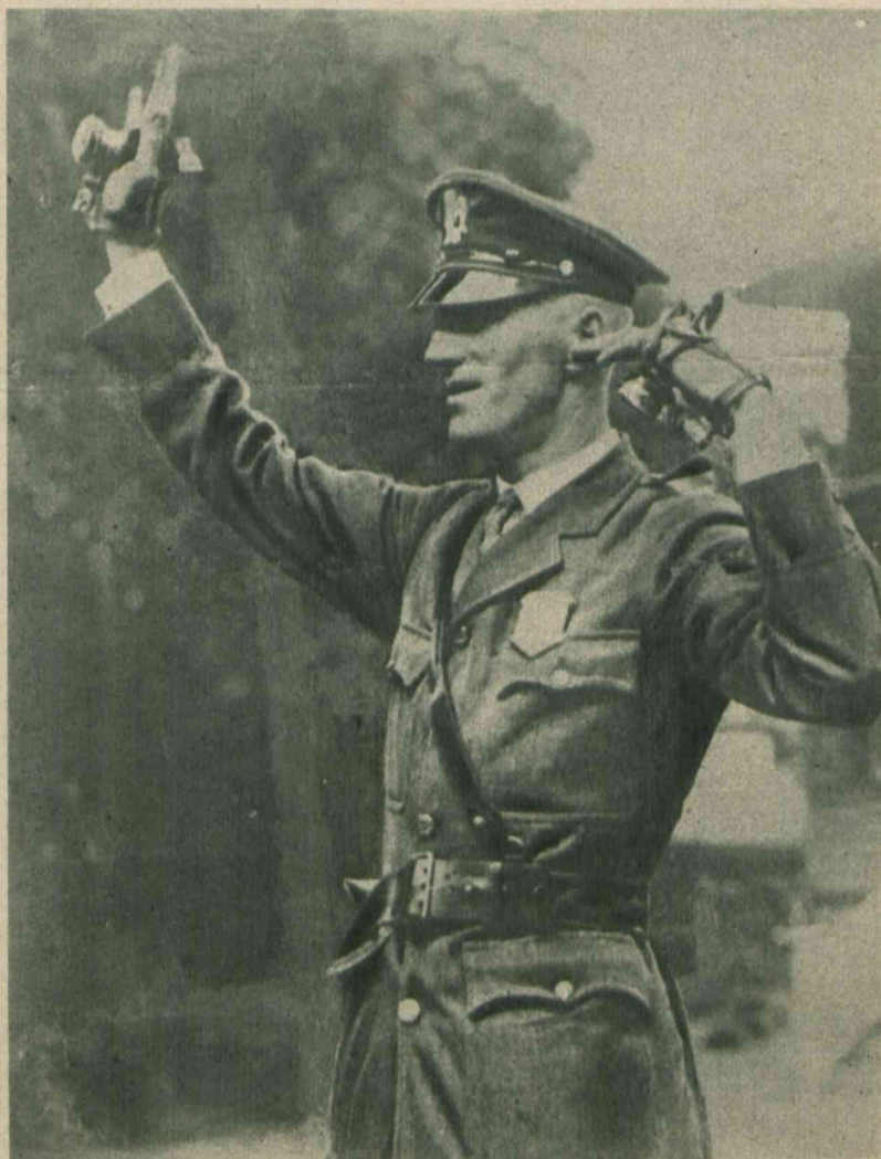
W Bostonie policjanci, regulujący ruch uliczny zaopatrzeni są w lampki sygnałowe, które noszą na rękach.