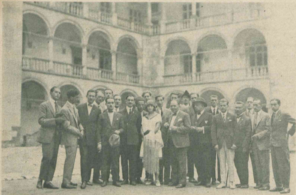
W Polsce bawi obecnie wycieczka studentów włoskich. Zdjęcie nasze przedstawia ich na dziedzińcu arkadowym Wawelu.