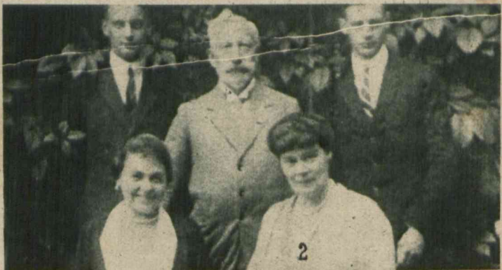
1) Wspaniały okaz wieloryba, schwytanego w okolicach Alaski. 2) Nasz stary „miły” znajomy „Kaiser” Wilhelm w otoczeniu rodziny w Dorn.