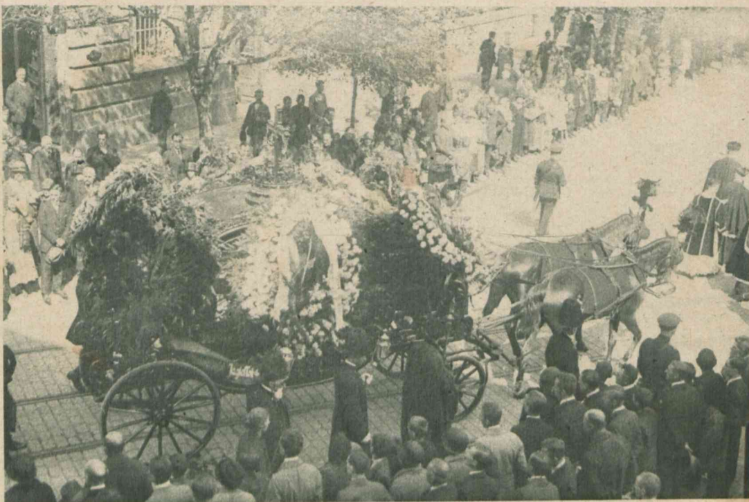
Śmierć prof. Kazimierza Morawskiego, prezesa Polskiej Akademii Umiejętności, jest dla nauki polskiej i dla całej Polski niepowetowaną stratą. Najuczestniejszy ten mąż w Polsce, był zarazem najwybitniejszym jej kultury przedstawicielem. Nic więc dziwnego, że po śmierci pierwszego Prezydenta Rzplitej, ofiaro- wywano mu kandydaturę na tę najwyższą godność państwa. Wnuk znanego poety i generała napoleońskiego Fr. Morawskiego, odziedziczył po nim zdolności pisarskie. Specjalnością jego była filologia klasyczna ale nie zaniedbywał także poezji. Najwybitniejszym jego dziełem jest 7-mio tomowa „Historja Literatury rzymskiej”. Jego „Historja Uniwersytetu Jagiellońskiego” jest dziełem jedynym w swoim rodzaju. W r. 1924 wystąpił go rząd polski na zaproszenie Francji do Paryża, gdzie w Sorbonie wygłosił szereg odczytów o kulturze polskiej w epoce Odrodzenia. Odprowadzenie zwłok ś.p. prof. Morawskiego na miejsce wiecznego spoczynku było wspaniałą manifestacją i wyrazem hołdu dla Jego osoby.