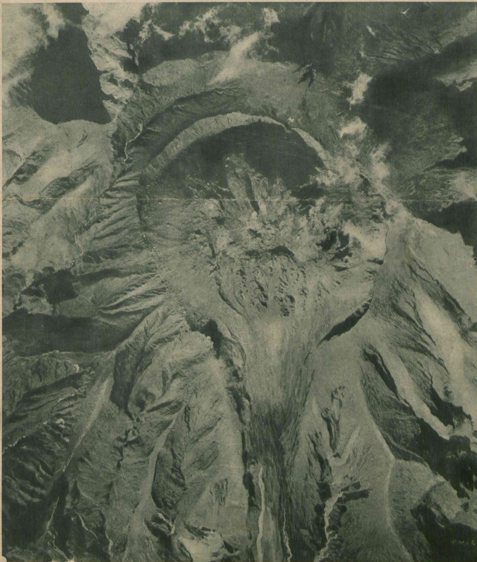
Krafer i wydobywające się z niego strumienie lawy, wulkanu Mont Pelé na Martynice. Zdjęcia tego dokonano z aeroplanu z wysokości 1.300 m. nad szczytem wulkanu a 2.600 m. nad poziomem morza. Wyspa Martynika, należąca do Francji, jest obecnie najmodniejszym celem wycieczek mieszkańców Nowego Jorku, od którego oddalona jest 12 godz. drogi parowcem.