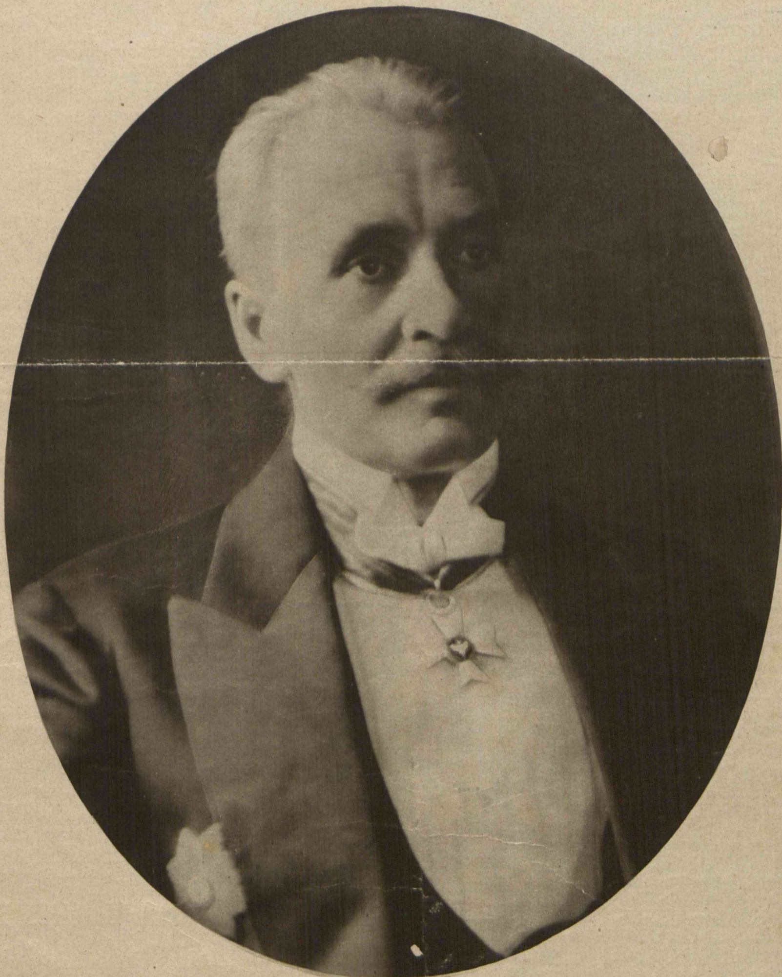
PREZYDENT IGNACY MOŚCICKI