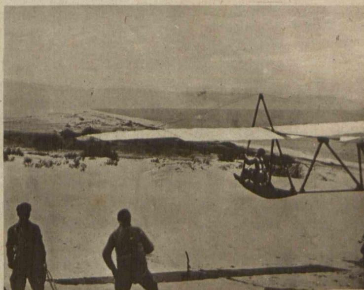
Nauczyciel niemiecki Ferdynand Schulz ustanowił nowy rekord światowy w locie na ślizgowcach, utrzymując się w powietrzu bez przerwy 9,5 godzin.