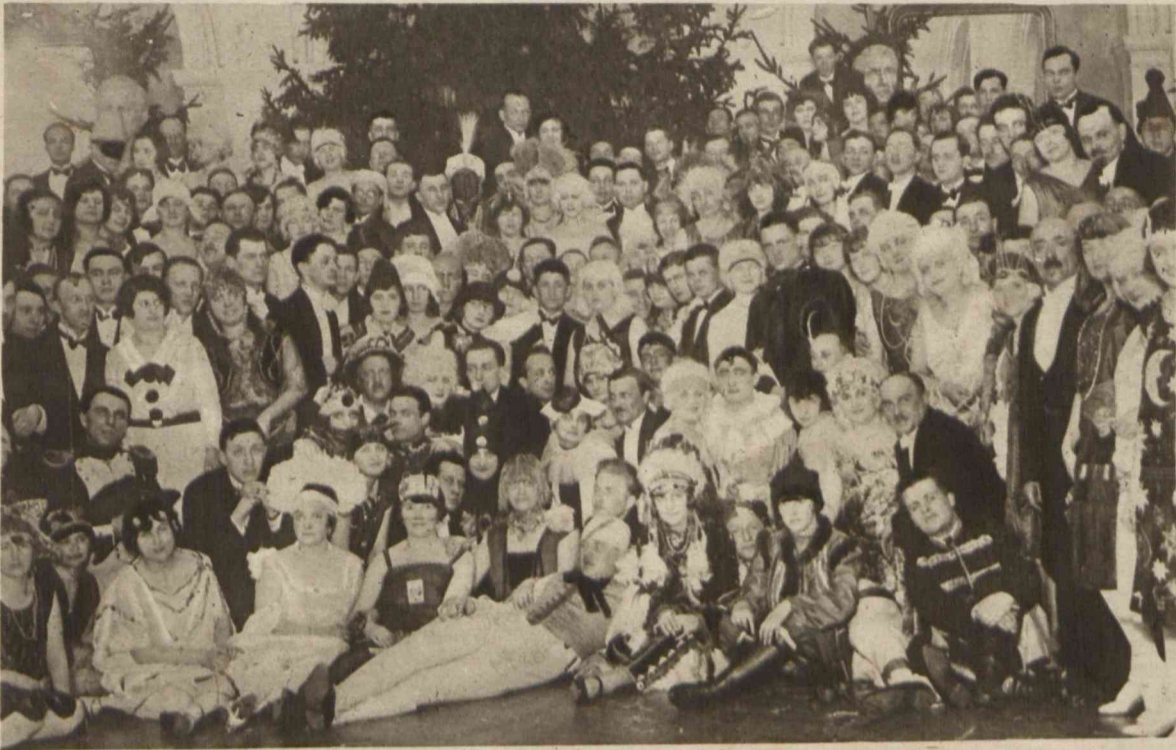
Echa karnawałowe we Lwowie. Bal ligi narodów w salach Koła literackiego.