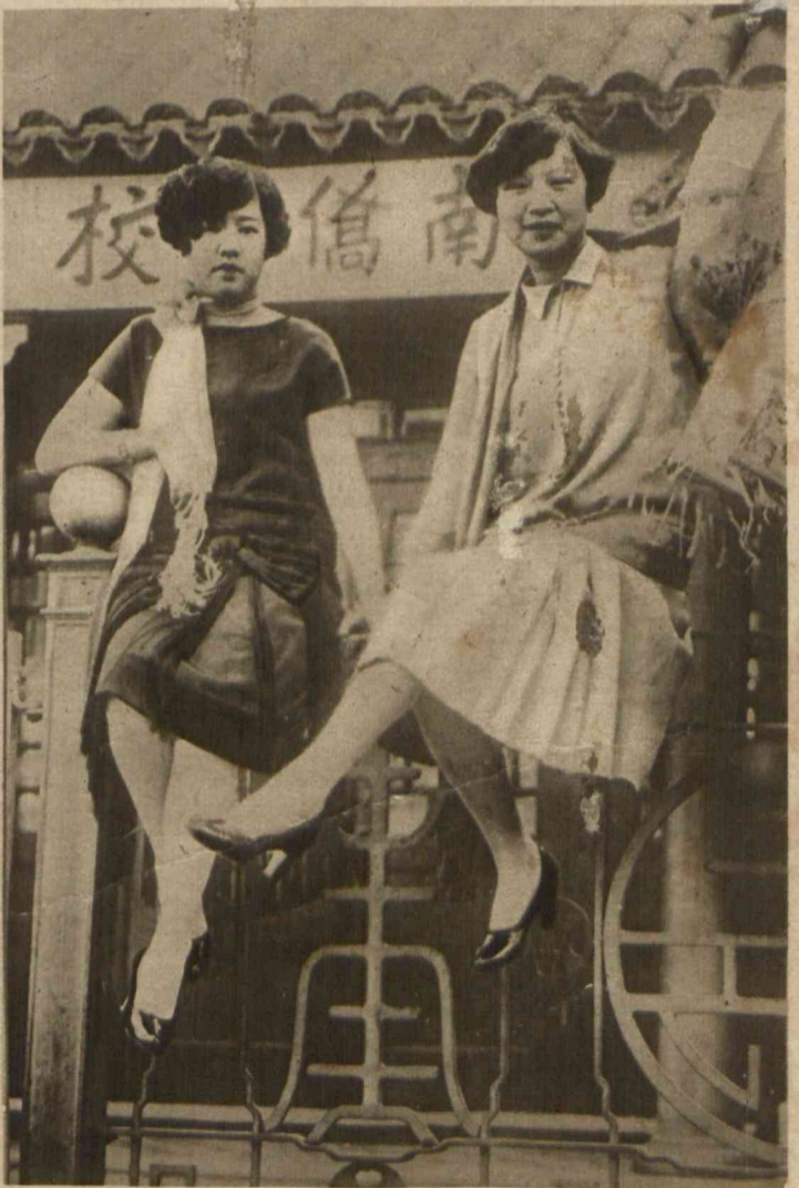
Tradycyjne chińskie święto „Latarni“, obchodzone jest uroczyście przez Chinczyków całego świata. Na zdjęciu widzimy 2 współczesne Chinki w San Francisco, z artystyczną papierową latarnią.

Ewolucja dziewczęcego kostiumu gimnastycznego. W akademii wychowania fizycznego w Szpandawie urządzono popisowe ćwiczenia gimnastyczne w kostiumach rozmaitych epok. Na zdjęciu górnem widzimy gimnastykę, ograniczającą się do piasów za czasów biedermajerowskich. Drugie zdjęcie przedstawia kostium gimnastyczny z połowy ubiegłego stulecia. Na trzecim widzimy popularny przed wojną kostium składający się z szerokich spodni i bluzy marynarskiej. Czwarte i ostatnie, to dzisiejszy higieniczny i praktyczny kostium lekko-atletyczny.