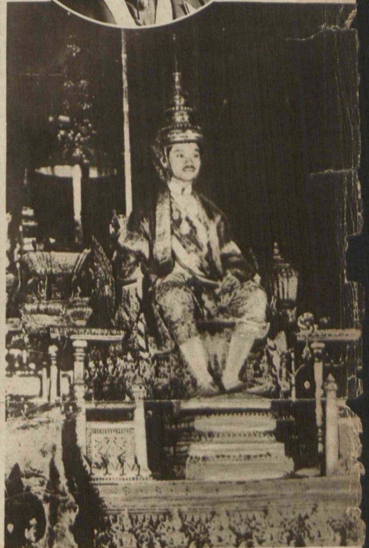
Nowo koronowany król Sjamu Rama VII, w uroczystym stroju, na kosztownym tronie.