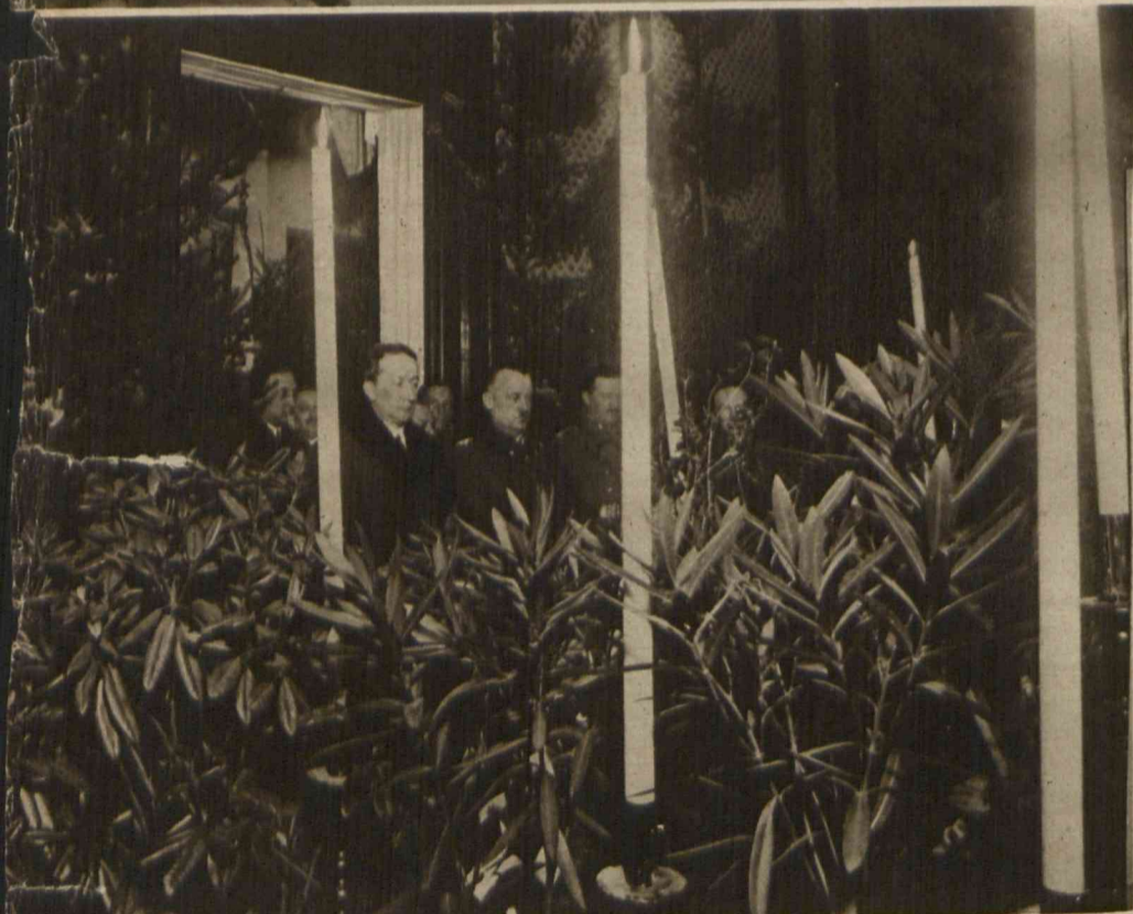
Trzy powyższe zdjęcia przedstawiają uroczystość przewiezienia zwłok bohaterów z pod Rarańczy. Na zdjęciu najwyższym widzimy scenę z pogrzebu we Lwowie, lafetę z trumną. Na środkowym: Delegacje stowarzyszeń ze sztandarami składają wieńce na trumny bohaterów. U dołu widoczni woj. lwowski Garapich i gen. Sikorski.