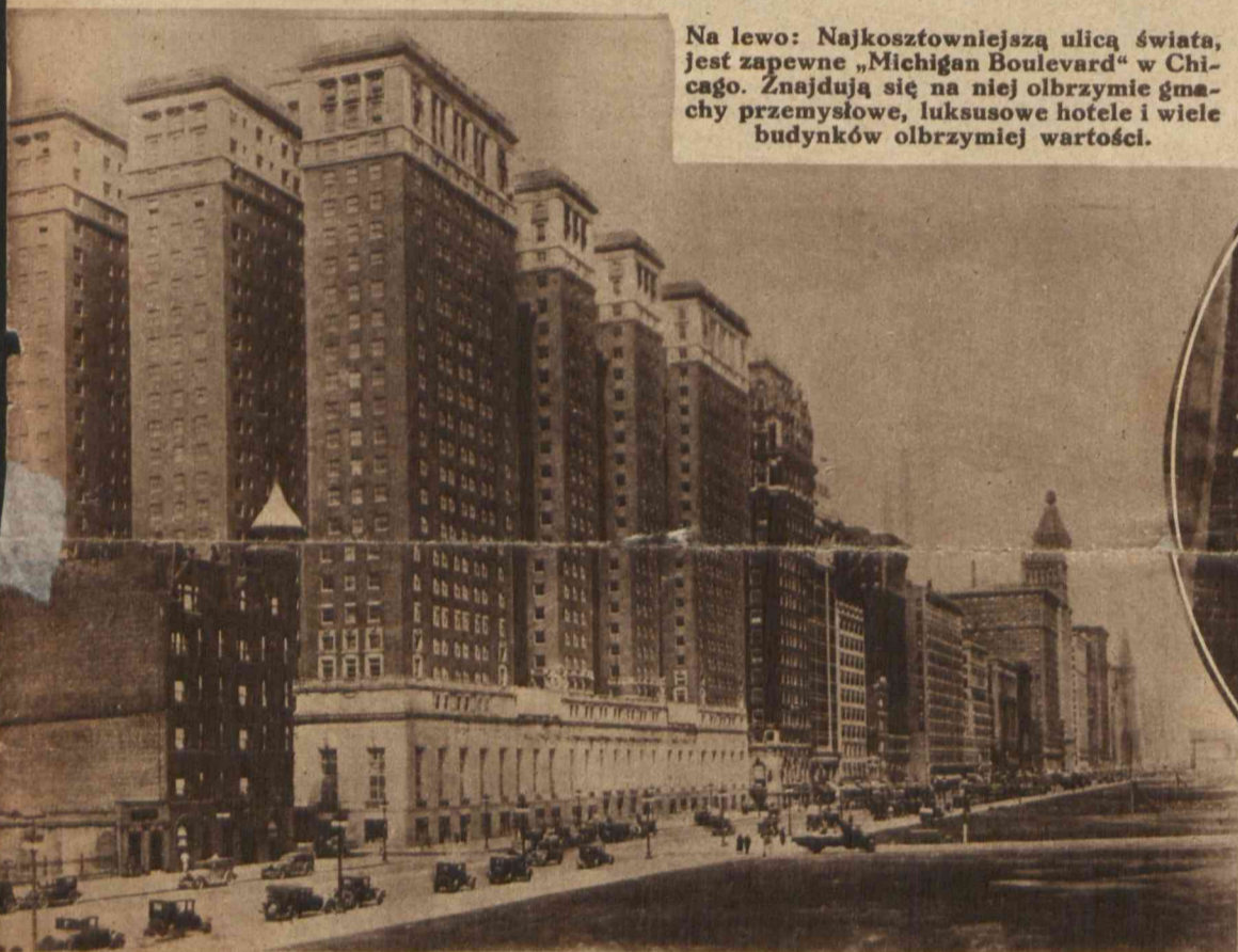
Na lewo: Najkosztowniejszą ulicą świata, jest zapewne „Michigan Boulevard” w Chicago. Znajdują się na niej olbrzymie gmachy przemysłowe, luksusowe hotele i wiele budynków olbrzymiej wartości.