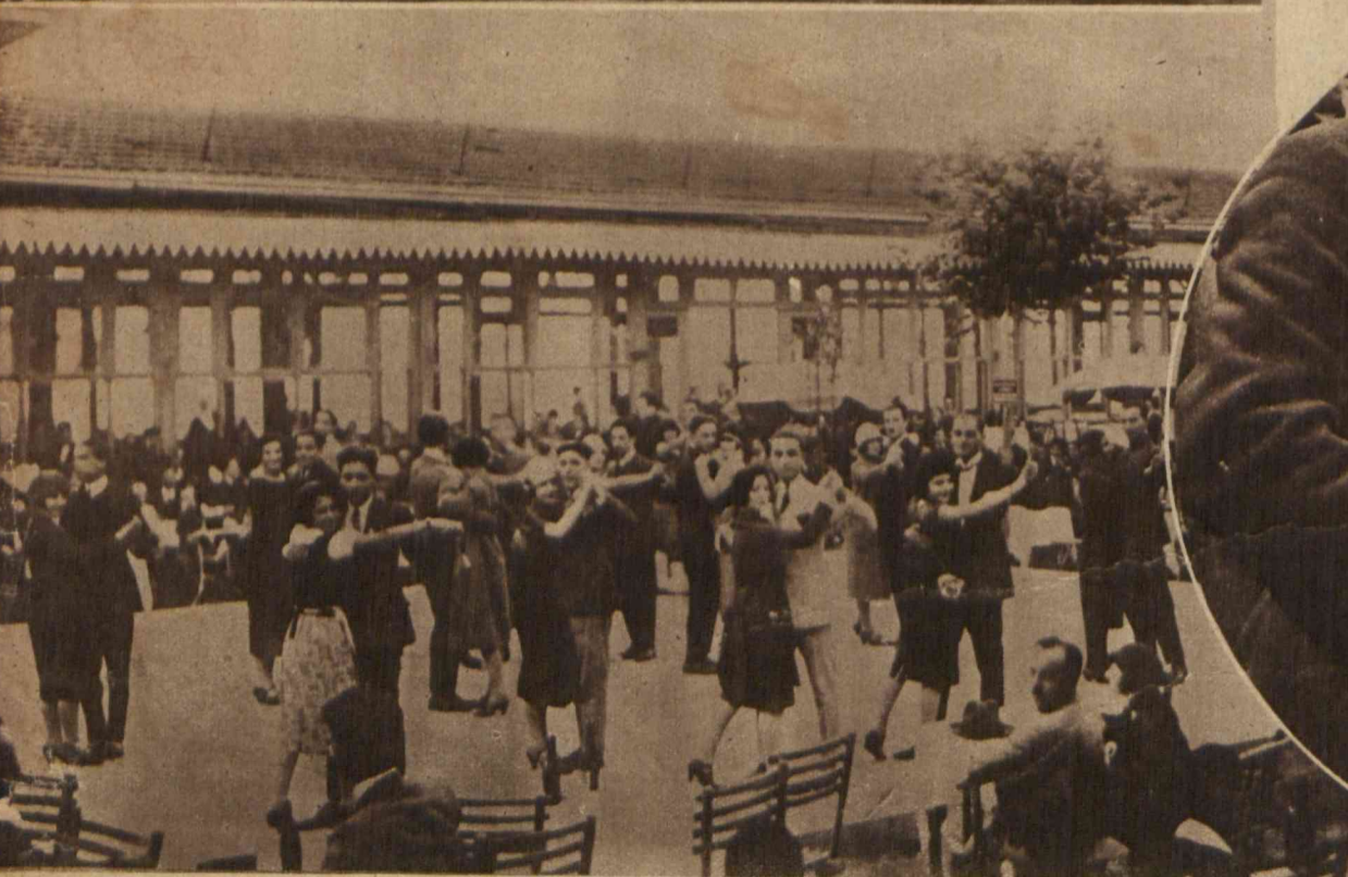
Scena z zabawy tanecznej w Serai Burnu (Turcja). Jak widzimy, dancng nie różniący się niczem od europejskich. Zasłony zostały zrzucone.