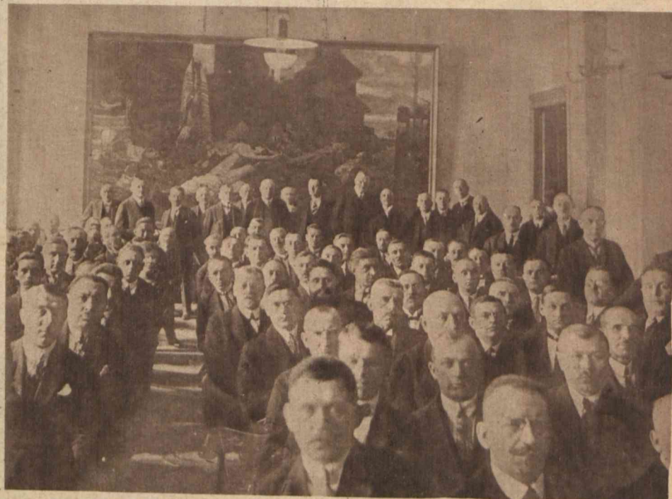
Otwarcie zjazdu delegatów zrzeszeń pracowników samorządowych miejskich we Lwowie. Na zdjęciu posiedzenie w sali Muzeum Przemysłowego we Lwowie.