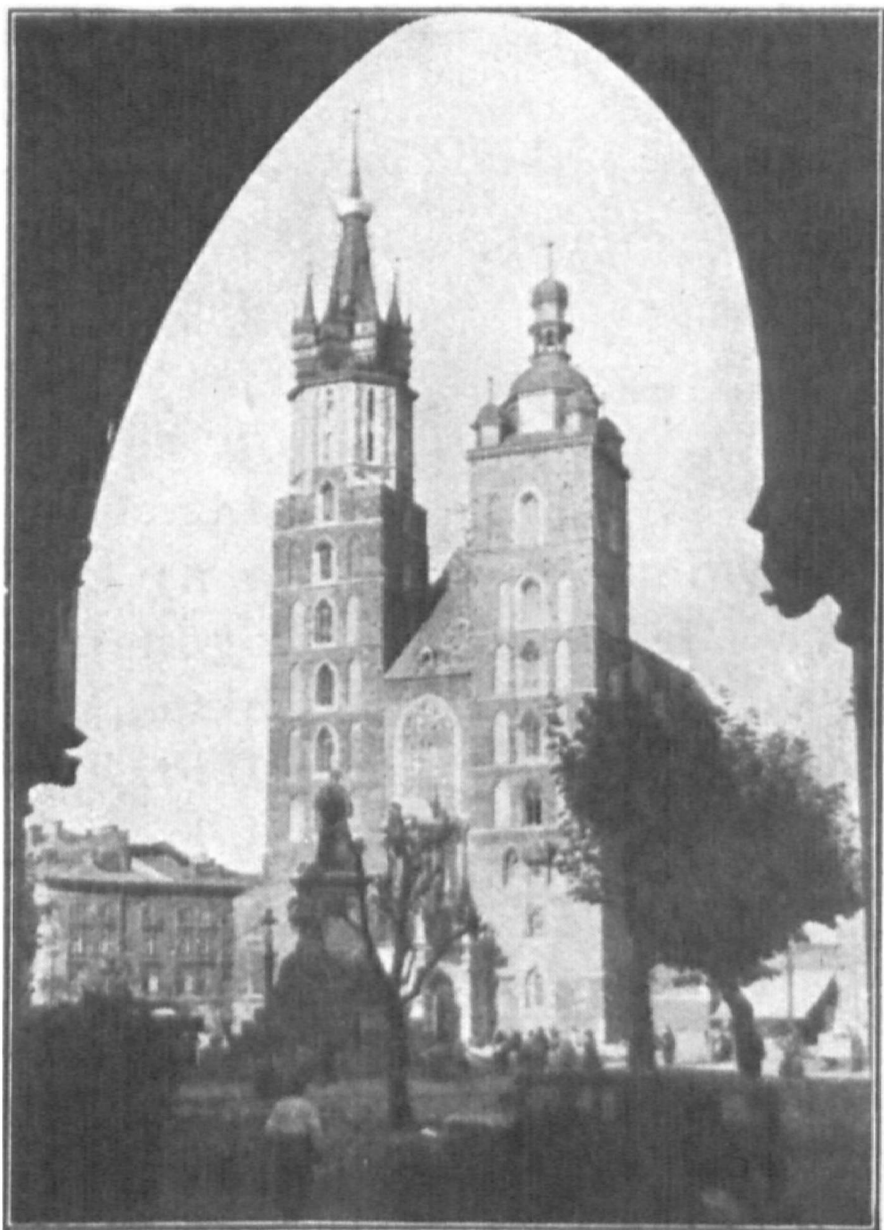
Preĝejo de S-ta Mario en Kraków.

Sur larĝa kaj pereanta en krepusko de jarcentoj vojo, kiun ĉiame marŝas antaŭen en senlaca iro disvolva la homa spirito, aperas de temp' al tempo esceptaj individuoj, superkreskantaj la kapojn de milionaj aroj. Dank'