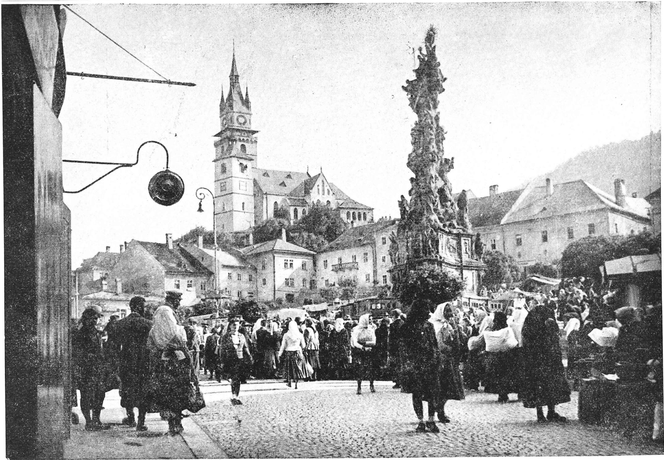
Foiro en la malnova ormineja urbo Kremnica.