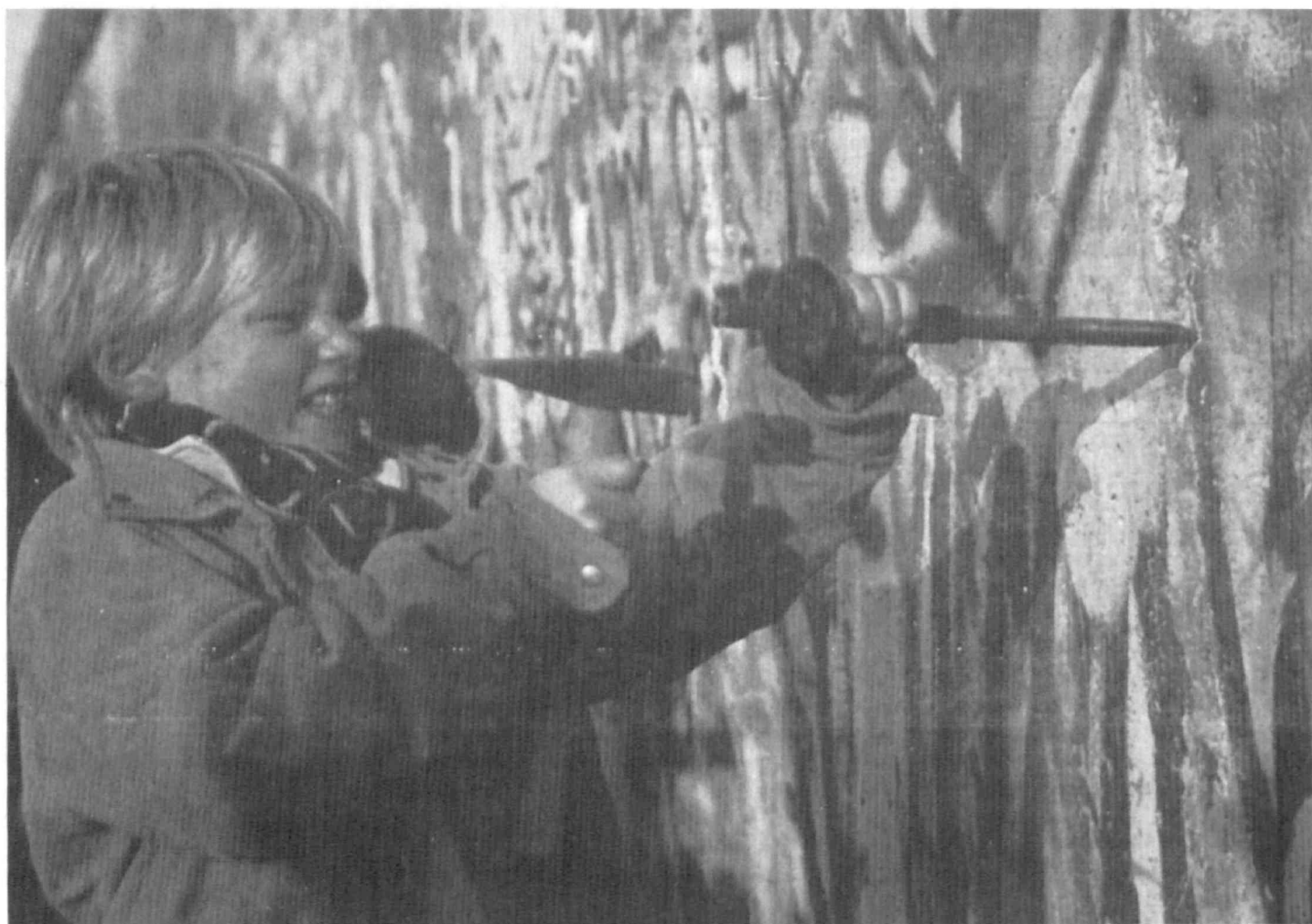
Infano atakas la (nun disfalgitan) Muregon de Berlino