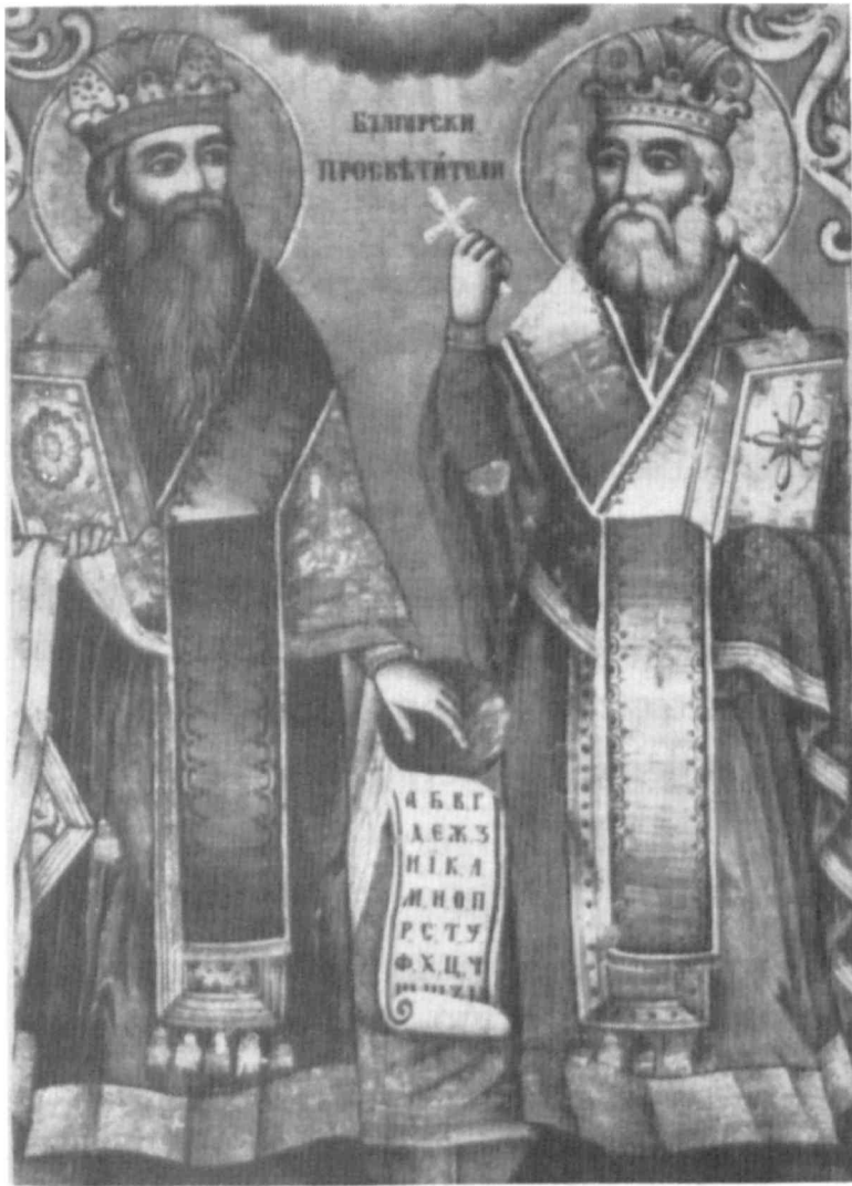
Sanktaj Cirilo kaj Metodo

la slavaj nacioj. Kaj ni sopiris ankaŭ pilgrimi ĝuste tien, por renkonti tie nian amatan Sanktan Patron kaj travivi en lia ĉeesto grandan misteron de la plej sankta Ofero. Jes, tio, kio ankoraŭ antaŭ kelkaj monatoj ŝajnis por ni esti nura revo, tiel rapide realiĝis, ke oni povas kun dankemo al Dio paroli pri vera miraklo kaj granda amo de la ĉiela Patro.