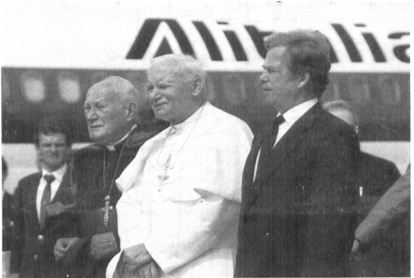
Kard. Tomašek, Papo Johano Paŭlo la Dua kaj Prezidento Havel

La unuan fojon en la historio de la ĉeĥa kaj slovaka popoloj, vizitis la 21-an kaj la 22-an de aprilo 1990 la Sankta Patro Johano Paŭlo la Dua Ĉeĥoslovakion. Ĉeĥoslovakio estas, krom lia patruja Pollando, la unua lando de iama orienteŭropa bloko, kiun la Papo vizitis. Ĉi tiu lia vizito havas grandan signifon ne nur por Ĉeĥoslovakio mem, sed por tuta Eŭropo kaj ankaŭ por la tuta mondo. Pro tio, milionoj da katolikoj kaj certe ankaŭ alikonfesiaj kristanoj kaj la ceteraj homoj de bona volo tiuokaze direktis sian atenton al Ĉeĥoslovakio. La plej grandan ĝojon travivis ni, kiuj povis en la ĉeesto de la Papo travivi tiujn ĉi neforgeseblajn historiajn okazintaĵojn. La Papo alportis al ni, kiel li diris, amon, veron kaj kredon. La grandan ĝojon mi volas dividi kun vi, karaj IKUE-anoj kaj legantoj de Espero Katolika, kaj ĝuste tial mi raportas pri ĉi tiu grava vojaĝo de nia amata Sankta Patro.