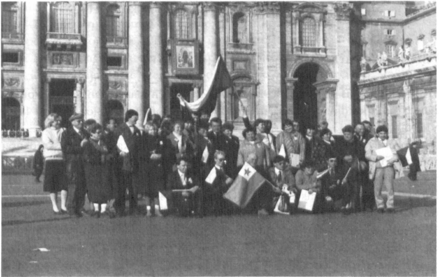
Grupo da ĉeĥoslovakaj geesperantistoj antaŭ la S. Petro-Baziliko en Romo, okaze de la sanktproklamo de Agnesa la Ĉeĥa

Via Sankteco, karaj samcivitanoj, mi ne scias, ĉu mi scias, kio estas miraklo. Malgraŭ tio mi aŭdacas diri, ke mi ĉi-momente estas ĉeestanto de miraklo: mi, la homo, kiu ankoraŭ antaŭ ses monatoj estis arestita kiel malamiko de la ŝtato, hodiaŭ kiel prezidento mi bonvenigas la unuan papon en la historio de la katolika eklezio sur la tero, kie ĉi tiu ŝtato troviĝas.