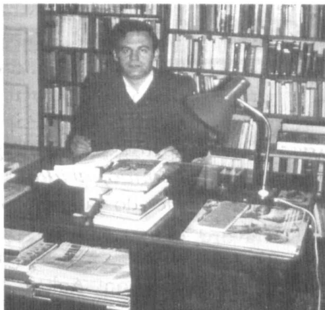
Pastoro (nun Episkopo de la Reformita Eklezio) Laszlo Tokes, ĉirkaŭ kiu koaguliĝis la popola ribelo en Timisoara, Rumanio