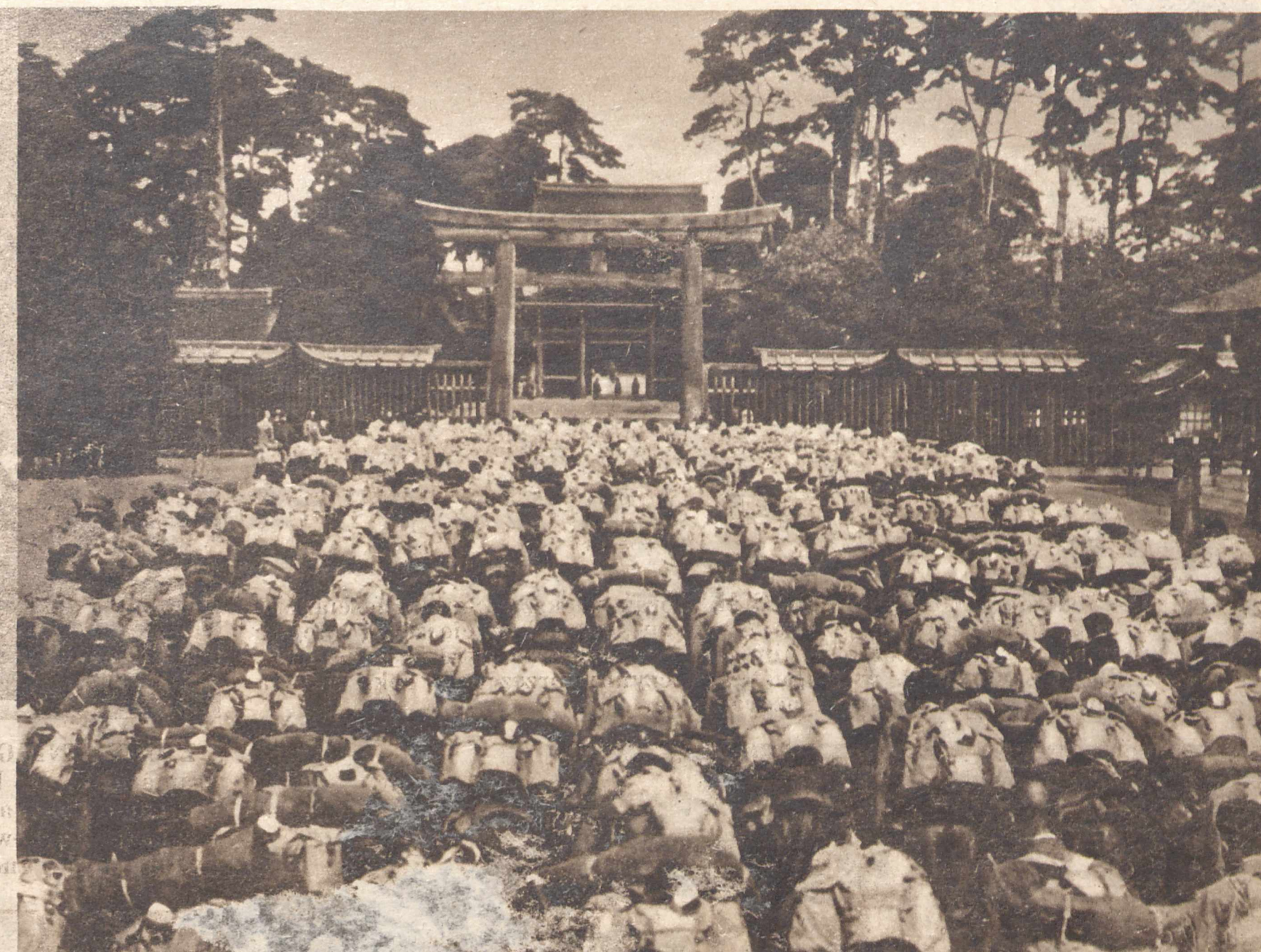
MODLITWA PRZED WYKIEPNIENIEM W POLE. Walki japońsko-chińskie prowadzone są z obu stron z wielką zaciętością. Czołgi obojczy modlą się do swoich bóstw z błagalną prośbą o zwycięstwo. Nasze zdjęcie przedstawia oddział wojska japońskiego, pochylonego w kornej modlitwie przed jedną z kamiennych w Tokio.