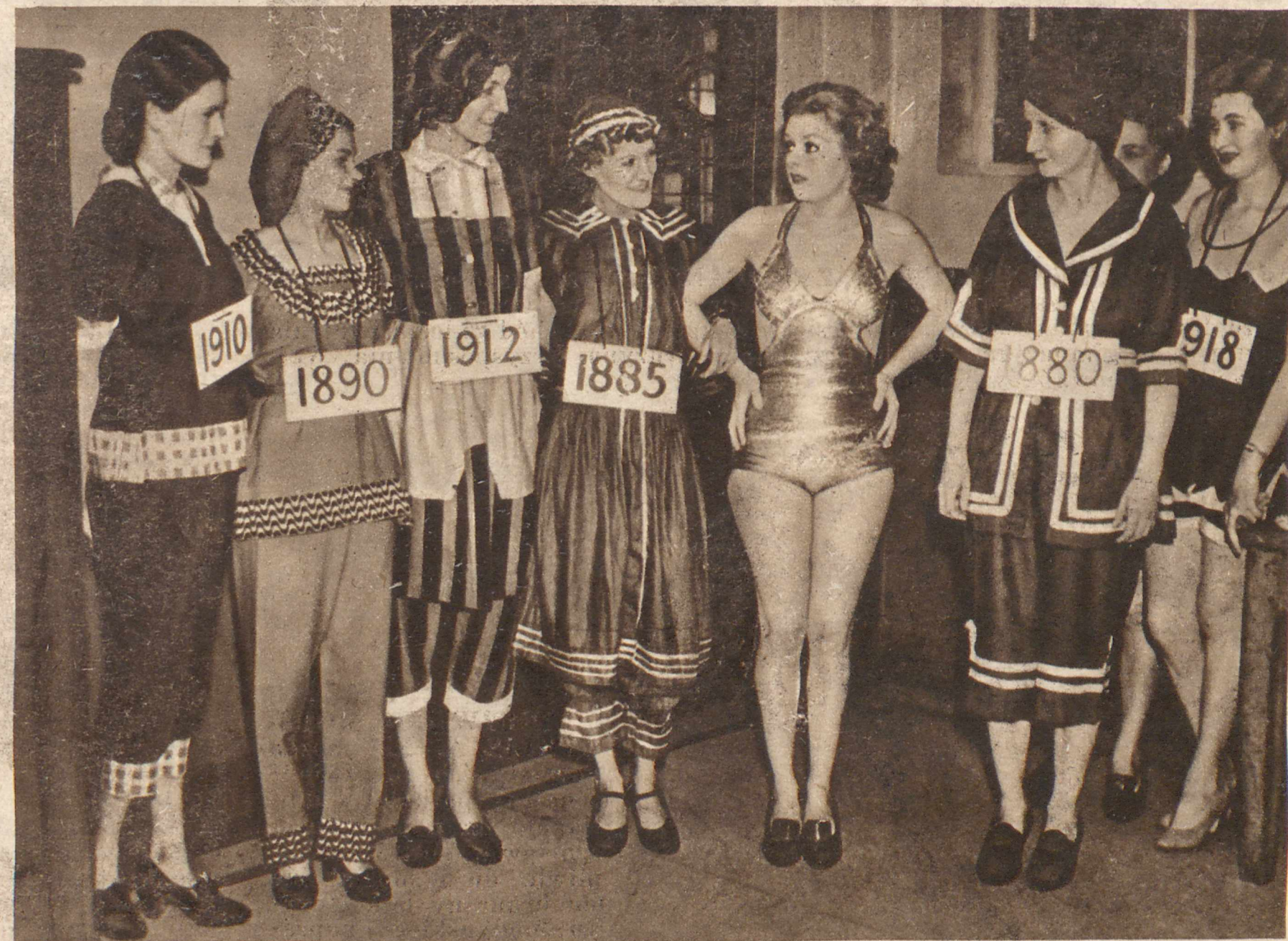
HISTORYCZNA REWJA KOSTJUMÓW KAPIELOWYCH. W jednej z pływalni londyńskich urządzono przegląd kostjumów kąpielowych od r. 1880 do 1937 r. Wobec tego, że, jak historyczna ta rewja wykazuje, kostjumy kąpielowe są coraz to... lepsze, jak będą wyglądały za lat np. dwadzieścia!...