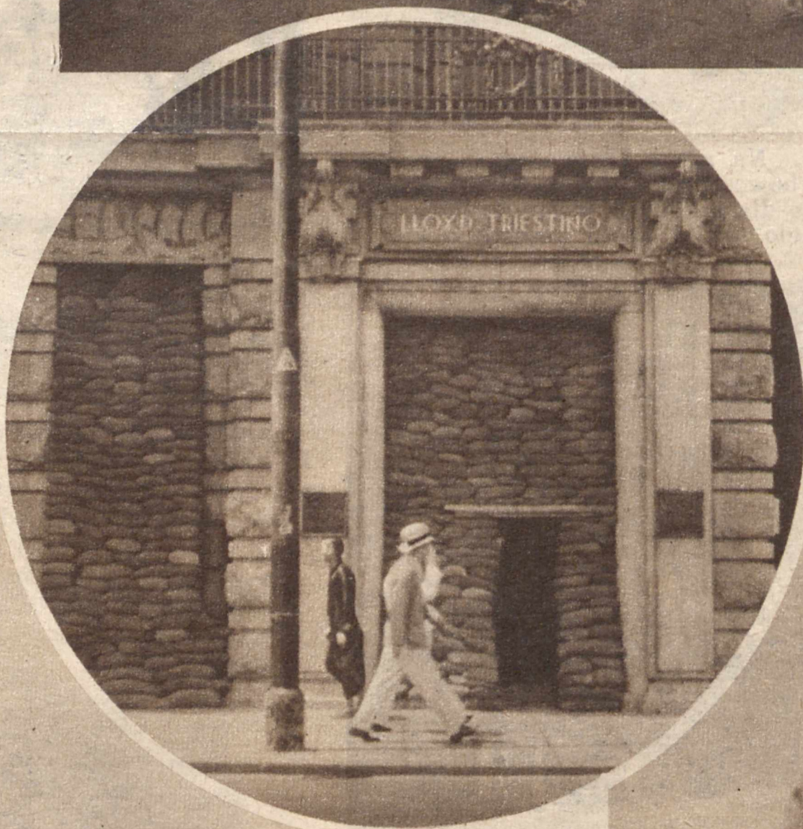
W kole: Workami z piasku zabezpieczają funkcyj- nujące jeszcze w Szanghaju między- narodowe banki i biura okna i drzwi, pozostawiając tylko małe otwory dla klijentów.