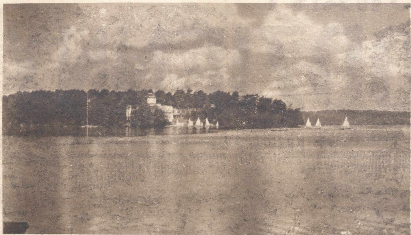
NAD JEZIOREM AUGUSTOWSKIM. Coraz większa popularnością cieszy się w całej Polsce uroczę jezioro Augustowskie, cel wycieczek i miejsce wypoczynku nie tylko w sezonie letnim, ale i w obecnym okresie jesiennym. Oficerski Yacht-Klub R. P. w Augustowie, czynny przez cały rok, ułatwia znakomicie pobyt w tym pięknym uzdrowisku.