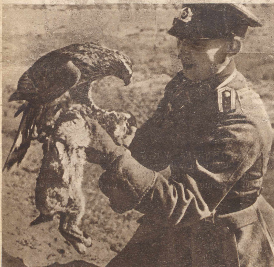
W WALCE Z PŁAGĄ DZIKICH KRÓLIKÓW. W Prusiech Wschodnich rozmnożyły się dzikie króliki, niszczące plony rolne. W walce z nimi tamtejsze garnizony wojskowe posługują się jastrzębiami, specjalnie do tego rodzaju polowań tresowanymi. Wprawny w tem jastrzab usmierca codziennie kilkaset królików.