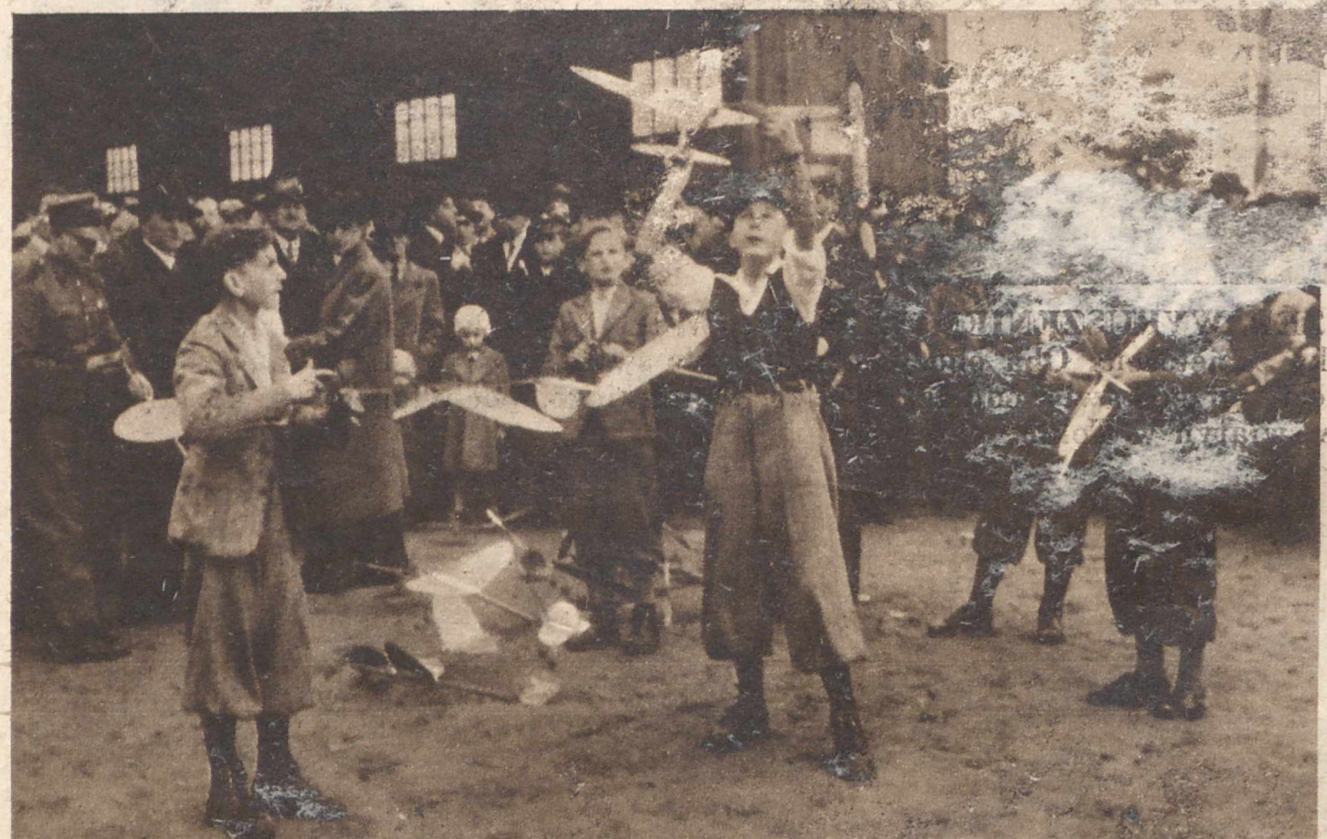
NOWE SZYBOWISKO — NA ŚLASKU. Na górze Hugona pod Świętchłowicami staraniem Związku Kół Szybowniczych Wspólnoty Interesów zostało uroczyste otwarte nowe szybowisko dla szkolenia młodych hutników. W inauguracyjnym konkursie modeli wzięło udział wielu uczestników.