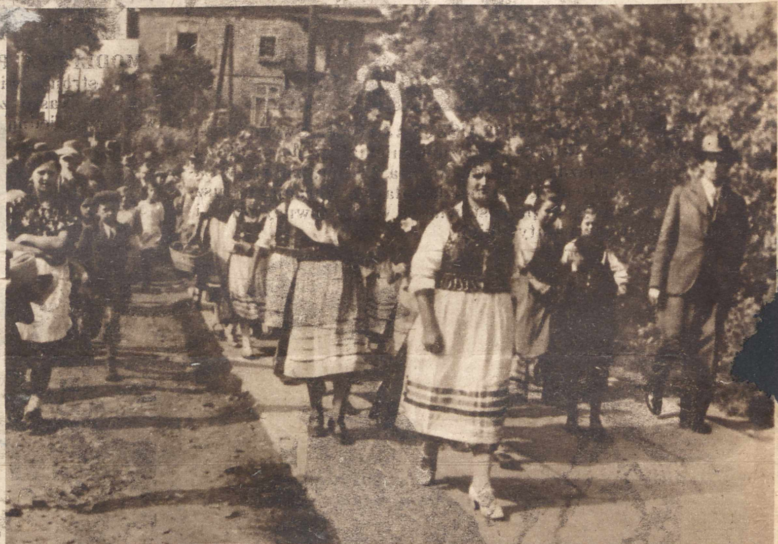
DOŻYTKI W ZIEMI KRAKOWSKIEJ. W Krzeszowicach pod Krakowem odbyły się tradycyjne dożynki powiatu chrzanowskiego, zorganizowane przez Okręgowe Towarzystwo Rolnicze w Chrzanowie i Związek Młodzieży Ludowej, oraz Katolickich Stow. Młodzieży. Na zdjęciu fragment malowniczego pochodu dożynkowego.