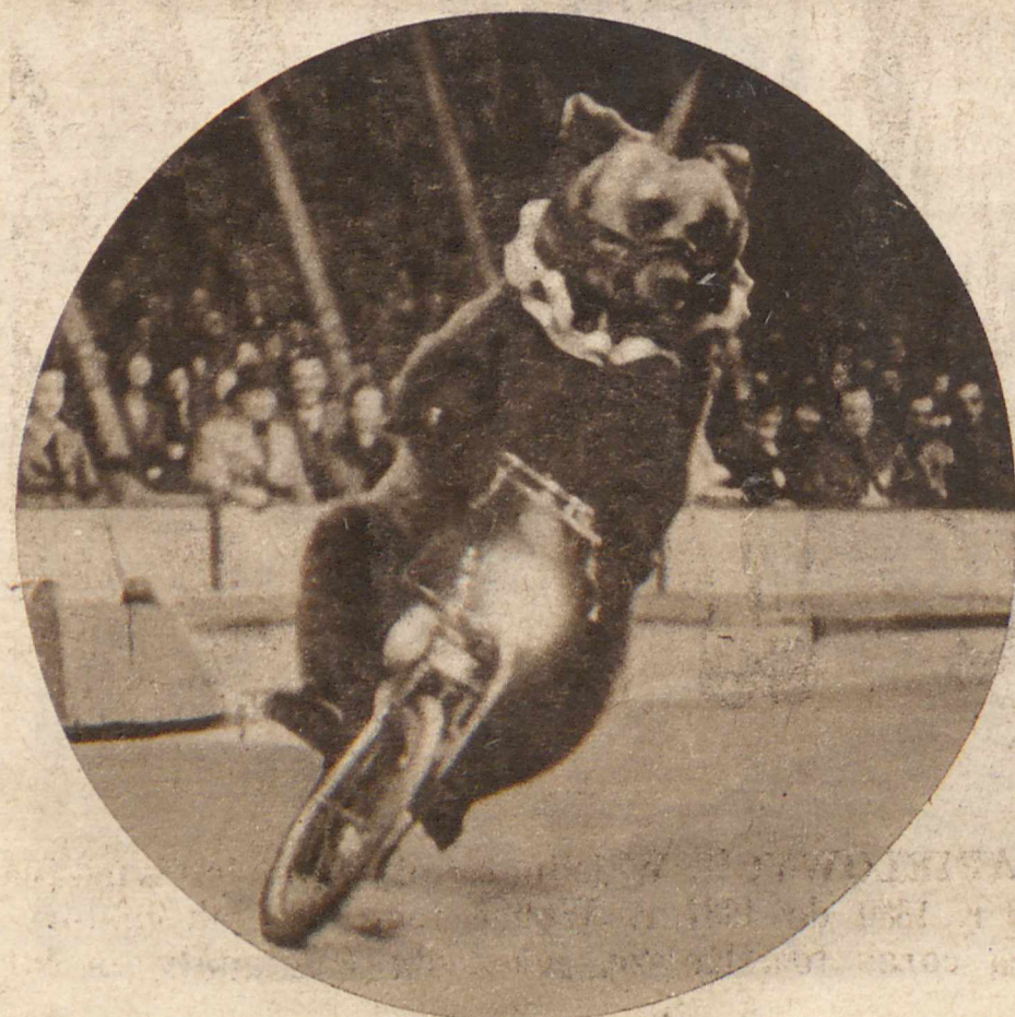
NIEDZWIEDZ MOTO-OYKLISTA. Nie można powiedzieć, by niedźwiedź z natury posiadał kwalifikacje na tego rodzaju sportowca. To też niewątpliwie dużo musiał się ten brunatny miś z cyrku londyńskiego napracować, zanim pod kierunkiem swego wychowawcy nauczył się jeździć na motocyklu. Ale teraz robi to już wcale sprawnie.