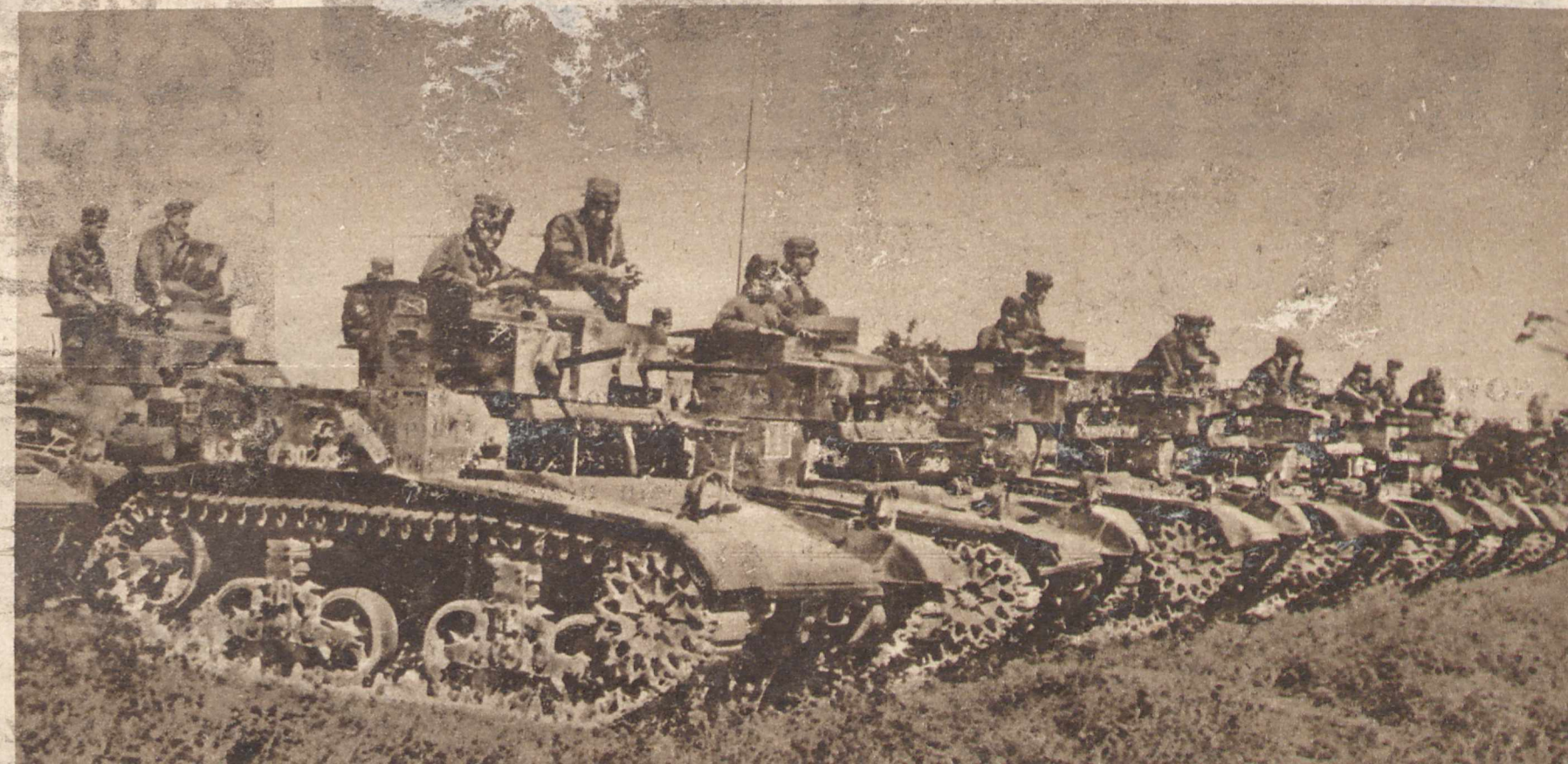
Z OSTATNICH MANEWRÓW AMERYKANSKICH. Podczas tegorocznych jesiennych wielkich manewrów w Pensylwanji zastosowano po raz pierwszy małe czołgi, zaopatrzone w karabiny maszynowe i urządzenie radjowe, a obsługiwane przez dwóch żołnierzy. Czołgi te rozwijają szybkość 90 km na godzinę.