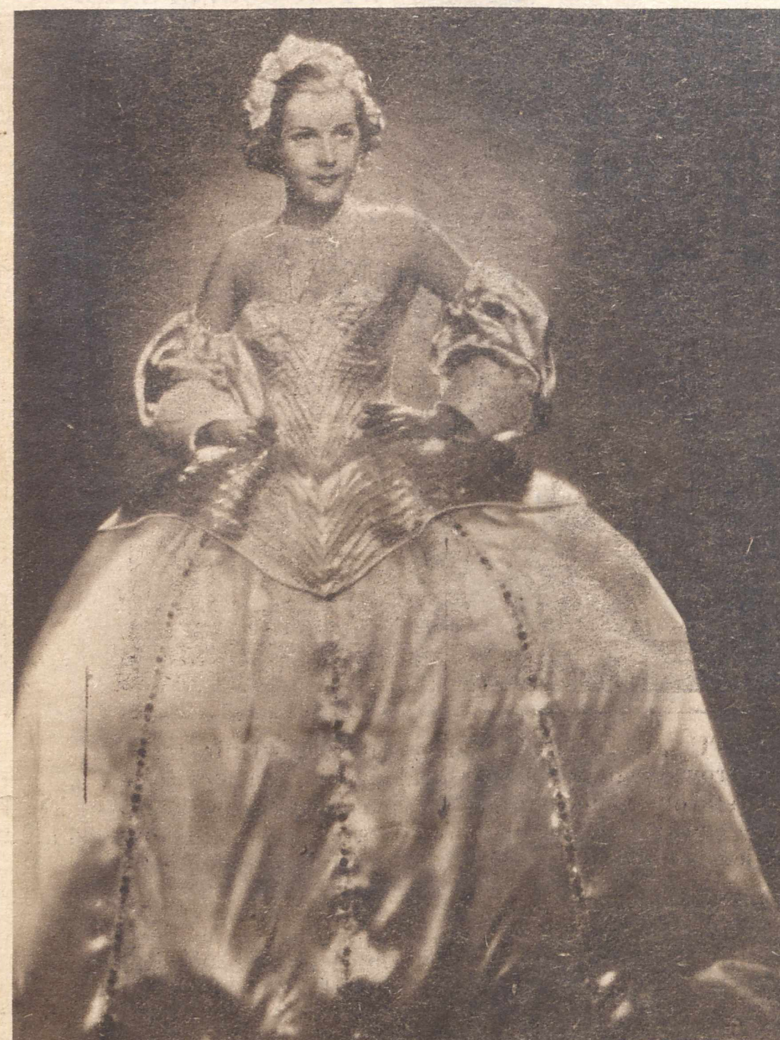
OFIARA KURACJI ODTŁUSZCZAJĄCEJ. Swego czasu bardzo popularna aktorka, a później niemal aż do ostatnich czasów głośna gwiazda filmowa, Renata Müller, zmarła w sanatorium berlińskim, gdzie poddawała się kuracji odtłuszczającej. Nasze zdjęcie przedstawia ją w efektownej roli Lislotte, księżniczki palatyńskiej.