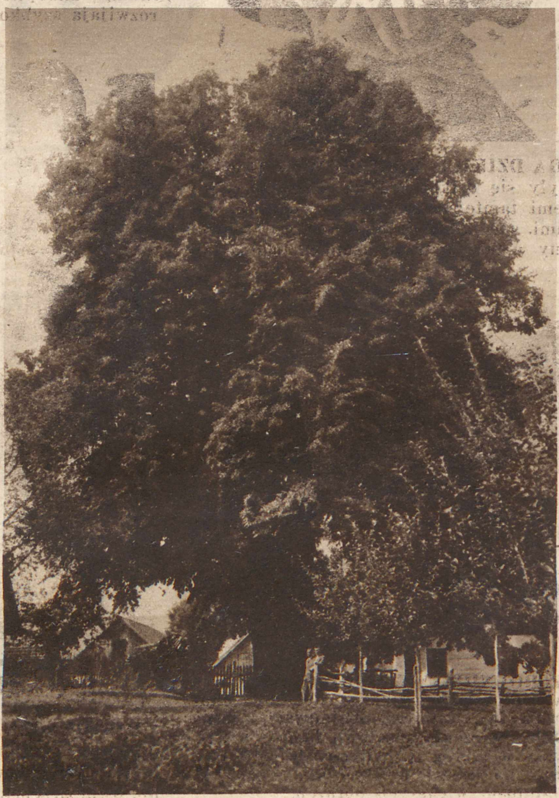
WSPANIAŁY OKA LIPY. — W ogrodzie przy plebanji w Dymowie w województwie łwowskim rośnie potężna lipa, która liczy sobie podobno bezmala pół tysiąca lat. Z trudem czterech dorosłych mężczyzn można ją opasać rękami. Imponujący ten okaz jest przedmiotem dużego zainteresowania wszystkich turystów, zwiedzających te strony.