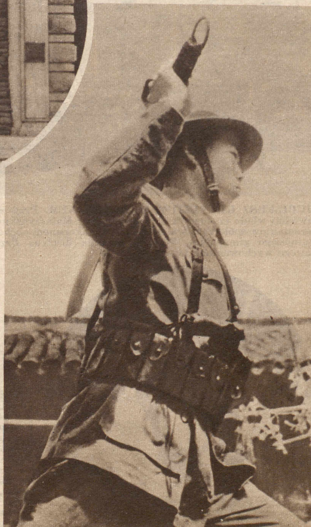
Chińska piechota po- sługuje się jeszcze dzisiaj w walce starą narodową bronią — wielkim mieczem.