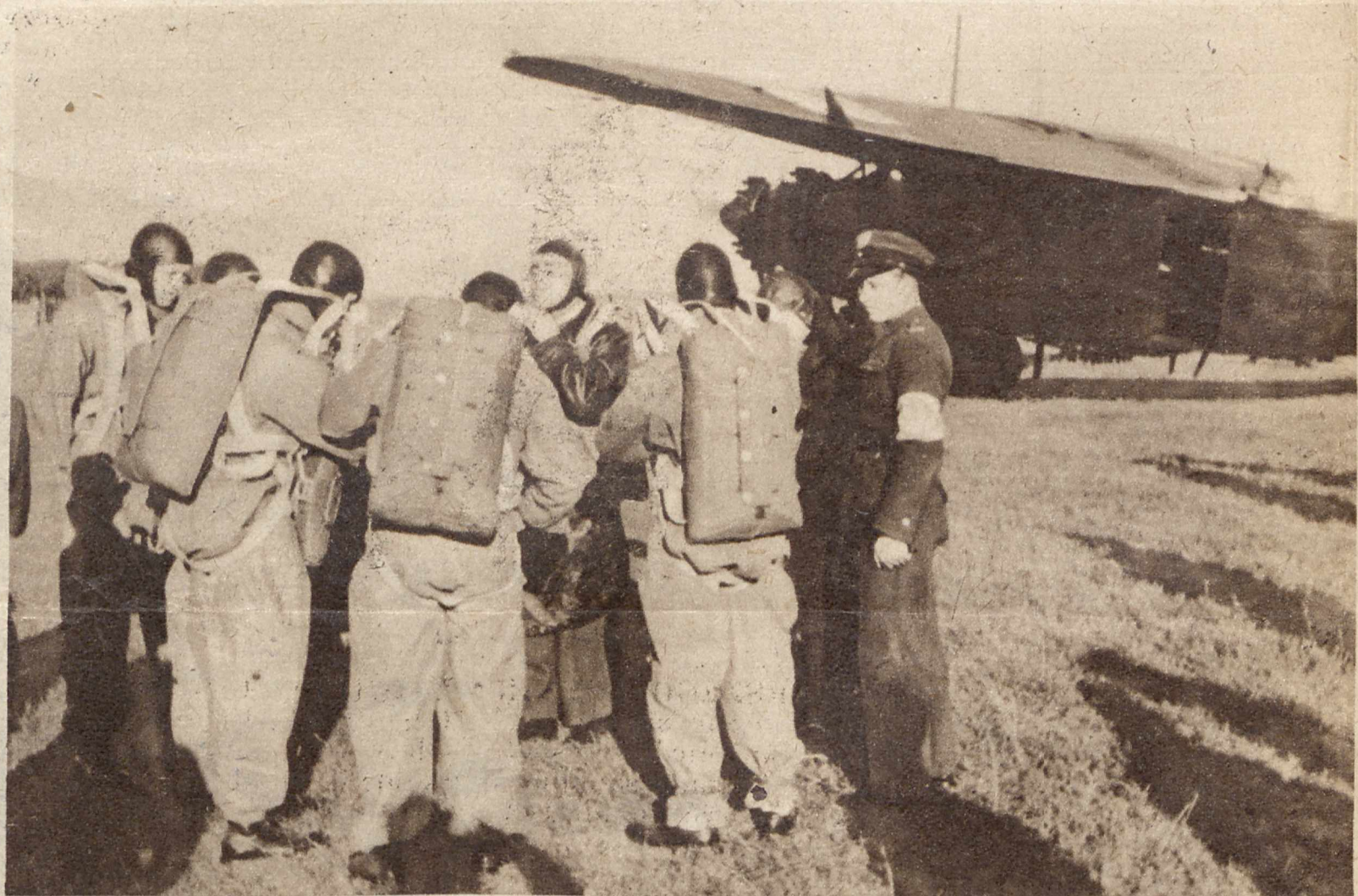
SKOKI SPADOCHRONOWE W DEBLINIE. Dęblińskie Koło L. O. P. P. urządziło z końcem października przy udziale władz wojskowych skoki spadochronowe jako zakończenie dłuższego kursu. Nasze zdjęcie przedstawia ostatnie przygotowanie do skoków, które popisywały się także panie.