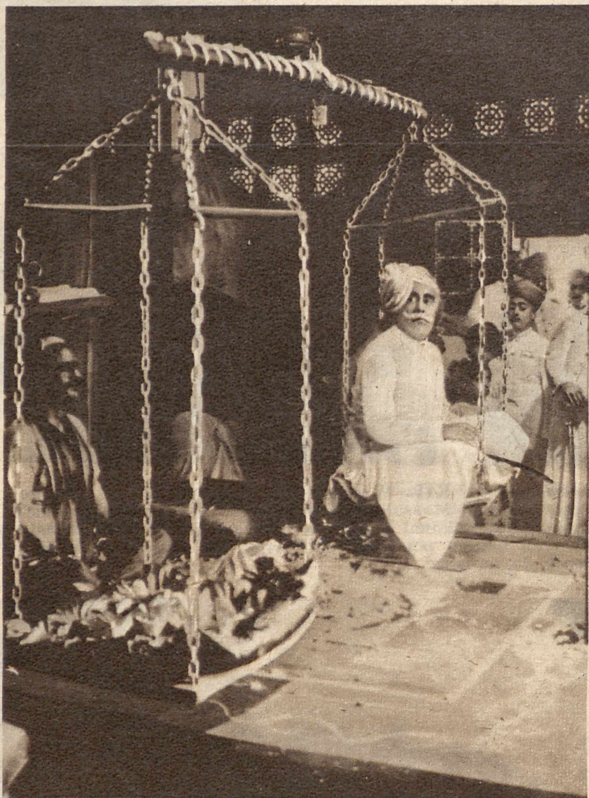
NA WAGĘ ZŁOTA. Maharadża prowincji Bilkanir w angielskich Indiach Wschodnich obchodzi jubileusz 50-lecia swoich rządów. Wstęp do uroczystości był bardzo niezwykle. Oto władca usiadł na jednej z szal wagi, a na drugą położono równy ciężar litego złota wartości 25 tysięcy funtów. Złoto to przeznaczył maharadża na dobroczynne cele w swoim państwie.