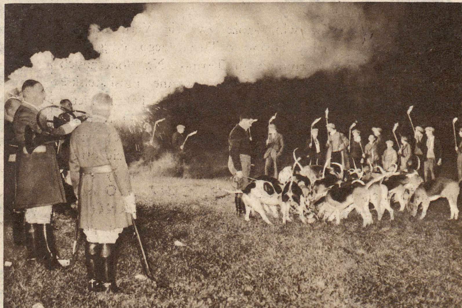
OTWARCIE SEZONU POD ZNAKIEM ŚW. HUBERTA. W zamku Chantilly we Francji odbywają się na rozpoczęcie sezonu myśliwskiego corocznie tradycyjne uroczystości. Szczególnie efektownie wygląda ich finał przy wieczornym oświetleniu pochodniami.