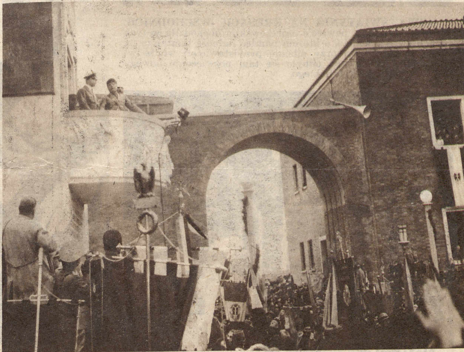
NAJMŁODSZE MIASTO ITALSKIE. W pierwszym dniu nowego, już 16-tego roku faszystowskich rządów w Italji, Mussolini w obecności delegacji niemieckiej z min. Rudolfem Hessem na czele dokonał inauguracji czwartego już z kolei miasta, założonego na terenach dawnych bagien pontyjskich, Aprilii. Na zdjęciu moment, gdy Duce z balkonu przemawiał do ludności.