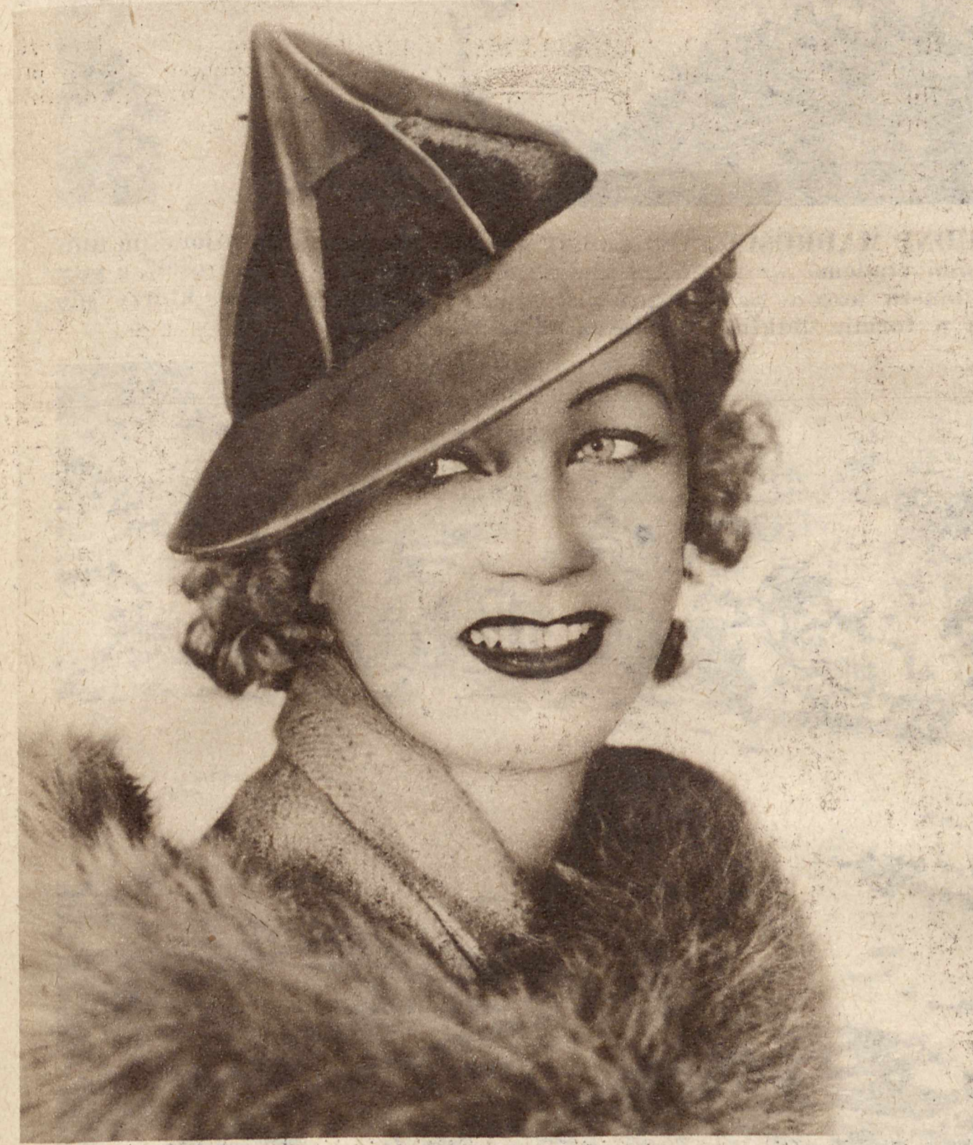
LADNY KAPELUSIK NA OBECNA PORE. Moda dzisiejsza pozostawia paniom bardzo wiele swobody w wyborze odpowiedniego fasonu, materiału i barw jesienniego kapelusika. Ten, który tutaj reprodukuje-my, skombinowany z dwóch barw: zielonej i czarnej, spodoba się niewątpliwie i naszym panom.