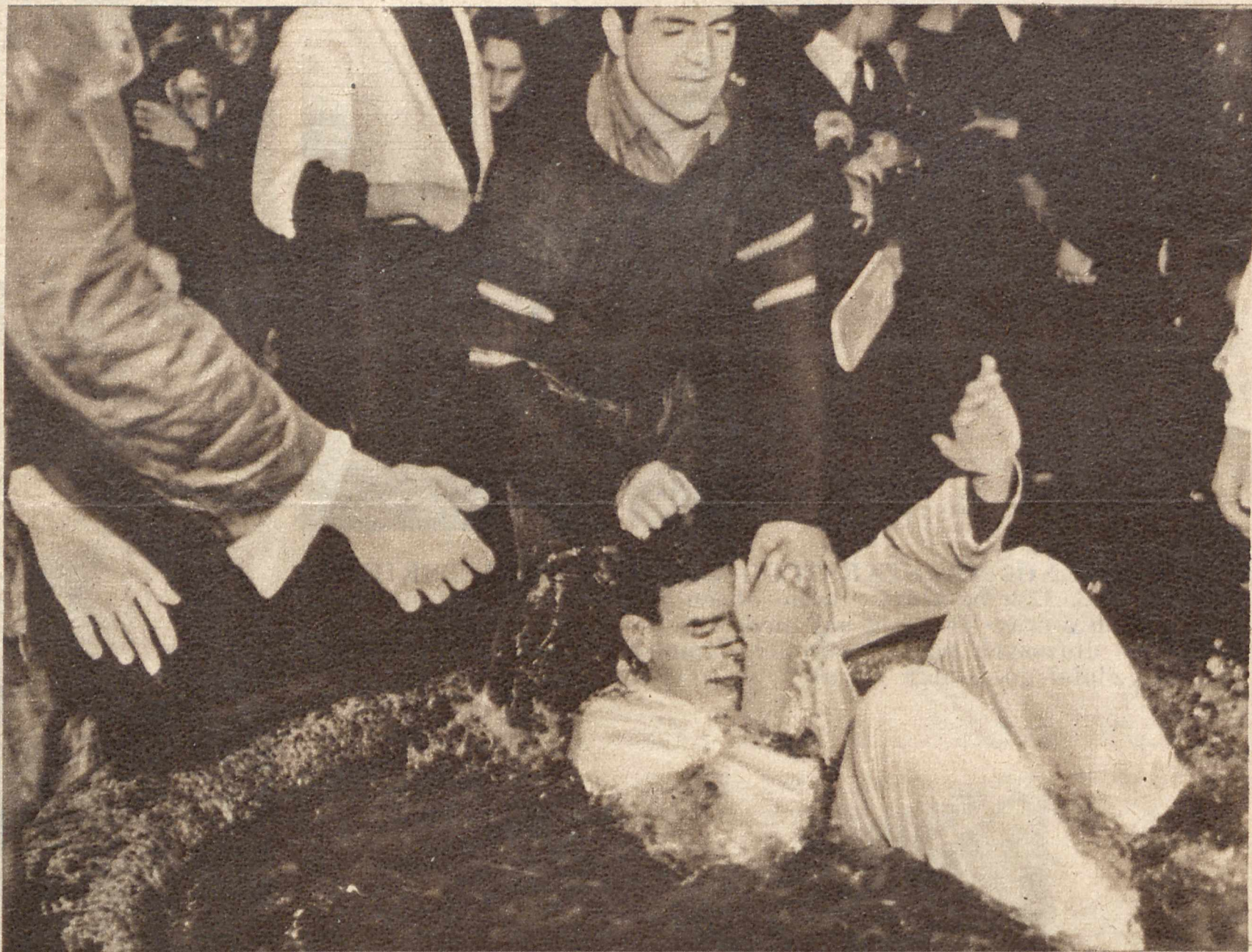
- KAPIEL W „STUDNI MĄDROŚCI“. Oryginalny obyczaj panuje na nowojorskim uniwersytecie. Nowozapisani studenci wrzucani są wieczorną porą do „studni mądrości“, a gdy z niej się wydobędą, muszą jeszcze przejść przez szpaler starszych kolegów, którzy im skapiają pozdrowień w formie dotkliwych nieraz uderzeń.