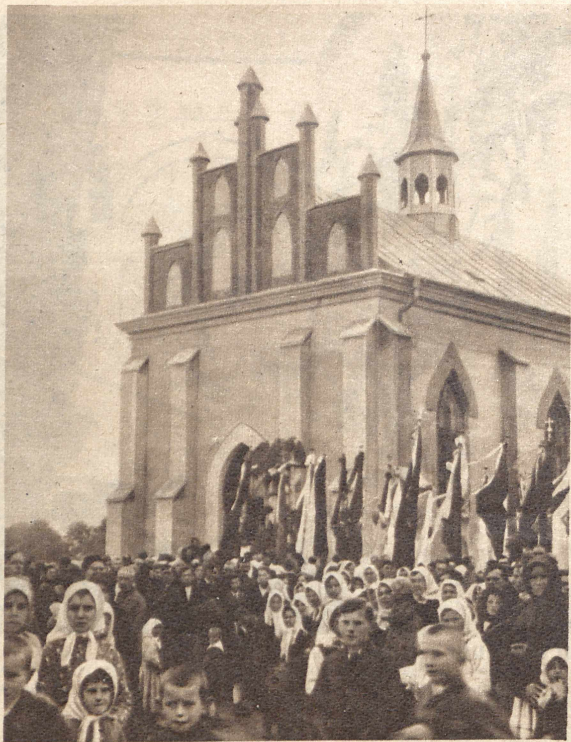
NOWA ŚWIĄTYNIA NA KRESACH WSCHODNICH. Wioska Dżurym w powiecie czortkowskim obchodziła w tych dniach wielkie święto, o którym pamięć ludność tamtejsza ma długo zachować. Oto przy udziale przedstawicieli władz cywilnych i wojskowych odbyło się tam poświęcenie nowego kościoła rzymsko-katolickiego.