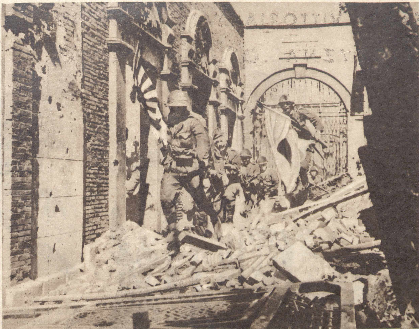
Z SZANGHAJSKICH DNI GROZY. Bomby, rzucone przez lotników japońskich, zniszczyły całą dzielnicę tego do niedawna tak bogatego miasta. Do ruin rozwalonego domu wkraczają żołnierze japońscy, a wśród nich chorąży, który na szczątkach murów zatknął sztandar zdobywców.