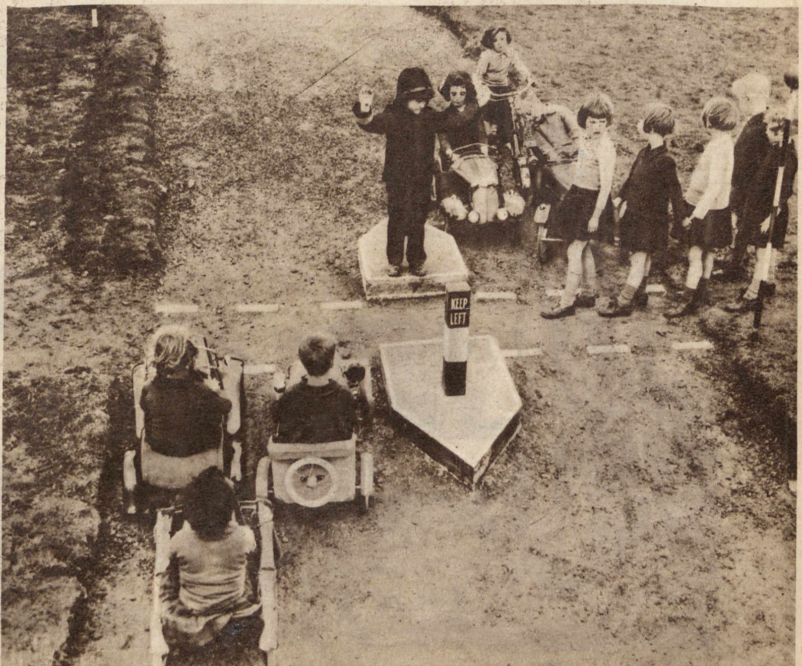
UCZMY SIĘ JEZDZIĆ I CHODZIĆ BEZPIECZNIE PO ULICACH MIASTA. W miejscowości Hutton pod Londynem w tamtejszej szkole powszechnej zaprowadzono dla dzieci bardzo praktycznie zorganizowany kurs bezpiecznego poruszania się na ulicach. W tym celu jest tam miniaturowa ulica, a uczestnicy kursu posługują się miniaturowymi autami. Na zdjęciu posterunkowy zatrzymuje te wózki, aby przechodnie mogli bezpiecznie przejść.