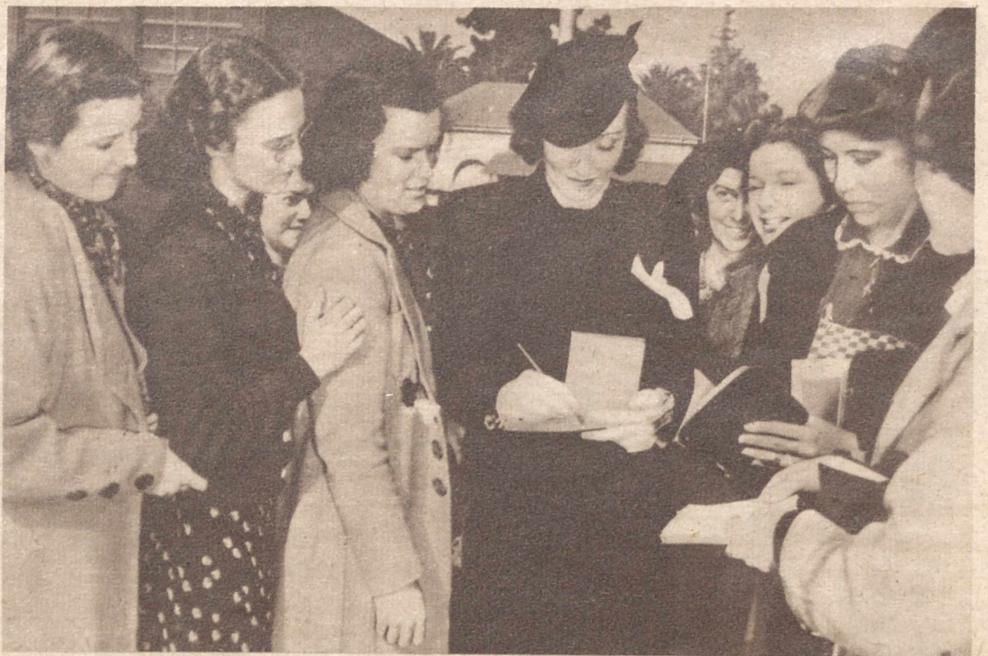
MARLENA DIETRICH ROZDAJE AUTOGRAFY. Przybyła z Europy do Kalifornji, by nakręcać nowy film. Oczywiście otaczają ją wszędzie wielbiciele jej talentu, tem natężywiej prosząc o podpisy, że Marlena zamierza podobno wkrótce wrócić już na stałe do Europy.