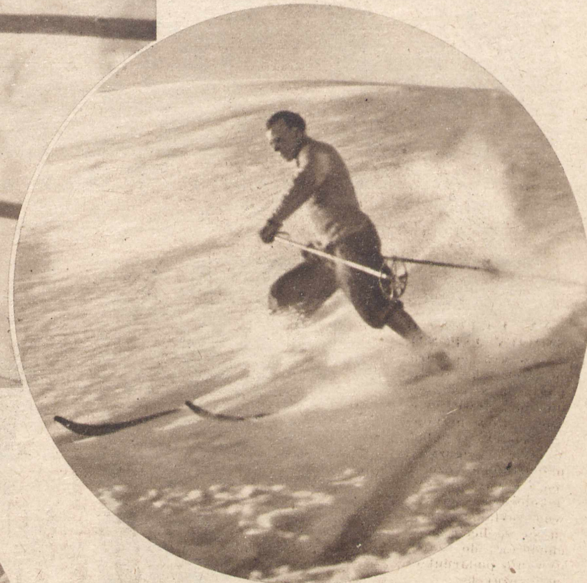
ROZKOSZNE FERJE ŚWIĄTECZNE. Kto jest samotny i nie ma rodziny, z którą spędziłby święta w domu, ten dzisiaj ma na swój smutek skuteczne lekarstwo: w górach, wśród wymarzonych warunków sportowych, zapomni o wszystkich swoich troskach i wróci do pracy odświeżony.