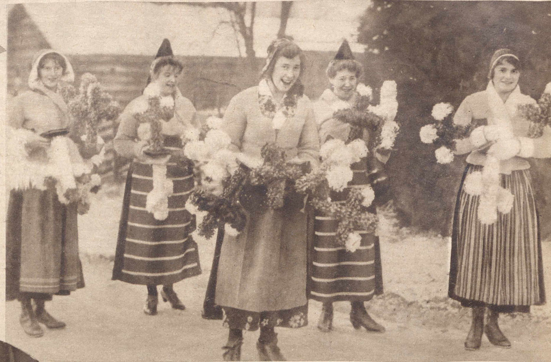
W SZWEDZKIEJ WSI. Na targi przedświąteczne przynoszą tam kobiety wiejskie lichtarze w kształcie krzyżów, sporządzone w domu. W wieczór wigilijny w każdej rodzinie szwedzkiej, utrzymującej stare obyczaje, w lichtarzach tych tkwią zapalone świeczki.

NA ULICACH STOLICY JAPONJI. Jak w krajach europejskich tak i w Japonji na kilkanaście dni już przed świętami, ulica przybiera osobliwy wygląd. Wielkie magazyny, przepelnione rozmaitemi towarami, różnokolorowa, efektowna reklama, starają się zachęcić przechodniów do zakupywania podarunków świątecznych.