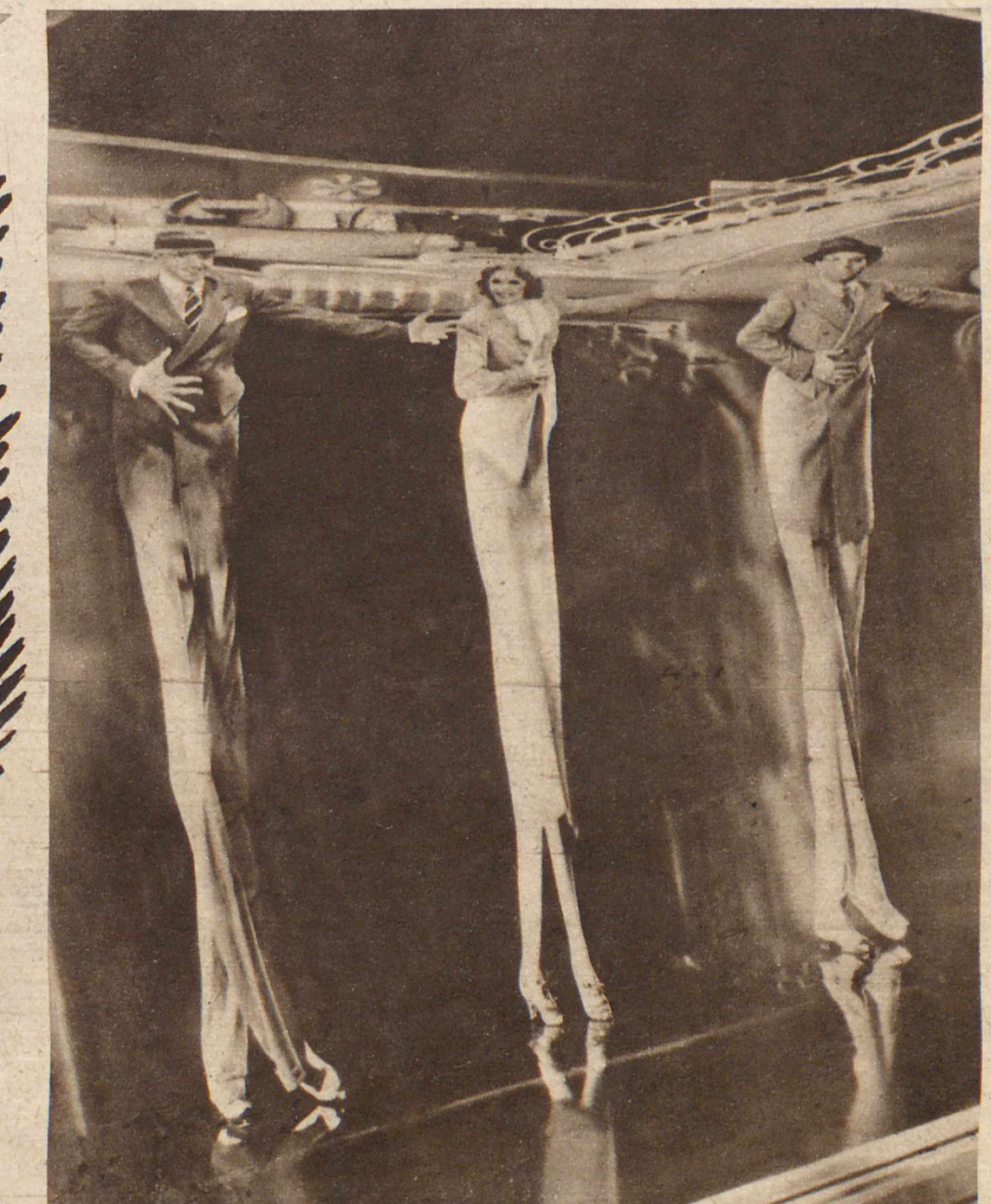
GROTESKOWE ODBICIE TANCA. Przed odpowiednio ustawionymi zwierciadłami tańczy trójka artystów filmowych: Fred Astair, Gracia Allen i George Burns. W tem odbiciu jakże zabawnie wygląda ich popis taneczny.