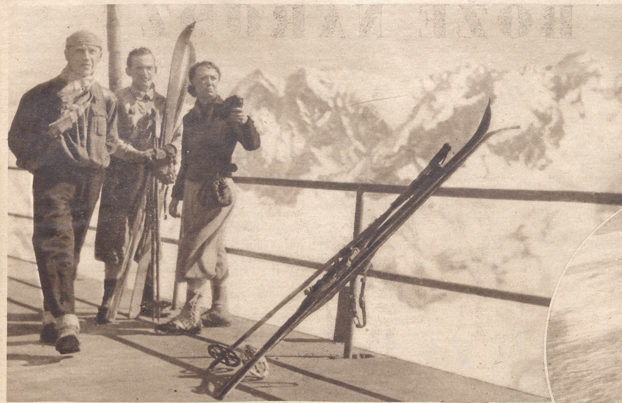
ŚWIĘTA W GÓRACH. Pod do wycieczek górskich, rozmiłowanie się w sporcie narciarskim zmieniły w znacznej mierze dawniejsze przepędzanie świąt. Wiele osób opuszcza na te dni miasta, pociągami popularnymi przenosi się w góry, by tam znaleźć upragniony odpoczynek i wzmocnienie sił. Oczywiście Kasprowy Wierch jest głównym celem tych wycieczek.