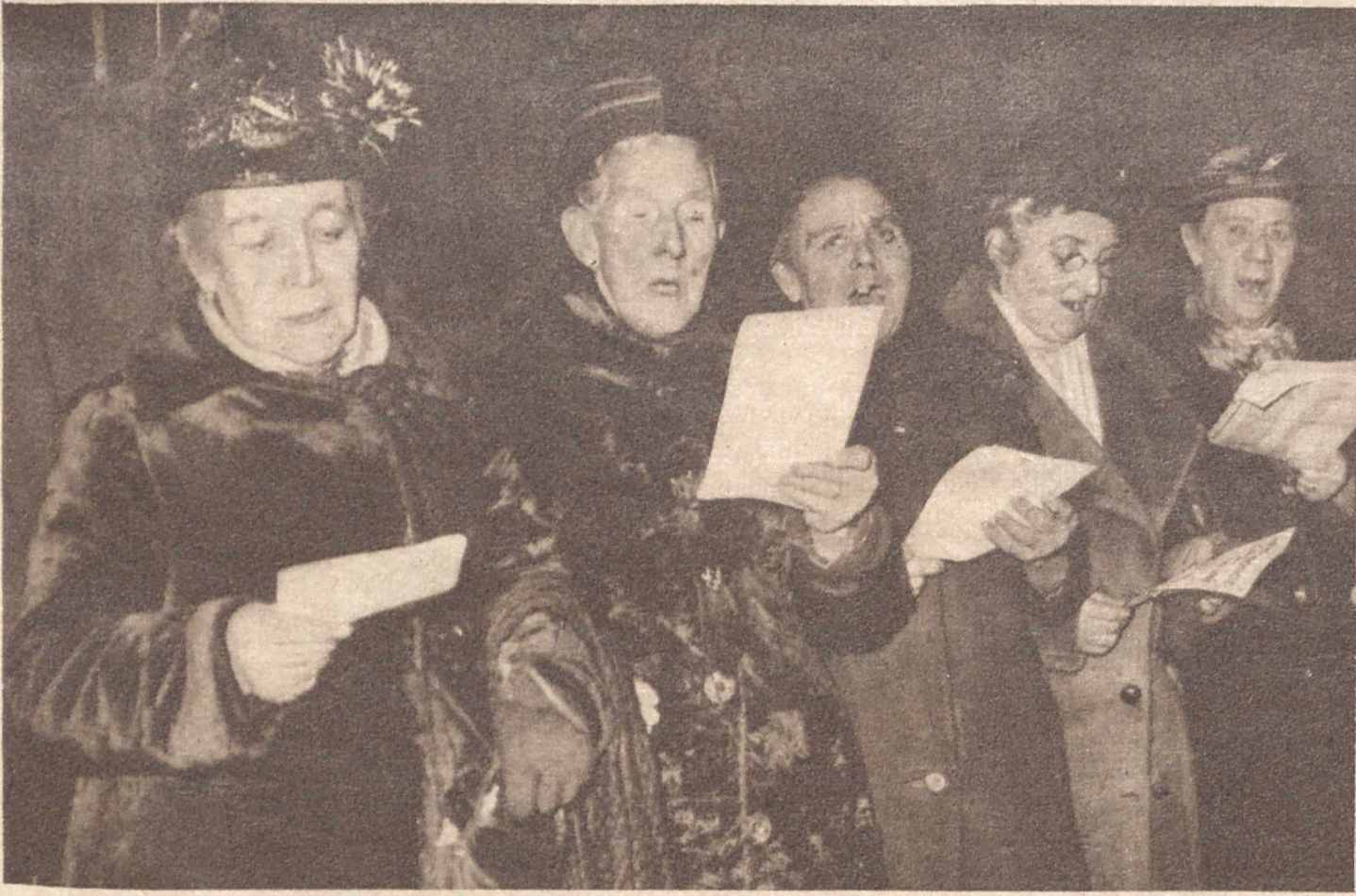
W KLUBIE „BABCY“. Jest w Londynie taki klub, którego członkiniami mogą zostać tylko starsze panie, będące już babciami. Nie smutno im tam, zwłaszcza w wigilję Bożego Narodzenia, którą witają chóralnym śpiewem.