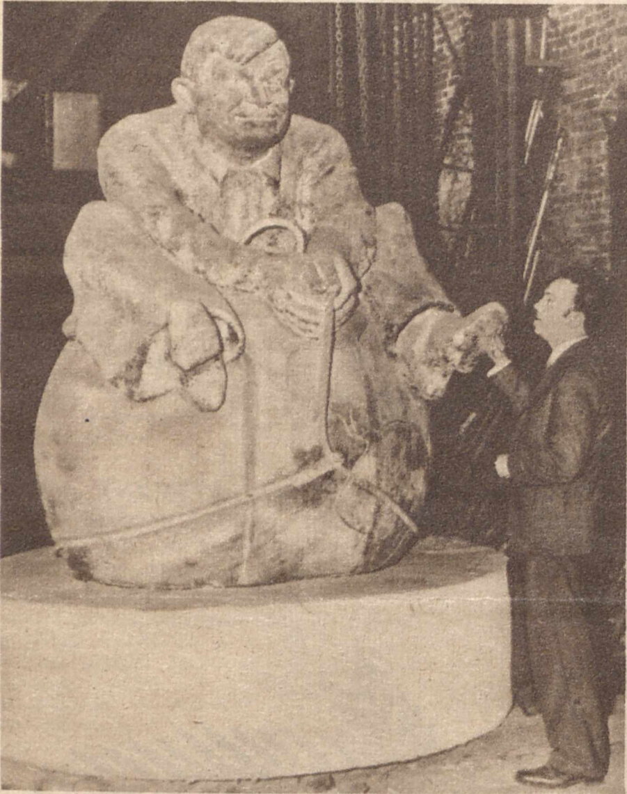
ORYGINALNY POMNIK KOMIKA FILMOWEGO. W Hollywood postawiono niedawno zmarłemu słynnemu amerykańskiemu komikowi filmowemu Will Rogers niezwykle pomnik. Artysta siedzi na kuli, przedstawiającej świat. Cały pomnik ma wysokość cztery metry.