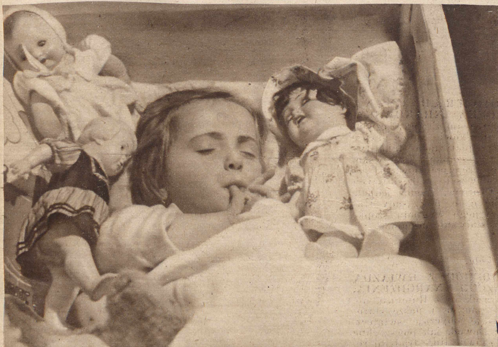
ROZKOSZNY SEN WŚRÓD PODARUNKÓW ŚWIĄTECZNYCH. Otoczyło się to male bobo lalkami, by nawet we śnie nie rozstawać się z nimi. Niechże śnią mu się dalej te rozkoszne chwile przy choince, niechaj przynajmniej w dziecięcym wieku nie miłych złudzeń nie ma.