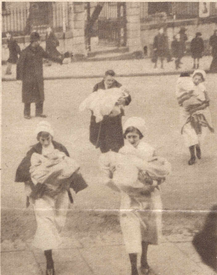
GDY PŁONIE SZPITAL DLA NIEMOWLĄT. W Bristolu (Anglja) wybuchł nagle wielki pożar w szpitalu dla niemowląt. Główną troską było nie ratowanie samego budynku, ale tych małych istot, którym w zaraniu ich życia groziła straszliwa śmierć. Na szczęście sanitariuszkom i całemu personalowi udało się wszystkie niemowlęta wynieść zdrowo z płonącego gmachu.