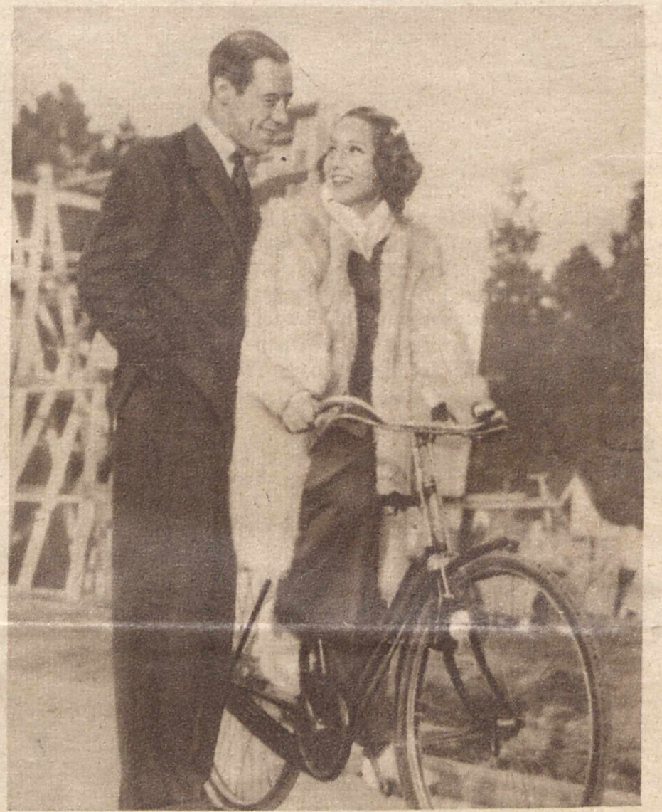
MERLE OBERON UCZY SIĘ JAZDY NA ROWERZE. W świecie filmowym biegłość w sportach jest niemal konieczna. Tak i słynna angielska gwiazda filmowa Merle Oberon bierze od swego kolegi Rex Harrison naukę jazdy na rowerze w pracowni filmowej Denham pod Londynem.