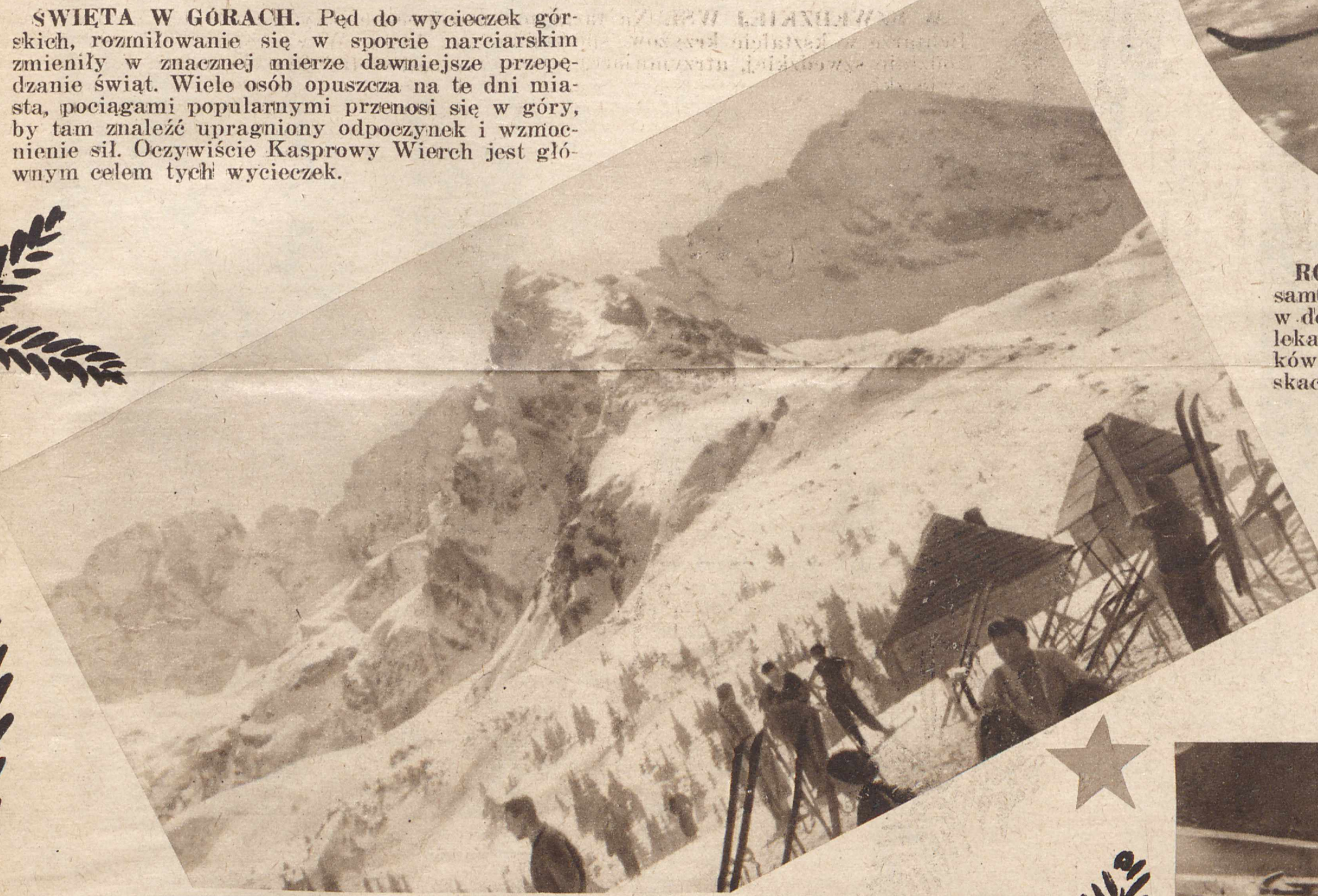
PRZED SCHRONISKIEM. Zjada się do Zakopanego na święta Bożego Narodzenia turyści, sportowcy i wycieczkowicze z całej Polski. Oto wspaniały widok Hali Gąsienicowej, którą zapełni rozgwar narciarzy, zazwyczających tu rozkoszy śniegu.