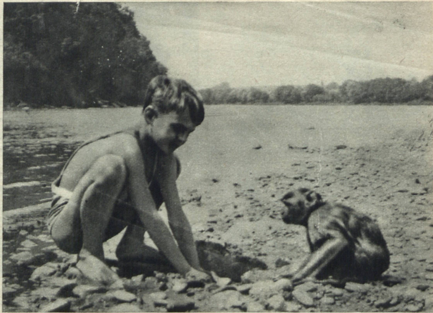
„Egzotyczny gość na polskiej plaży“.