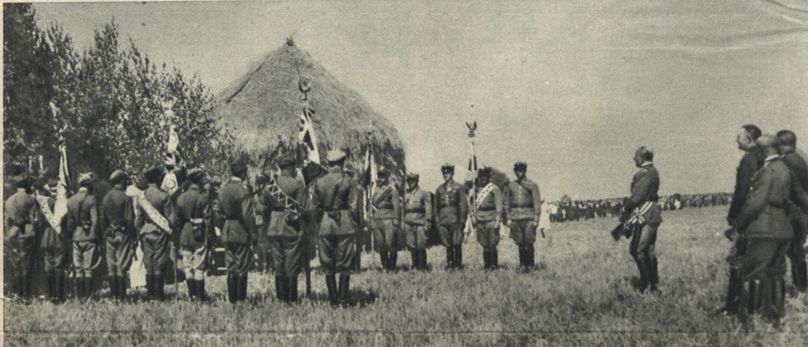
Manewry 2-giej Dywizji Kawalerji pod Siedlcami. Msza polowa; widoczny na zdjęciu gen. Wieniawa-Długoszowski.