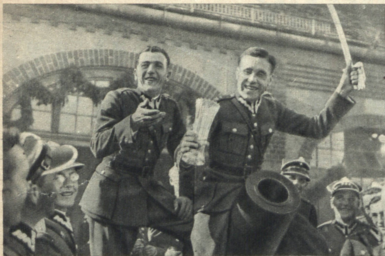
Nowi oficerowie. Rozradowane twarze nowych podporuczników podczas obiadu żołnierskiego w Toruniu.