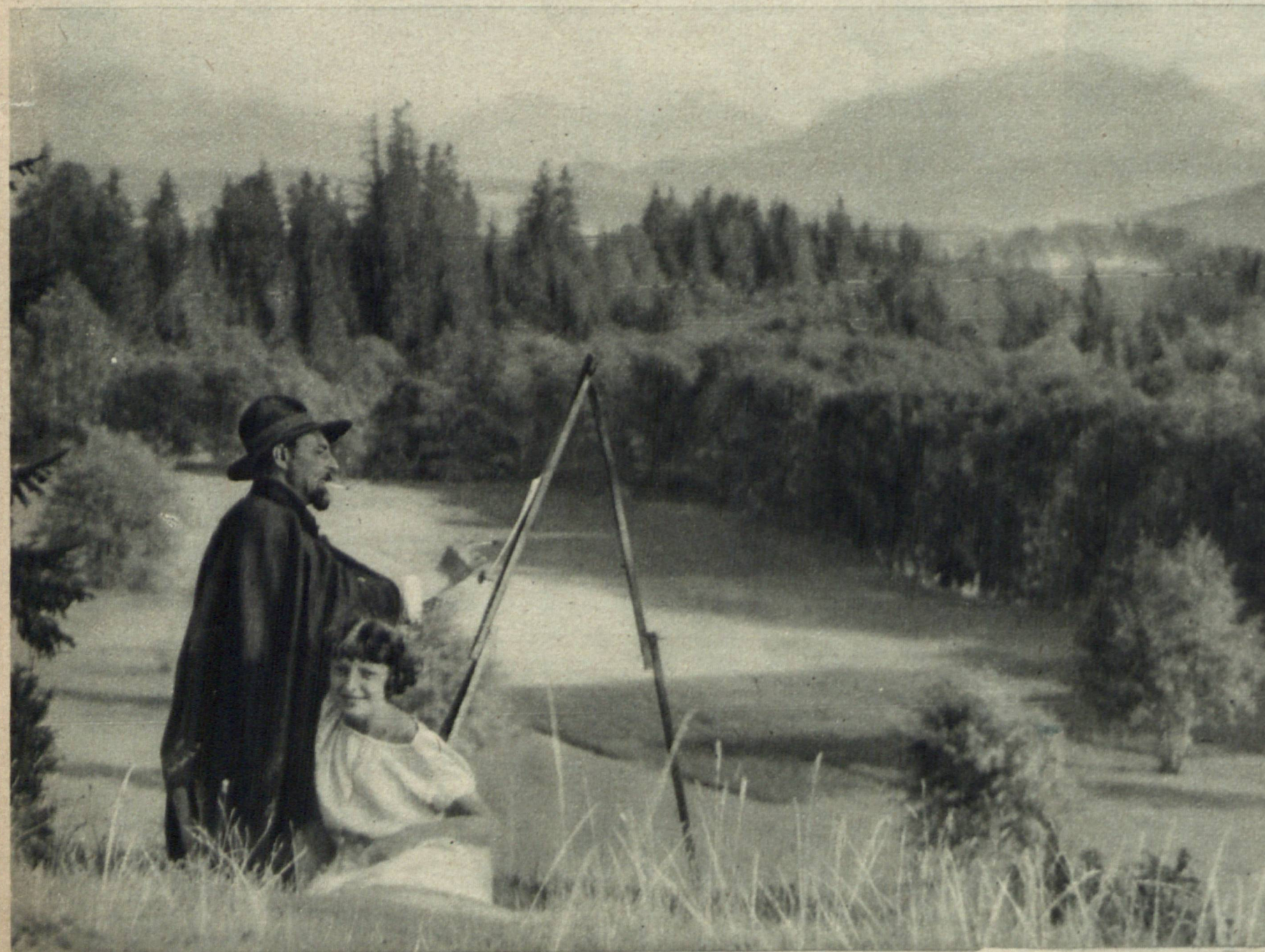
„Artysta z córką“.