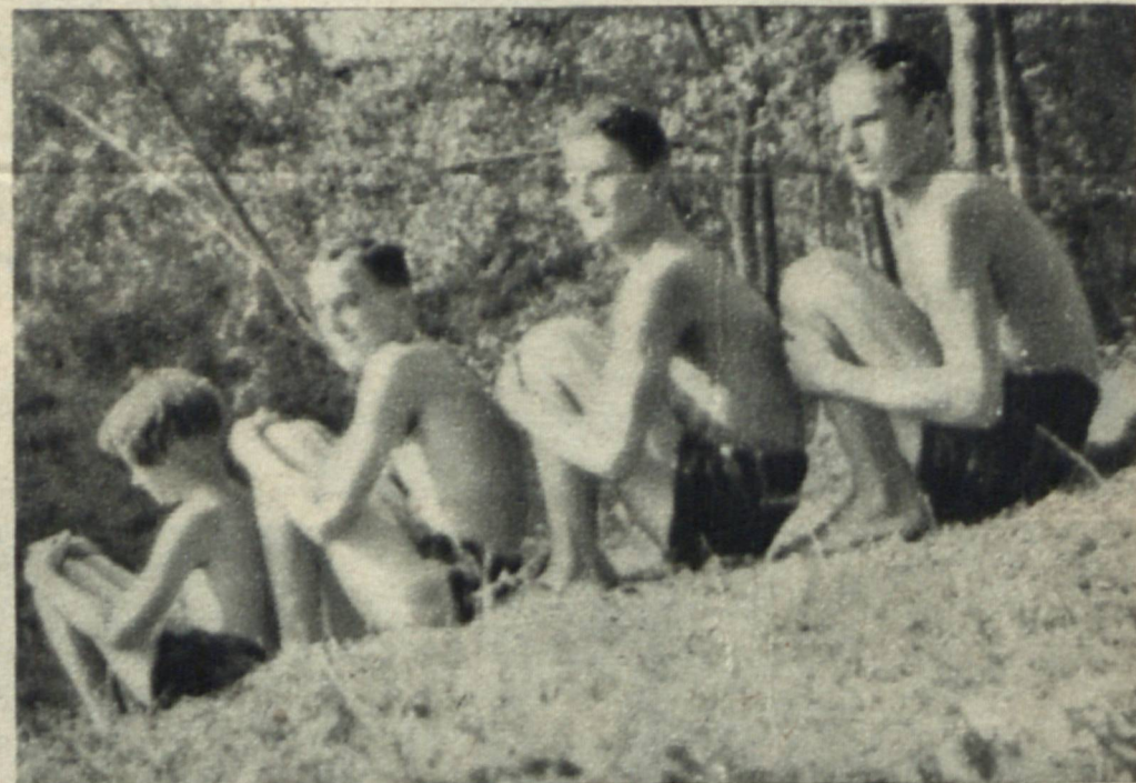
„Nad brzegiem rzeki“.